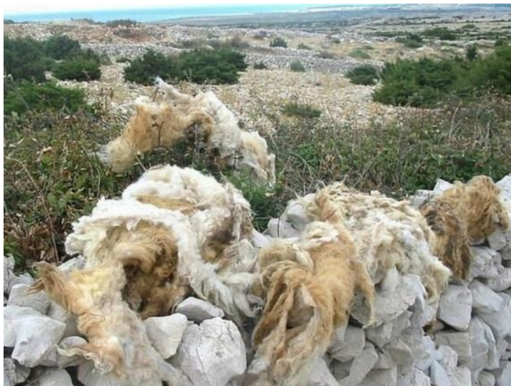
Slika 3: Odbačena vuna na otoku Braču