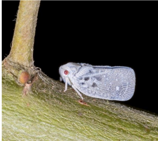
Slika 8: Medeći cvrčak

Pošto se štetnik širi i sadnim materijalom, važno je spriječiti uvoz sadnoga materijala iz rasadnika zaraženih medećim cvrčkom. Štetnik se suzbija insekticidima na osnovi djelatne tvari alfacipermetrin (piretroidi). Osim insekticidima medećeg cvrčka moguće je suzbiti i prirodnim neprijateljima. Prirodni neprijatelji kojima se suzbija medeći cvrčak su parazitne osice Neodrynus typhlocybae (Maceljski i sur., 2006.).