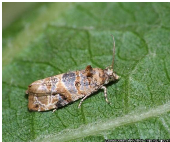
Slika 3: Pepeljasti grozдоб moljac