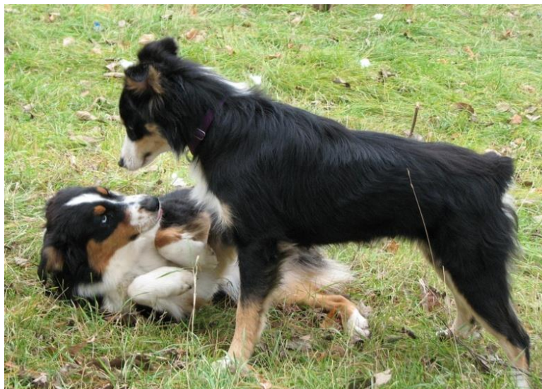
Slika 15. Dominantno i submisivno ponašanje pasa

odbijaju slušati slabije članove čopora, odnosno obitelji, i općenito ljude i životinje koje se ne znaju postaviti u takvoj situaciji. Svoju dominaciju pokazuju pogledom, gundanjem i govorom tijela. Takvim psima se treba pristupiti s odlučnošću i disciplinom, te ih treba obuzdati i kontrolirati treninzima. Tako da njihova dominacija ne bi eskalirala u tiraniju i agresiju.