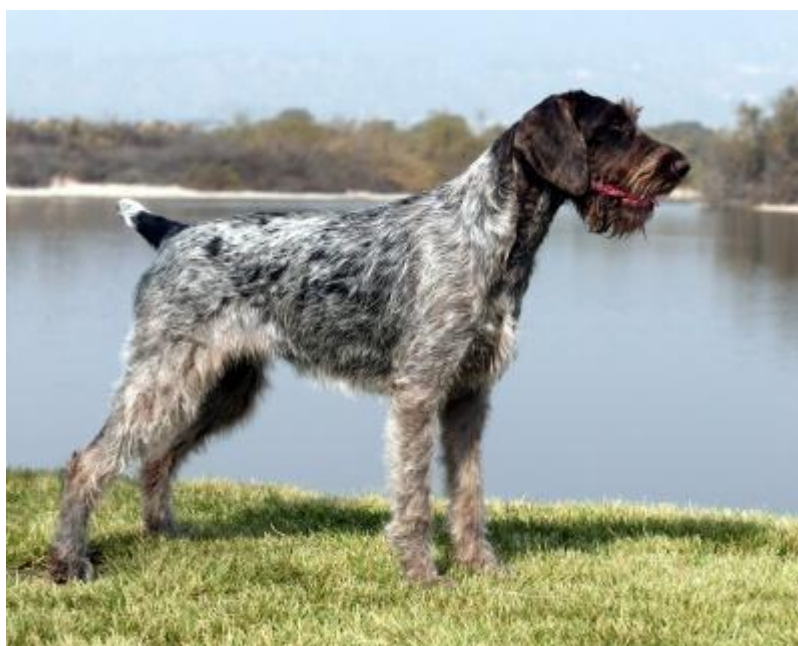
Slika 6. Snažna konstitucija (oštrodlaki njemački ptičar)

Snažnu konstituciju imaju psi čvrste i skladne građe. Dužina glave jednaka je otprilike dužini lopatice, odnosno dvije trećine dužine vrata. Vrat je blago zaobljen, greben je izražen, a grudi su duboke i zaobljene. Kostur je čvrst (niti lagan, niti težak), mišići su dobro razvijeni (prepoznatljiva izraženost pojedinih mišića). Psi ove konstitucije živahnog su temperamenta i otporni na bolesti i nepovoljne vanjske (ekološke) čimbenike. Karakterizira ih izuzetna izdržljivost (dugo mogu trčati). Predstavnici ovog tipa su: goniči, jamari, ptičari i dr.