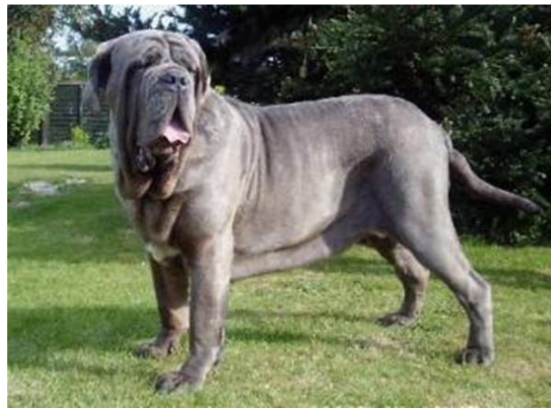
Slika 8. Limfatična konstitucija (napuljski mastif)

Limfatičnu konstituciju imaju psi čije je tijelo vrećastog oblik. Izražen je višak kože na cijelom tijelu, a osobit pod vratom (podvoljak, podgušnjak ili fanon). Uzrok tome je velika razvijenost limfatičnog tkiva po koje je ovaj oblik konstitucije i dobio ime. Psi ovakve konstitucije flegmatičnog su temperamenta. Karakterizira ih tromost u kretanju, nevoljkost za rad i smanjena inteligencija. Nisu izdržljivi i brzi u radu. Predstavnici ovog tipa su mastifi.