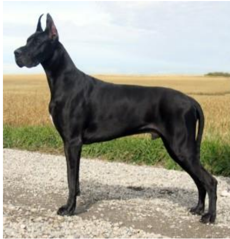
Slika 2. Molosoidni tip (njemačka doga)

tome. Njemačke doge npr., vrlo su privržene svojim vlasnicima, druželjube i prijateljski nastrojene. One su poslušni psi za pratnju i obitelj, sa visokim pragom osjetljivosti te bez agresivnog ponašanja. Također su i vrlo samouvjereni i neustrašivi psi koji se koriste za čuvanje i zaštitu.