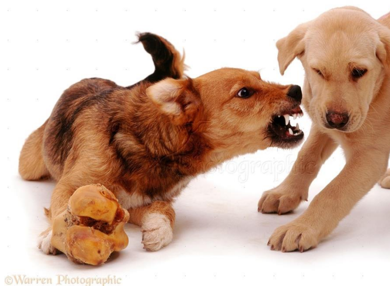
Slika 18 Posesivna agresivnost (obrana hrane)

Ova tri tipa agresivnosti vrlo su slična i uključuju obrambeni stav psa prema njemu bitnim resursima.