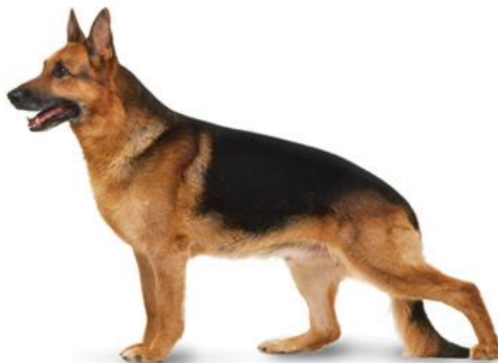
Slika 1. Lupoidni tip (njemački ovčar)

U pasa lupoidnog tipa (lupus – sličan vuku) glava je nalik vodoravnoj piramidi, imaju dugu i usku gubicu, te tanke i prilježne usne, imaju neizražen stop, a tijelo je skladno i okretno. Građa im je slična vuku, a među njih spadaju svi ovčarski psi, dio pastirskih pasa, terijeri, polarni psi, pinči, gubičari i dr. Psi lupoidnog tipa, poput npr. Njemačkog ovčara, izuzetno su inteligentni, odani i poslušni. Vrlo hrabri, odvažni, znatiželjni ali i oprezni psi. To su pouzdani psi, kvalitetnog karaktera, koji žele udovoljiti svom vlasniku. Zbog visoke inteligencije jako brzo uče i lako se treniraju pa se često koriste kao policijski, vojni i spasilački psi, te kao psi tragači. Imaju puno energije, a ponekad su dominantni i oštri prema drugim psima, te im je zbog toga vrlo bitna rana socijalizacija.