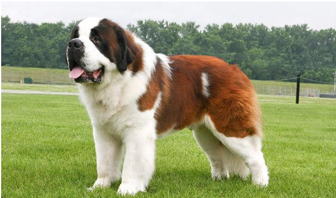
Slika 5. Gruba konstitucija (bernardinac)

Gruba konstituciju imaju psi grubih i teških kostiju. Glava je u odnosu na tijelo teška, velika i široka. Koža je debela i neelastična, a dlaka debela i gruba. Mišićje je oskudnijeg izgleda. Zbog težine cjelokupnog tijela zglobovi su razvijeniji, a šape su krupne i snažne. Psi ovakve konstitucije mirnog su temperamenta. Predstavnici ovog tipa konstitucije su: šarplaninci, bernardinci i dr.