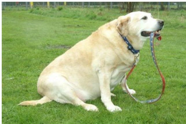
Slika 13. Tovna kondicija (labrador)