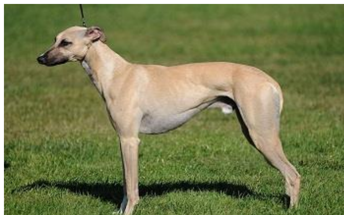
Slika 4. Graoidni tip (mali engleski hrt)

Graoidni tip je skupina koju karakterizira dugačka i uska glava s malenim i unatrag polegnutim, a ponekad i uspravnim uškama. Gubica im je duga i uska s uskim i priležećim usnama. Imaju neznatan stop i vitko tijelo s tankim nogama i jako uskim trbuhom. Potječu s područja Sredozemlja, ishodišta naše civilizacije, te su već na papirusima iz najstarijih razdoblja Egipta postojali njihovi crteži ( www.upph.hr ). To su svi hrtovi i hrtoliki psi. Hrtovi su nježni, tihi, privrženi i prijateljski nastrojeni psi. Prvenstveno su se koristili za lov, a danas se najčešće koriste u utrkama pasa i kao psi za izložbe. Engleski hrt nastao je selektivnim uzgojem u želji za stvaranjem brze i hitre pasmine koja će biti savršena za lov. Poznat je kao jedan od najbržih pasa na svijetu koji može trčati do 60 km/h, te ima nevjerovatnu sposobnost da u trku uhvati plijen.