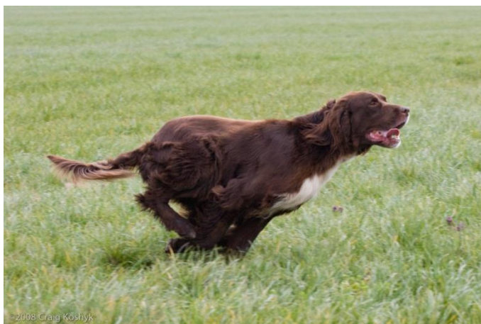
Slika 3. Brakoidni tip (njemački dugodlaki ptičar)