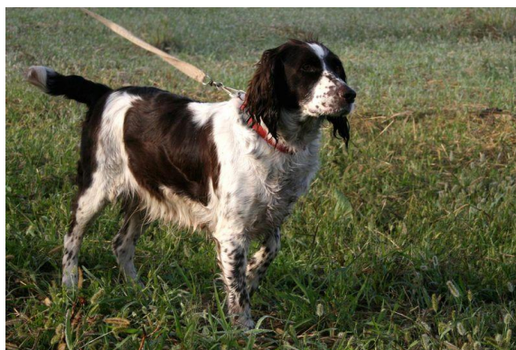
Slika 9. Radna kondicija (njemački prepeličar)

Karakterizira je odgovarajuća prehrana i vježba koja omogućuje psu obavljanje zadanih radnji i utječe na oblikovanje njegovog izgleda. (Tucak i sur., 2003). Psi mogu biti, ovisno o njihovoj namjeni, izloženi velikim naporima te moraju posjedovati izvjesne rezerve masti tj. rezerve energije. Npr. lovački pas koji je aktivan tijekom čitavog lovnog dana, mora izdržati isto tempo tijekom cijelog dana, te zbog toga mora imati višak rezervne energije kako bi mogao izdržati taj napor. Kod ove kondicije zglobovi i tetive su dobro razvijeni, a mišići plećke i pojedine druge grupe mišića i moraju se razlikovati i pri najmanjem pokretu, posebice mišići leđa. Također, moraju biti uočljive i koštane izbočine ( kukovi, greben, lopatica), dok se obrisi rebara ne smiju uočavati.