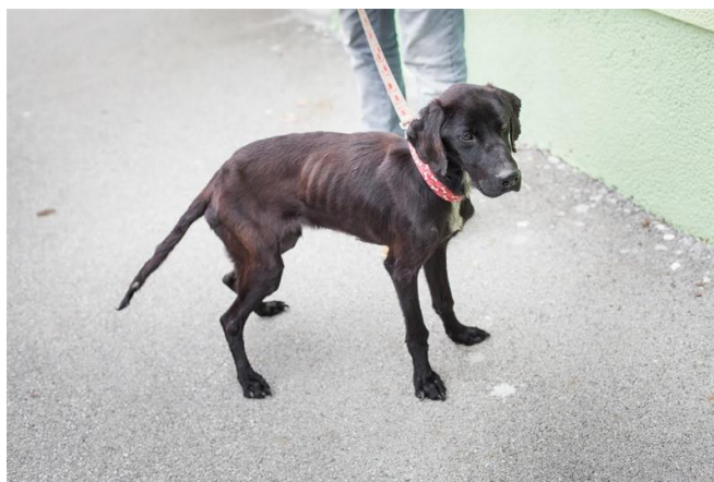
Slika 14. Izgladnjela kondicija

Izgladnjela kondicija se također očituje u izgledu i pokretljivosti psa. Pas ima izgled „hodajućeg kostura“ obavijenog kožom, a mišići su atrofirali. Uzrok takvom obliku kondicije su gladovanje i bolesti (Tucak i sur., 2003). Pas takve kondicije se ne može koristiti za rad jer se brzo umara i nema želju za radom, niti strast za lovom. Kod ženki izostaje refleks gonjenja (estrus) ili daju manji broj štenadi ( www.kdkula.org ).