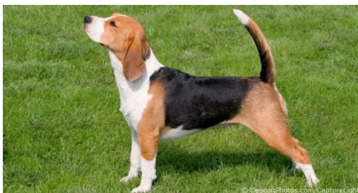
Slika 12. Izložbena kondicija (bigl)

Varijanta rasplodne kondicije je izložbena kondicija pri kojoj pas nije niti mršav niti debeo kao i kod rasplodne kondicije. Psi s ovom kondicijom mogu imati manje ili veće naslage masti. S oblinama kod pasa s većim naslagama masti se mogu prikriti lake konstitucijske mane (npr. blago ulegnuta linija leđa, slabije izražen but itd), ali ne i teže mane.