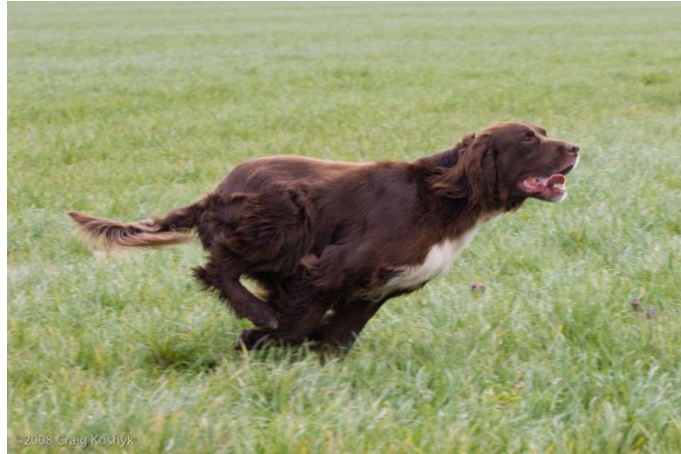
Slika 3. Brakoidni tip (njemački dugodlaki ptičar)