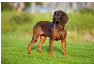
Slika 11. Rasplodna kondicija (bavarski krvosljednik)

Izgled pasa karakterizira niti mršavost niti debljina. Takav izgled postiže se odgovarajućom prehranom i osigurava uspješnu oplodnju. Predebele ženke teško ostaju gravidne, teško se porađaju i imaju manji broj potomaka. Predebeli mužjaci obično nemaju izraženu volju za parenjem. (Tucak i sur., 2003)