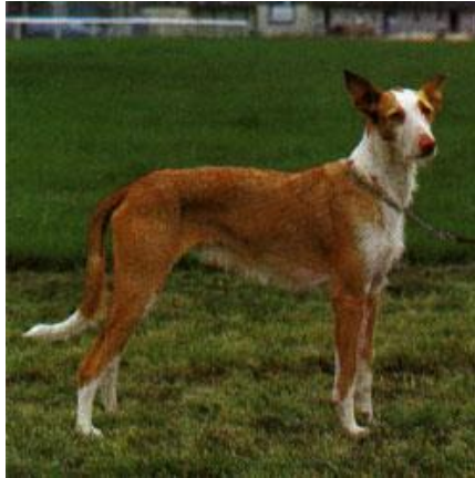
Slika 7. Fina konstitucija (ibički hrt)