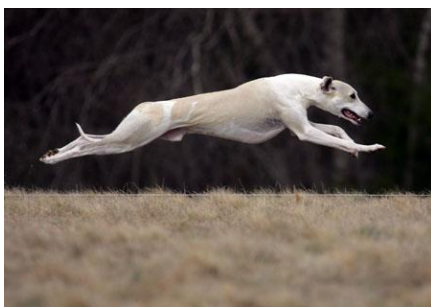
Slika 10. Trkaća kondicija (mali engleski hrt)