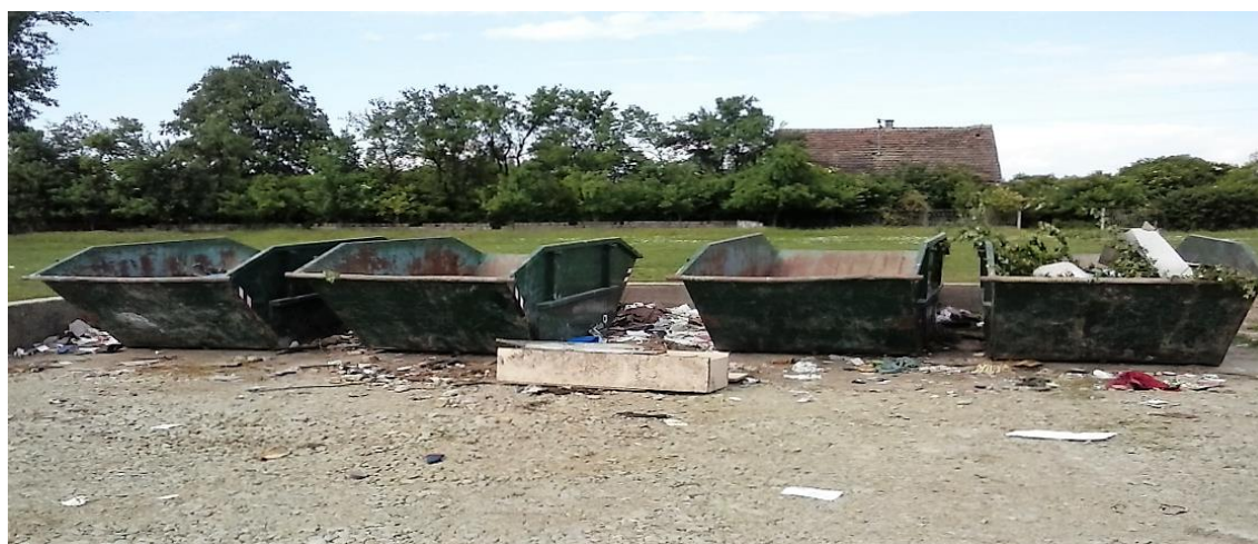
Slika 9. Kontejneri za odlaganje građevinskog otpada

Građevinski otpad na području Općine Erdut ne zbrinjava se na odgovarajući način. Gotovo polovica građevinskog otpada završi na odlagalištima komunalnog otpada, kao i divljim odlagalištima, što višestruko povećava troškove sanacije, zauzima korisni volumen odlagališta i nove površine. Slika 5. prikazuje kontejnere za odlaganje građevinskog otpada na odlagalištu.