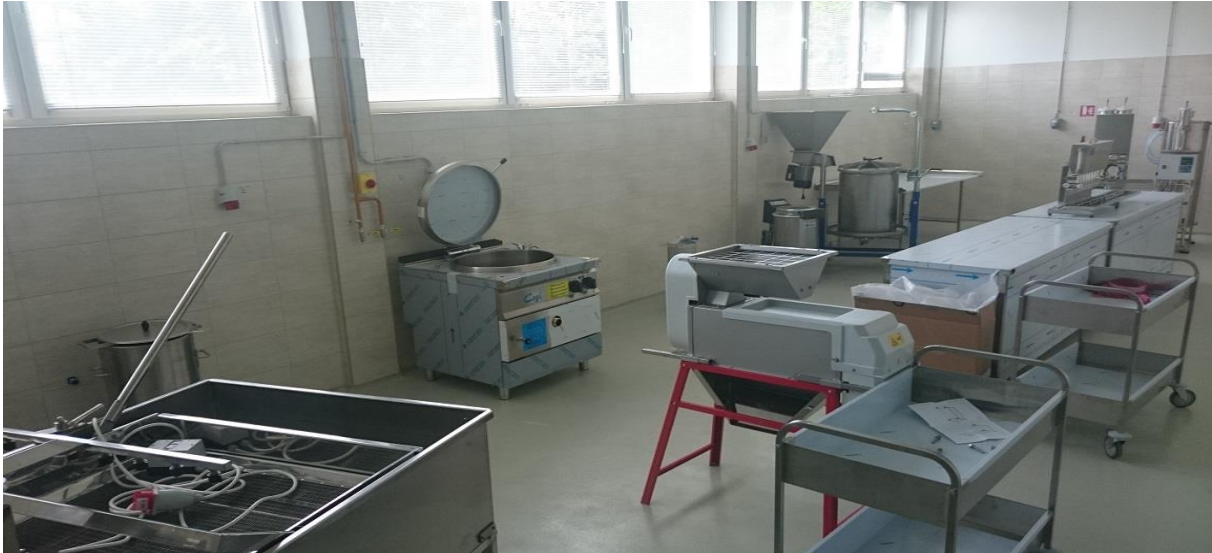
Slika 7. Proizvodna linija u višenamjenskoj hali