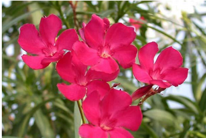
Slika 22. Cvijet Nerium oleander L.

Cvjetovi su krupni, skupljeni u paštastim cvatovima na vrhovima grana i ugodnog su mirisa. Dvostrukog su ocvijeća, čaška je građena od 5 lapova, vjenčić ima 5 latica ružičaste, crvene ili bijele boje. Cvatu od lipnja do rujna (Slika 22.).