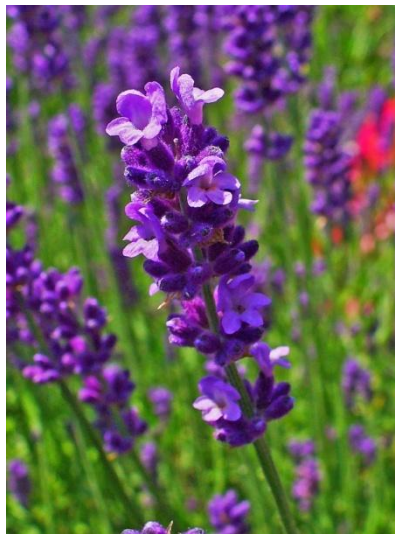
Slika 11. Cvat Lavandula L.

Lavanda je posuta bijelim dlačicama te se naizgled čini kako je cijela biljka sive boje. Cvjetovi su sitni i sakupljeni te čine pršljenaste klasove na vrhu izdanaka. Zigomorfni su s plavim laticama. Vreteno cvijeta je dugačko i slabo dlakavo. Čaška je dugačka oko 5 mm sivo-plavkaste boje, cjevasta i obrasla dlakama (Tomašević, 1982.) (Slika 11.).