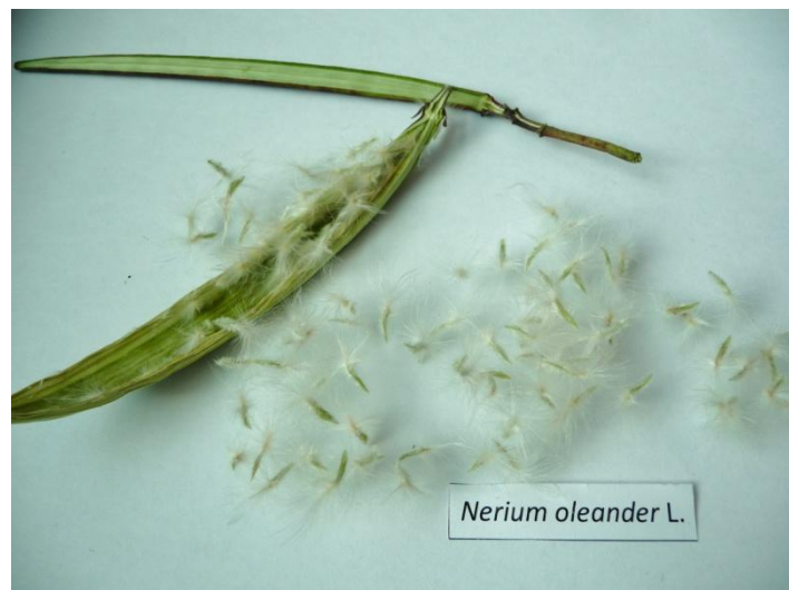
Slika 23. Plod Nerium oleander L.

Plodovi su dugi 10-20 cm, smješteni su na dugačkoj stapci te sadrže dva tobolca od kojih svaki sadrži puno sjemenki prekriveni dugim smeđim dlačicama ( http://www.plantea.com.hr/oleander/ ) (Slika 23.).