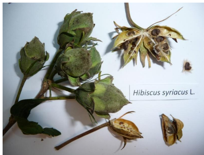
Slika 8. Plod Hibiscus syriacus

Plod je višesjemena čahura(Slika 8.) ( http://www.plantea.com.hr/vrtni-hibiskus/ ).