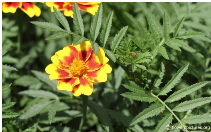
Slika 3. Listovi Tagetes L.

Listovi su nasuprotno smješteni, perasti, građeni od kopljastih liski(Slika 3.) ( http://www.plantea.com.hr/kadifca/ ).