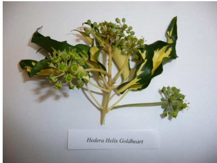
Slika 17. Cvijet Hedera helix L.