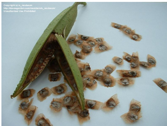
Slika 2. Sjeme Campsis radicans