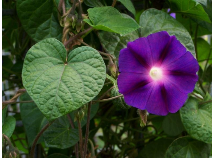
Slika 19. List i cvijet Ipomoea purpurea