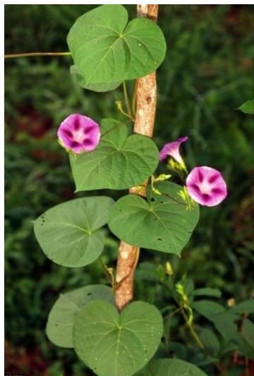
Slika 18. Stabljika Ipomoea purpurea

Stabljika može biti razgranata ili jednostavna, te raste u visinu do 3 m. Slabo dlakava do pustenasta s kratkim spljoštenim trihomama (Slika 18.).