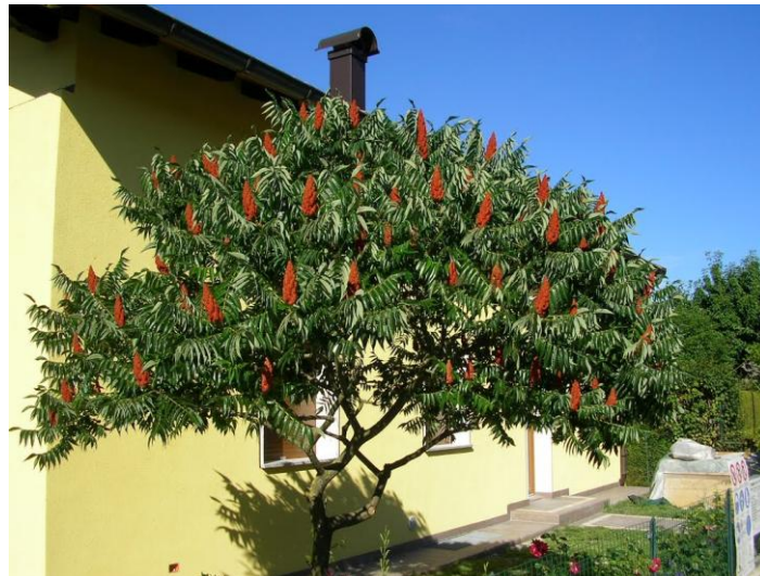
Slika 24. Rhus typhina L.

Kiseli ruj raste kao grm ili najčešće kao tek 5-6 metara visoko stablo, iako može doseći visinu i 12 metara. Krošnja je široka, mladi izboji su tamnocrvenkasti, debeli i obrasli gustim dlakama ( http://www.plantea.com.hr/kiseli-ruj/ ) (Slika 24.).