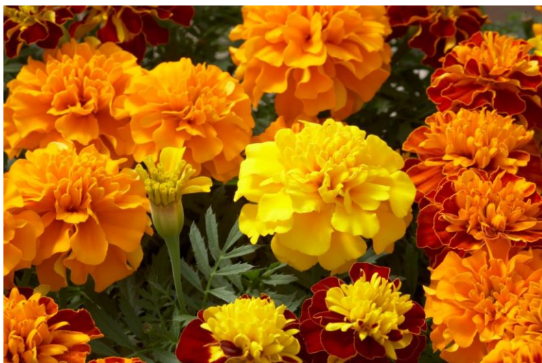
Slika 4. Cvijet Tagetes L.