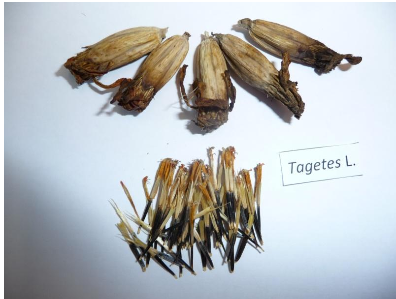
Slika 5. Osušeni cvjetovi Tagetes L.