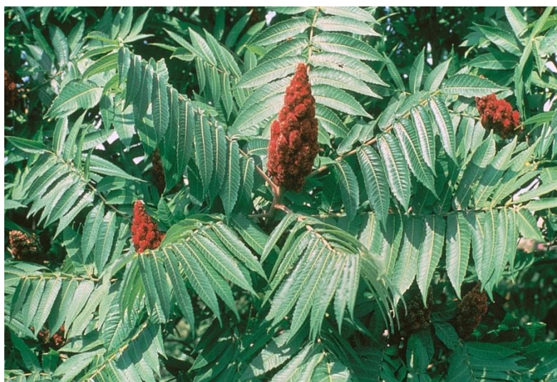
Slika 26. List i plod Rhus typhina

Listovi su naizmjenični, dugi do 50 cm, neparno perasti, sastavljeni od mnogih lancetastih, dugo ušiljenih i grubo pilastih lisaka, na licu su zeleni, naličje je sivozeleno(Slika 26.).