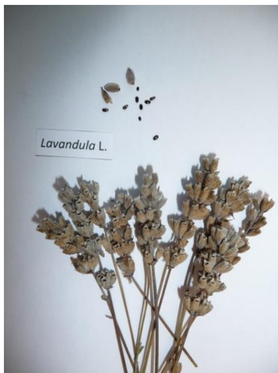
Slika 12. Plod Lavandula L.