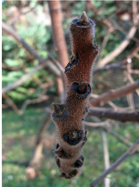
Slika 25. Mladi izboj Rhus typhina