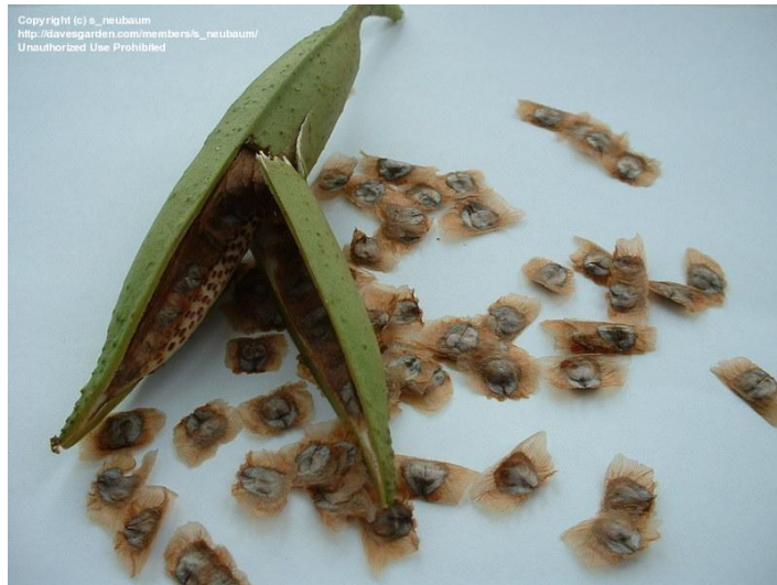
Slika 2. Sjeme Campsis radicans