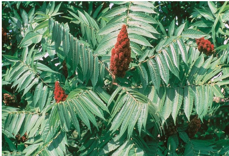
Slika 26. List i plod Rhus typhina

Listovi su naizmjenični, dugi do 50 cm, neparno perasti, sastavljeni od mnogih lancetastih, dugo ušiljenih i grubo pilastih lisaka, na licu su zeleni, naličje je sivozeleno(Slika 26.).