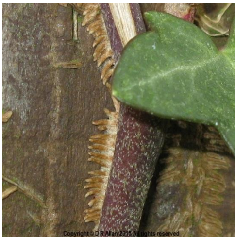
Slika 15. Stabljika Hedera helix L.

Stabljike bršljana su drvenaste, mogu narasti i do 30 metara dužine s deblom promjera do 20 cm. Svojim mnogobrojnim sitnim korijenjem pričvršćuje se za drveće i objekte po kojima se penje. Mladi izdanci su zvjezdasto dlakavi, kasnije ogole (Slika 15.).