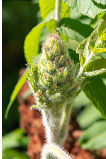
Slika 27. Cvat Rhus typhina