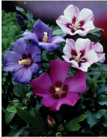
Slika 7. Cvijet Hibiscus syriacus

središtem. Cvatu od lipnja do listopada. Cvjetovi su kratkog vijeka, traju svega jedan dan no kontinuirano se iz brojnih pupove stvaraju novi cvjetovi(Slika 7.) ( http://www.plantea.com.hr/vrtni-hibiskus/ ).