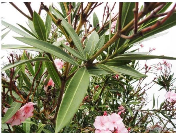
Slika 21. Stabljika i listovi Nerium oleander L.

Zimzelena grm koji naraste do 6 m visine tvoreći uspravne, dugačke i tanke, glatke grane. Listovi su izduženi, kožasti, s izraženom središnjom žilom a smješteni su nasuprotno ili su po troje skupljeni u pršljenu (Slika 21.).