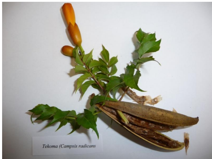
Slika 1. Cvijet, listovi i plod Campsis radicans

Plod je dug na krajevima sužen tobolac segmentiran na dva dijela veličine 10-20 cm unutar kojeg se nalazi mnogobrojno sjeme. Sjeme je spljošteno i smeđe boje s prozirnim 'krilima' s obje strane, veličine 1,5-2 cm (Godfrey, 1988.; McGregor i sur., 1986.) (Slika 1.).