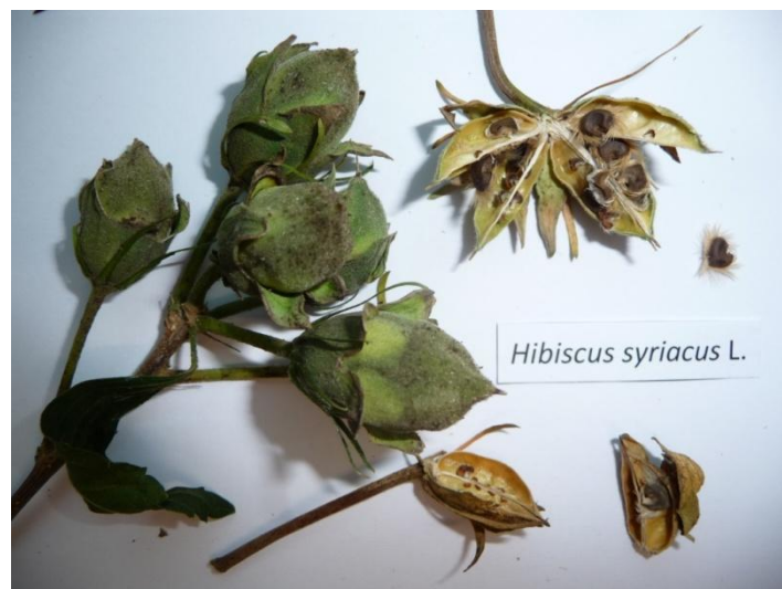
Slika 8. Plod Hibiscus syriacus

Plod je višesjemena čahura(Slika 8.) ( http://www.plantea.com.hr/vrtni-hibiskus/ ).