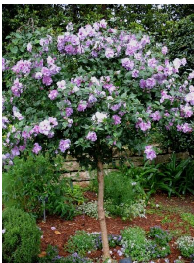
Slika 6. Hibiscus syriacus kao nisko stablo

Hibiscus syriacus je listopadni grm ili nisko stablo koji bilo da je normalnog ili niskog rasta uvijek izgleda elegantno (Slika 6.). Rod Hibiscus sadrži i do 150 vrsta, a još uvijek se stvaraju novi hibridi. Prema načinu uzgoja razlikujemo kultivirani i divlji oblik, te jednogodišnje i višegodišnje vrste. Cvijet hibiskusa traje samo jedan dan, a osušeni cvjetovi koriste se za čaj( http://www.koval.hr/blogeky/ljekovite%20biljke/hibiskus.html ). Dobra je medonosna biljka, pčelama daje nektar i cvjetni prah ( http://www.plantea.com.hr/vrtni-hibiskus/ ).