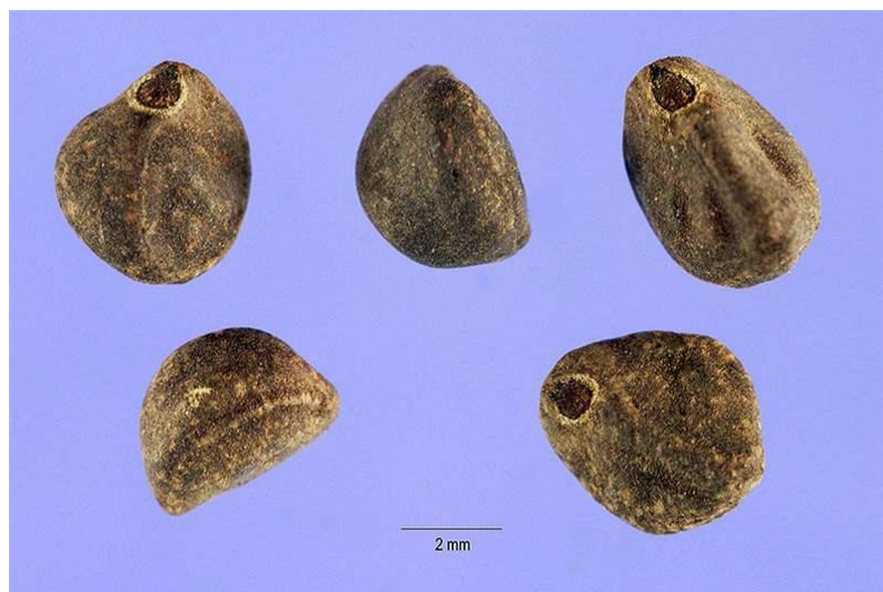
Slika 20. Plod Ipomoea purpurea

Plod je loptasta do jajolika kapsula promjera oko 1 cm i do 2,5 cm duga. Podijeljen je na 6 dijelova i sadži 3-6 sjemenki. Sjeme je u obliku klina, smeđe do crne boje s gusto prekrivenim malim smeđim dlačicama (Defelice, 2001.; Halvorson i sur., 2003.) (Slika 20.).