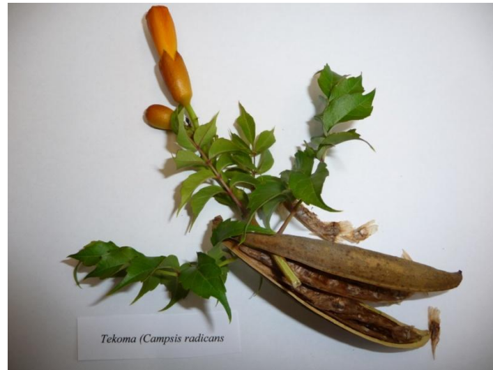
Slika 1. Cvijet, listovi i plod Campsis radicans

Plod je dug na krajevima sužen tobolac segmentiran na dva dijela veličine 10-20 cm unutar kojeg se nalazi mnogobrojno sjeme. Sjeme je spljošteno i smeđe boje s prozirnim 'krilima' s obje strane, veličine 1,5-2 cm (Godfrey, 1988.; McGregor i sur., 1986.) (Slika 1.).