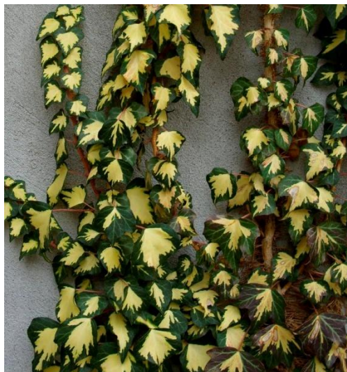
Slika 14. Hedera helix Goldheart na napuklim zidovima

Bršljan je višegodišnja drvenasta zimzelena biljka. Od mnogobrojnih kultivara napominjemo: “Arborescens” – grmastog rasta, nizak, listovi su eliptični i cjelovitih rubova “Argenteovariegata” – listovi imaju bijele mrlje ili su na rubovima bijeli “Aureovariegata” – listovi imaju zlatnožute mrlje “Conglomerata” – zanimljiv oblik patuljasta forme, u početku uspravan, kasnije puze, listovi su gusto smješteni u dva reda ( http://www.plantea.com.hr/brsljan/ ). Bršljan koji puže fasadom kod mnogih budi slike vlage i zidova koji se mrve, međutim znanstvenici tvrde da se ova biljka nepravedno krivi za uništavanje nekretnina. Znanstvenici su otkrili da biljka zapravo štiti zidove. Studija otkriva da mreža bršljanovih tamnozelenih listova predstavlja toplinsku zaštitu koja štiti od ekstrema u temperaturi i vlazi. Također štiti od oštećenja izazvanih sve većim zagađenjem zraka. Bršljan kao toplinski pokrivač zagrijava zidove za 15 posto na hladnom vremenu i hladi ih za 36 posto kad je vruće. Ipak, istina je da biljke loše djeluju na one zgrade koje su već oštećene jer bršljan lako nađe put u pukotine i rupe (Slika 14.) ( http://www.moj-hobi.com/Brsljan.htm ).