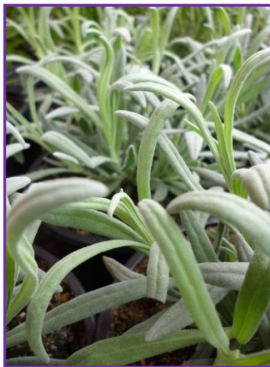
Slika 10. Listovi mlade biljke lavande

Uspravne stabljike lavande u donjem dijelu gusto su obrasle nasuprotno smještenim mirisnim listovima. Listovi su sjedeći, uski i 6-15 puta duži od svoje širine, rubovi su uvijeni prema donjoj strani (Schaffner, 1999.). Dugački su 2-5 cm, a široki 0,2-0,5 cm. Mladi listovi su zelene boje, dok su stariji sivo-zeleni (Slika 10.).