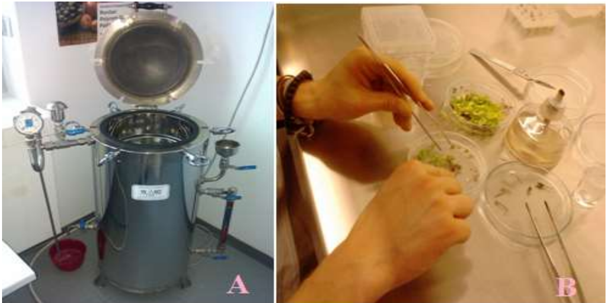
Slika 3: Parni sterilizator-autoklav (A) i prikaz ostale laboratorijske opreme korištene pri pripremi eksplantanta- pincete, petrijeve zdjelice, nož, plamenik (B)

Laboratoriji za kulturu tkiva sastoji se od tri osnovne komponente potrebne za rad. Radna površina na kojoj se vrše pripreme za početak rada kao što je pripravljanje podloge i sl., dio laboratorija u kojem se obavlja manipulacija biljnim materijalom u sterilnim uvjetima (laminar) te komora s kontroliranim uvjetima svjetla i temperature. Laboratorijska oprema korištena za provedbu pokusa: Erlenmeyerove tikvice, petrijeve zdjelice, pincete, hvataljka, nož, plamenik, stakleni štapić, laboratorijska vaga, autoklav. (Slika 3)