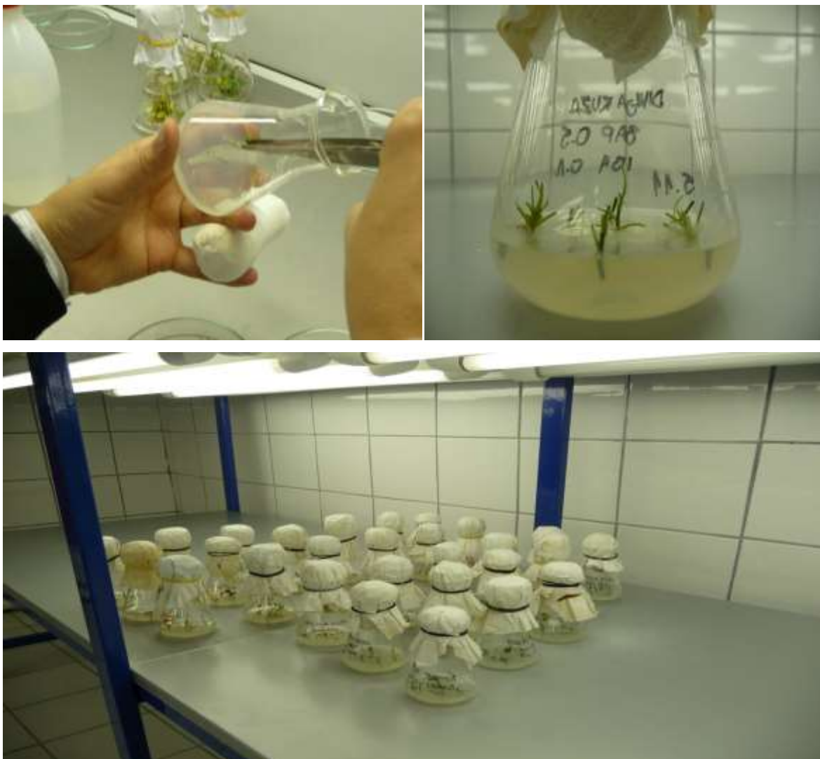
Slika 4: Eksplantanti divlje ruže presađeni na hranjivu podlogu

Eksplantanti divlje ruže uvedeni su u kulturu na dvije varijante hranjive podloge. (Slika 5) Pokus se sastojao od dvadeset tikvica raspoređenih u četiri ponavljanja jedne varijante hranjive podloge (BI) i dvadeset tikvica druge varijante hranjive podloge (B). Prva varijanta hranjive podloga sadržavala je hormon BAP (6-benzil aminopurin) u koncentraciji 0,5 mg/l te hormon IBA (Indol-butilna kiselina) u koncentraciji 0,1 mg/l, dok je druga varijanta podloge sadržavala samo hormon BAP u koncentraciji 0,5 mg/l. Tikvice su se nalazile u komori u kontroliranim uvjetima na temperaturi 20°C te pod umjetnim osvjetljenjem šesnaest sati osvijetljenosti („dan“) i osam sati tame („noć“).