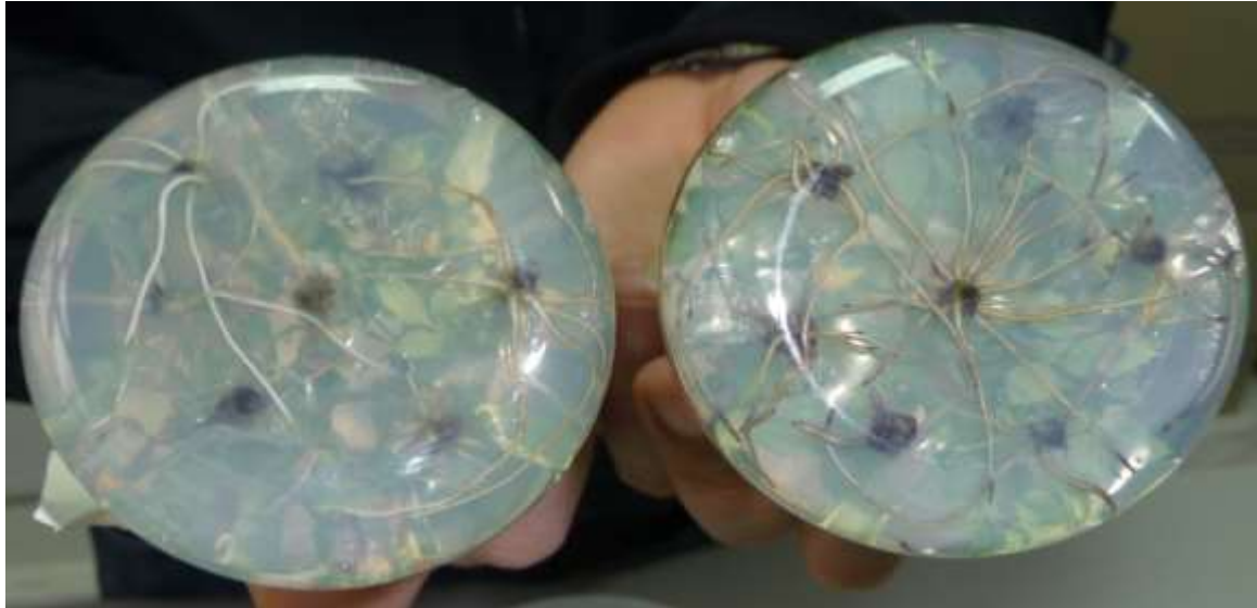
Slika 5: Ožiljene biljke

Tijekom uzgoja na hranjivoj podlozi biljke divlje ruže su razvijale korijen (Slika 6) i lisnu masu te su nakon mjesec dana bile spremne za presađivanje u supstrat. Prilikom presađivanja biljke su se uranjale u 0,3% otopinu fungicida na bazi kaptanakako bi se osigurala otpornost na oboljenja nakon presađivanja.