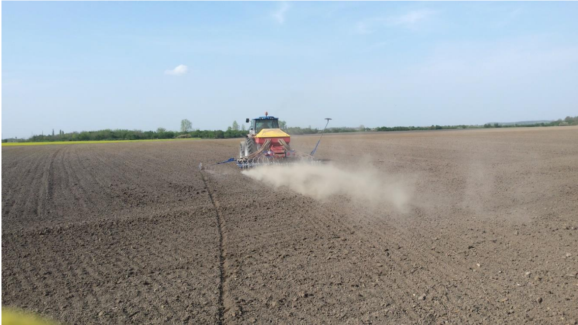
Slika 5. Sjetva soje

svojstvima, obrađenosti, i vlažnosti tla, klimatskim uvjetima i vremenu sjetve. Naša sjetva u navedene dvije proizvodne godine je od 3 do 6 cm ovisno o pripremljenosti tla i agroekološkim uvjetima. Sjetvu obavljamo sa pneumatskom žitnom sijačicom koja radi s podtlakom i omogućuje preciznu sjetvu.