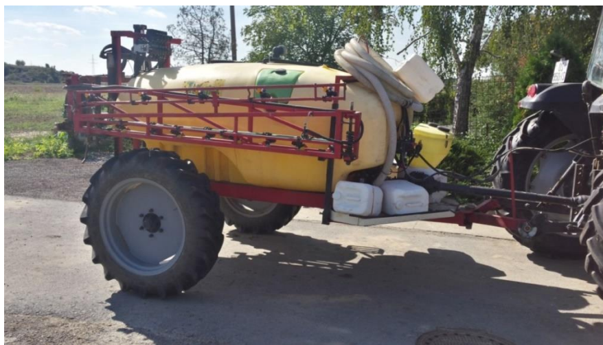
Slika 7. Prskalica za kemijsku zaštitu soje

U Garac P.O. u 2014. i 2015. godini nije korištena nikakva zaštita protiv bolesti jer smo to kvalitetno suzbili sa upotrebom sorti koji su otporne na bolesti i pravilnim plodoredom. Zaštitu protiv štetnika 2014. godine smo imali za crvenog pauka koji se pojavio u srpnju kada je duži period visokih temperatura. Tretirali smo ga sa Demitanom u dozi 0,5 l/ha.