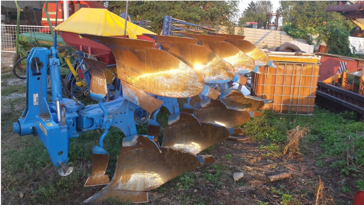
Slika 1. Plug premetnjak

radni položaj. Na taj način brazde se uvijek slažu u jednu stranu, pa nema razora ili naora čime se osigurava dovoljno čvrsti plitki sjetveni sloj, sastavljen od usitnjenih čestica bez gruda u kojem se klijanje i nicanje brzo odvija. Važno je da pri oranju svaka brazda bude jednaka, maksimalno usitnjena i prevrnuta, a žetveni ostaci i korovne biljke zatrpane. ( http://www.savjetodavna.hr/savjeti/19/517/strojevi-i-oruda-za-osnovnu-obradu-tla/ ).