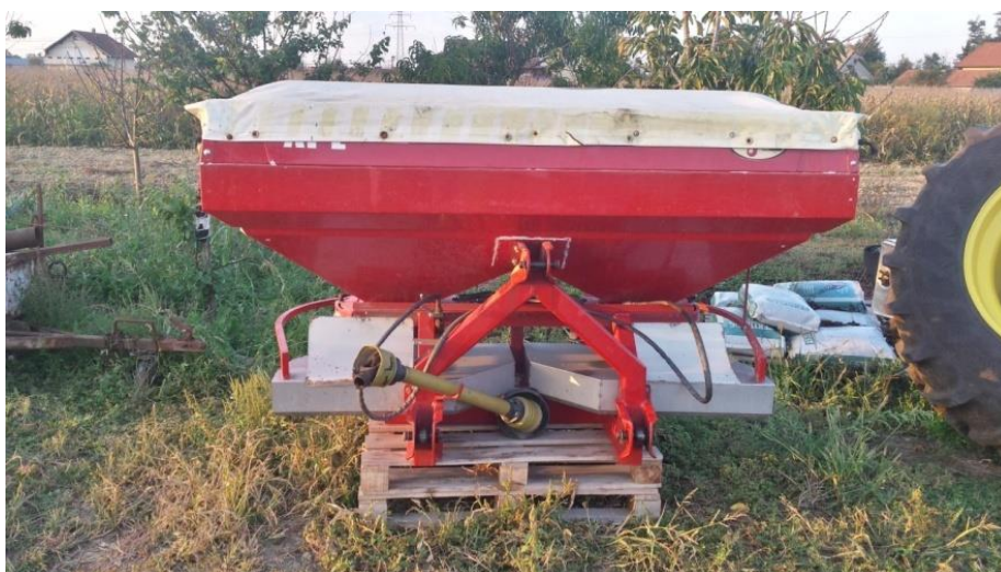
Slika 6. Rasipač gnojiva

U 2015. godini smo primijenili NPK gnojiva pred oranje bez dušika sa formulacijom (0:20:30) u količini 250 kg/ha i UREA (46% N) u količini 80 kg/ha. U proljeće smo poslije zatvaranja brazde primijenili NPK sa formulacijom (15:15:15) u 200 kg/ha, a prihranu ni u ovoj godini nije bilo potrebno primijeniti.