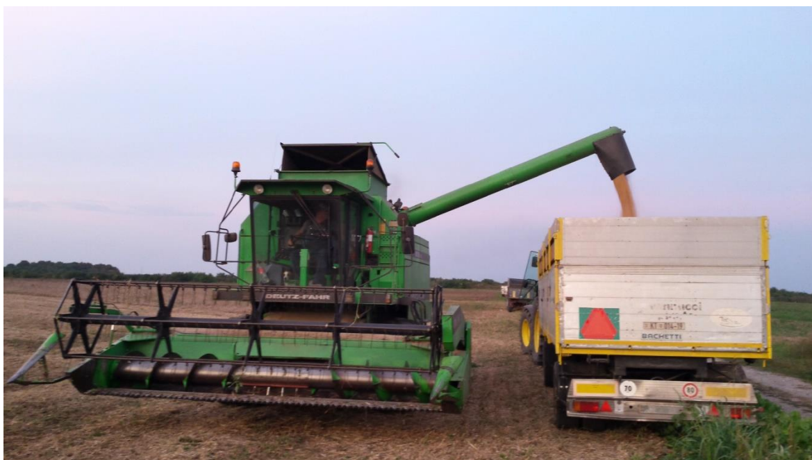
Slika 8. Žetva soje

U 2015. godini sa ukupnom površinom od 70 ha posijane soje, žetva je trajala od 15. rujna do 21. rujna sa prosječnim prinosom od 3,10 t/ha. Sorta Ika je dala 2,9 t/ha, sorta Tena 3,4 t/ha, a sorta Lucija 3,0 t/ha. Žetvu su obavljala dva kombajna sa žitnim hederima marke Deutz-Fahr sa prosječnom brzinom od 5 km/h.