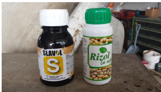
Slika 3. Poboljšivači za inokulaciju sjemena

Za uspjeh bakterizacije važno je da što veći broj bakterija preživi na inokuliranom sjemenu dok sjeme ne pusti korjenčić na koji će se one naseliti. O bakterizaciji ovisi puno faktora kao što su: sam postupak izvođenja bakterizacije i sjetve, pH tla, opskrba tla hranivima, agrotehnika, biološka svojstva sorte, problem nematoda, primjena pesticida, gnojidba mikro i makroelementima. Biljke soje na kojima su dobro razvijene kvržice sposobne su za dobro razvijanje listova zelene do tamnozelene boje.