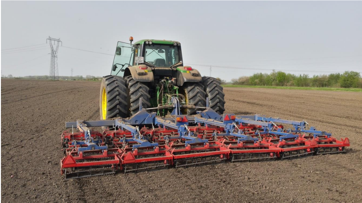
Slika 2. Predsjetvena priprema tla teškom drljačom