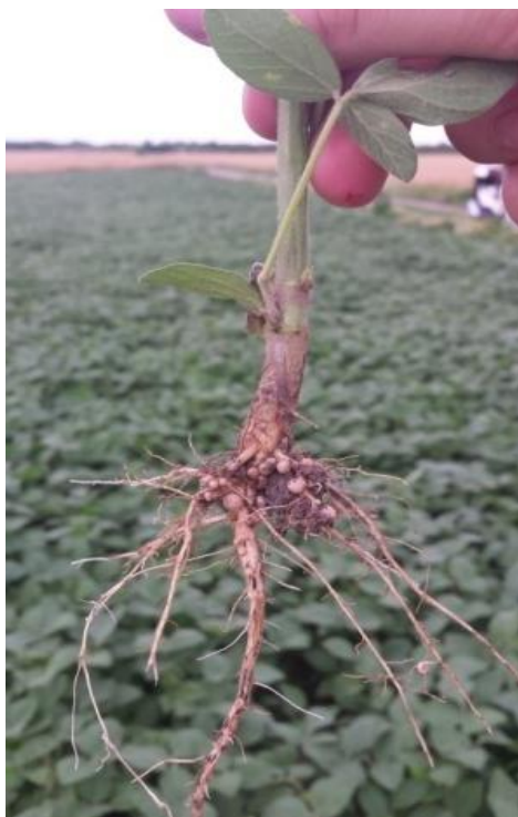
Slika 4. Bakterizacija u korijenu soje