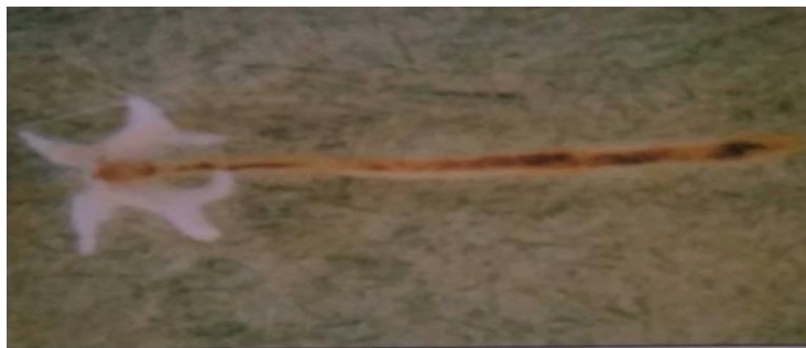
Slika 11. Lerna cyprinaea - ženka