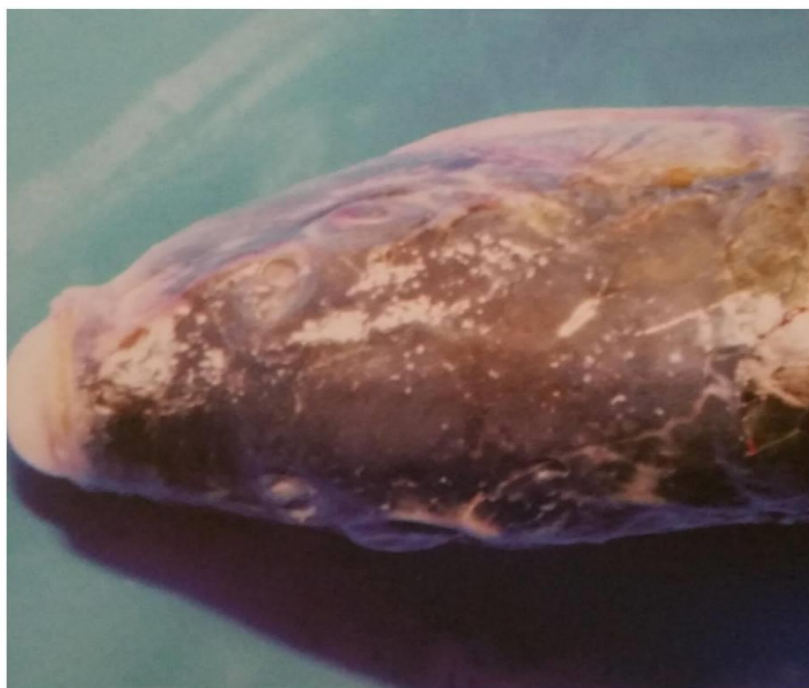
Slika 6. Bijele ciste na glavi šarana

Prijelazna bolest koju uzrokuje parazit Ichthyophthirus multifiliis , koji se smješta pod epitelom kože, škrga i rožnice te u daljenem stadiju razvoja formira cistu. Parazit se u ribi umnožava diobom, a kada dosegne stadij tomita prelazi u vodu. Ukoliko unutar 2-3 dana tomit ne pronađe domaćina, ugiba. Trepetljikaš se najbolje razvija pri temperaturama od 16 – 22 °C. Bolest se najviše pojavljuje u ribnjacima, naročito ribnjacima sa mlađem. Ponašanje oboljelih riba su te da su nemirne naravi, češu se o predmete u vodi i drže se u skupinama, koža i škrge pojačano luče sluz. Za sprječavanje bolesti, posebno su važni onemogućavanje ulaženja divlje ribe u objekte za mlađ, dezinfekcija dna, odvajanje matica od ikre, odvojeni uzgoj mlađa, te izbjegavanje gustog smještaja i slabljenja kondicije (Bojčić i sur., 1982).