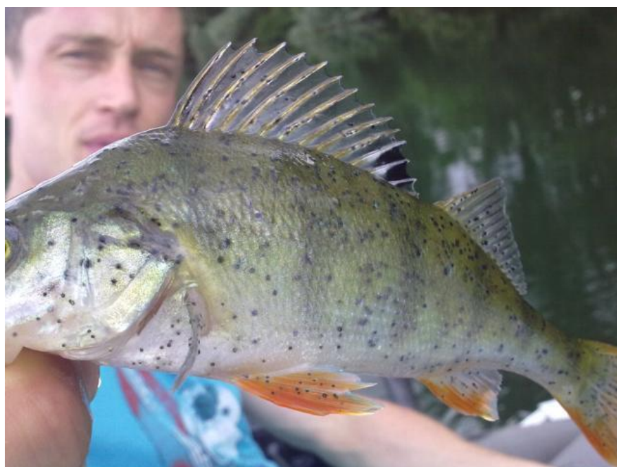
Slika 8. Postodiplostomoza u grgeča

Ličinački stadiji nisu štetni po ljudsko zdravlje, ali meso oboljelih riba se ne upotrebljava za prehranu. Oboljele ribe se ne mogu liječiti, jer su ličinke smještene u samoj očnoj leći. Suzbijanje je moguće jedino u objektima za uzgoj riba, a ono se sastoji na prekidanju biološkog ciklusa parazita. Kao profilaksu treba smanjiti broj vodenih ptica i uništavati puževe te provoditi osnovne sanitarne mjere (Jeremić, 2006).