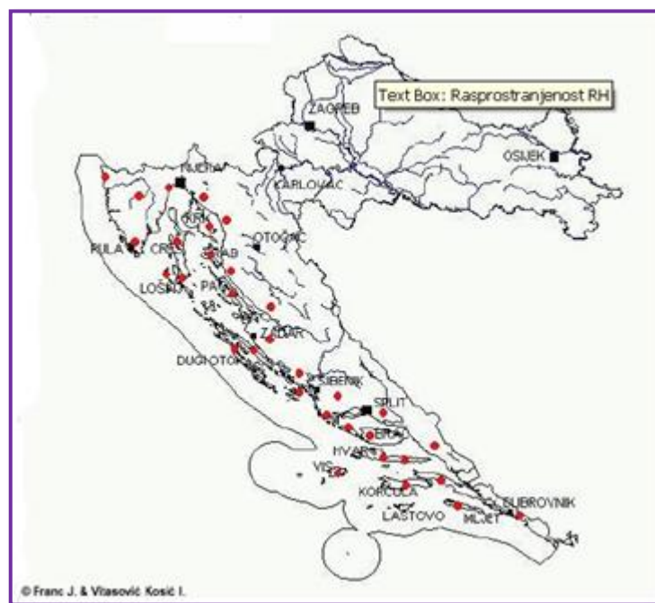
Slika 14. Rasprostranjenost lavande u Hrvatskoj

Na većim površinama proizvodi se još od 19. stoljeća, a proširila se sve do istoka Rusije (Stepanović, 2009). Ona je kultura mnogo šireg područja tako je u Europi udomaćena u velikom broju zemalja: od Engleske i Francuske do Mađarske i Bugarske. Izvan Europe uzgaja se i u Alžiru, Argentini, SAD-u i Tasmaniji (Tadić, 2009.).