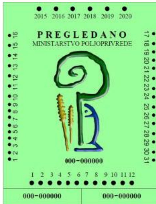
Slika 7. Znak o obavljenom pregledu prskalica i raspršivača