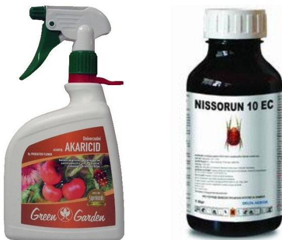
Slika 1. Akaricidi u poljoprivrednim ljekarnama

Akaricidi (Slika 1.) su kemijska sredstva koja svojim djelovanjem suzbijaju grinje. U njihovoj podjeli nailazimo na insekticide i fungicide koji svojim djelovanjem utječu na sve stadije grinja dok selektivni akaricidi prvenstveno djeluju na pokretne stadije grinja (Tablica 2.). U nekim slučajevima selektivni akaricidi mogu djelovati i na odrasle grinje (Raspudić i sur., 2014.).