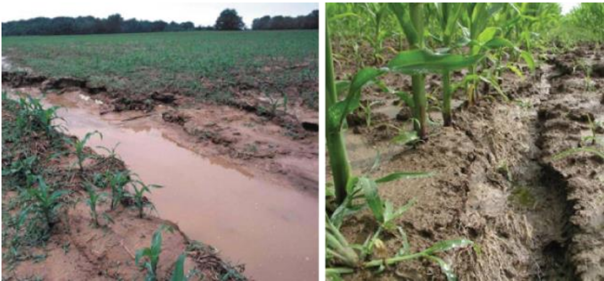
Slika 6. Erozijski vodeni tokovi u polju