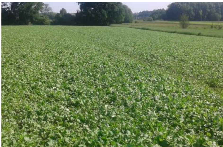
Slika 11. Rauola u borbi protiv korova