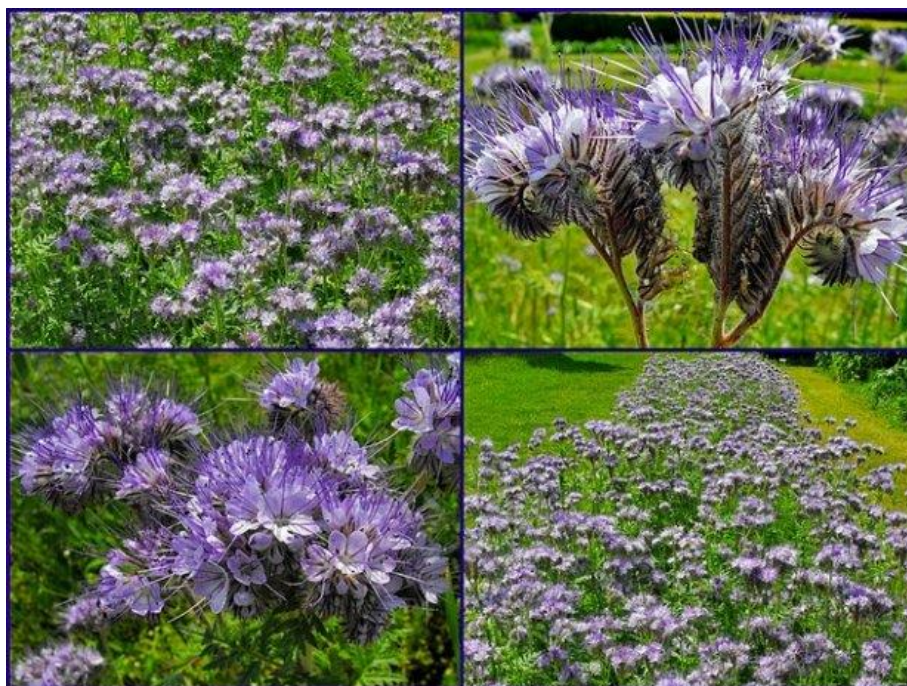
Slika 9. Facelija