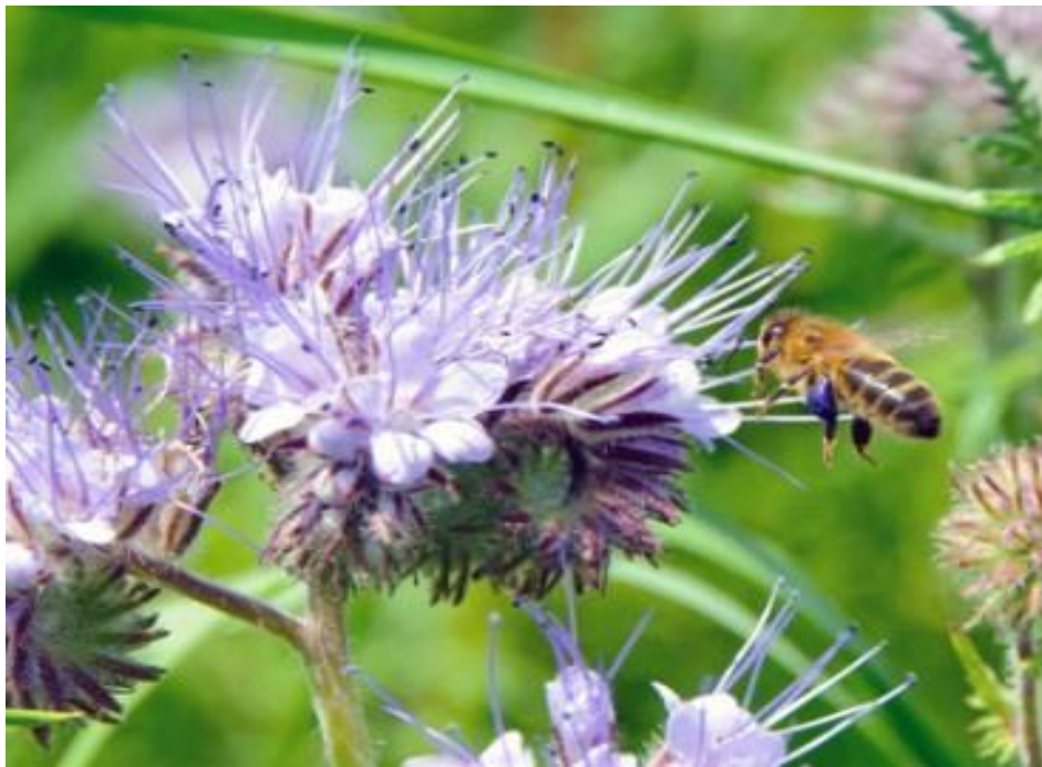
Slika 10. Pčelinja paša na faceliji

Pokrovni usjevi povoljno djeluju na korisne kukce te na njihovu aktivnost i na susjedne površine. Također privlačenje pčela i bumbara pokrovnim usjevima može povećati medonosnost poljoprivrednih površina, osigurati oprašivačima polen i nektar pokrovnih usjeva do trenutka kada glavna medna paša još nije dostupna (Slika 10.).