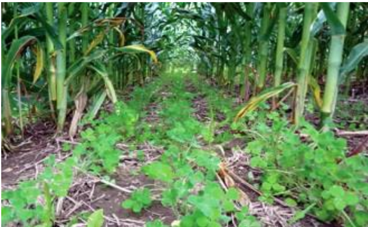
Slika 5. Međuusjev djeteline u polju kukuruza ( Izvor: :

Živi malč može biti grahorica u kukuruza (Slika 5.), djetelina u “no-till” povrću, različite trave ili leguminoze u voćnjacima i vinogradima.