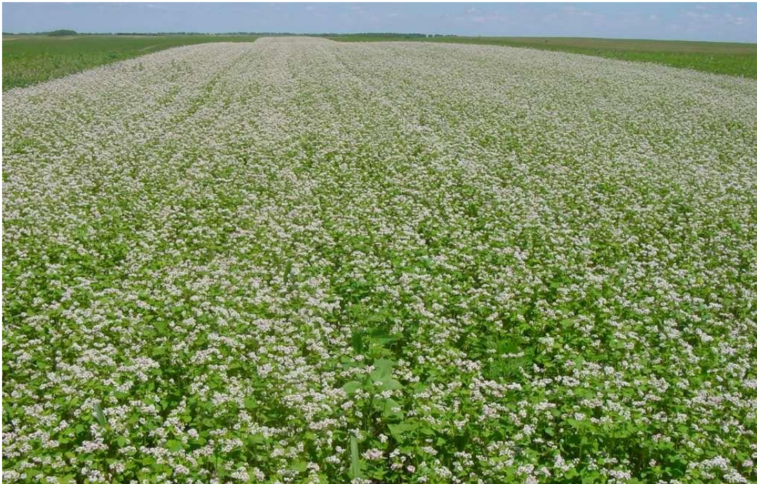
Slika 3. Polje heljde

Pokrovni usjevi uzgajani ljeti uglavnom imaju namjenu siderata i koriste se u cilju popunjavanja plodoreda uz obogaćivanje tla hranivima, posebice na slabo plodnim tlima, ili kao priprema zemljišta za višegodišnji usjev ili zasnivanje trajnog nasada. Koriste se različite leguminoze, ali i druge biljne vrste kao što su proso, krmni sirak, sudanska trava (Slika 4.), rauola, heljda (Slika 3.) i dr., koje će pomoći u poboljšanju fizikalno-kemijskih svojstava tla i “gušenju” korova.