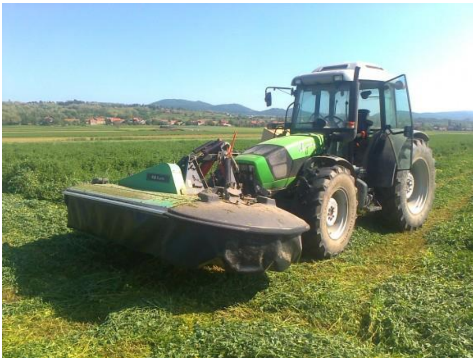
Slika 13. Košnja lucerne

U sustavima uzgoja usjeva gdje se biomasa želi iskoristiti kao malč na površini tla, pokrovni usjev može biti terminiran kemijskim ili mehaničkim načinom (Slika 13.). Odluku o načinu terminacije također formira i način uzgoja kao što imamo npr. u ekološkoj poljoprivredi gdje je jedino dozvoljeno mehaničko terminiranje usjeva. U praksi uspješnija je terminacija pokrovnog usjeva ukoliko je isti već ušao u generativnu fazu razvoja pa je retro-vegetacija time manji problem. U nekim slučajevima terminacija pokrovnih usjeva moguća je i ispašom što može dodatno doprinijeti održivosti uzgoja životinja i boljem životu istih.