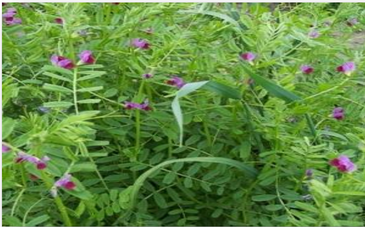
Slika 1. Grahorica

Siju se u kasno ljeto ili u jesen u svrhu pokrivanja tla, a sijati se mogu u postojeći glavni usjev u fazi dozrijevanja ili neposredno nakon žetve ili berbe glavnog usjeva. Od zimskih pokrovnih usjeva često se koriste različite leguminoze kao što su razne djeteline, grahorice i dr. (Slika 1.), ali to može biti i raž (Slika 2.) pa čak i mješavina, raži, ječma i pšenice ili neka druga žitarica koja dobro podnosi zimske uvjete uzgoja (Sullivan, 2003.).