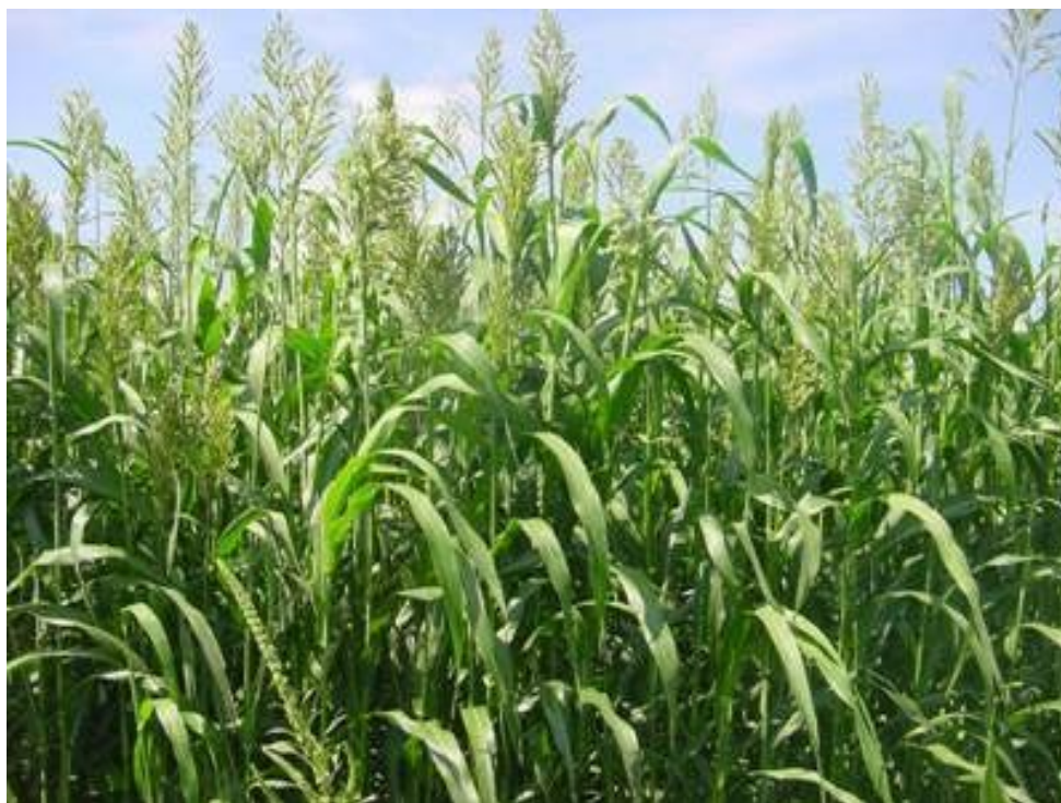
Slika 4. Sudanska trava