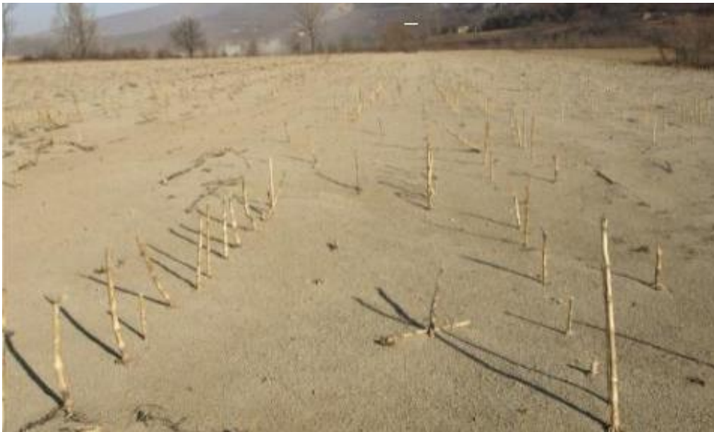
Slika 7. Erozija tla vjetrom