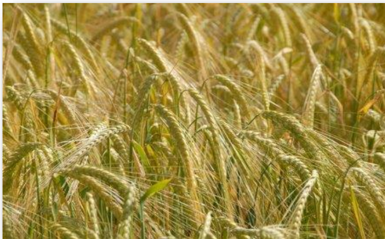
Slika 2. Raž