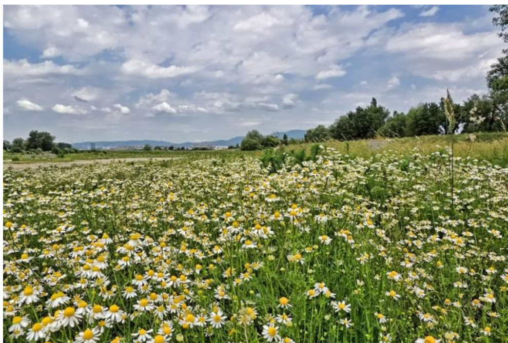
Slika 12. Kamilica