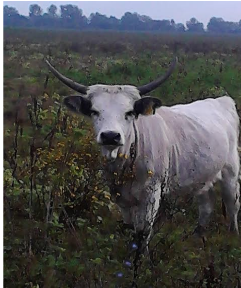
Slika 4: Krava s rogovima u obliku vila

Rogovi su glavna značajka ove pasmine, izrazite su duljine, često koso položeni s vrhovima koji strše na stranu, te velikim rasponom između vrhova, imaju oblik lire. Drugi tip rogova su rogovi postavljeni više okomito, a vrhovi povinuti unatrag pa takvi rogovi imaju oblik vila. Jedna trećina do dvije trećine rogova su tamno pigmentirani.