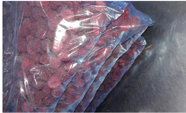
Slika 11. Zamrznuta malina