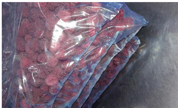
Slika 11. Zamrznuta malina