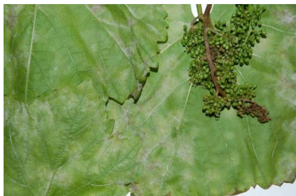
Slika 8: Sivkasta prevlaka na listu uzrokovana Botrytis cinereom

njima se pojavljuje paučinasta prevlaka. To je siva prevlaka koja se sastoji od konidija i sporonosnih organa gljivice. Ako je vrijeme vlažno i pro hladno bolest se brzo širi s jedne da drugu bobicu i zahvati veći dio grozda (Ciglar, 1998.).