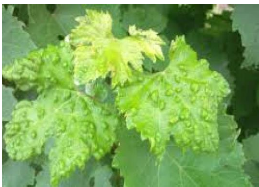
Slika 11: Erinoze na gornjoj strani lista

Lozine grinje šiškarice mogu imati sedam generacija godišnje. Eriophyes vitis je štetnik koji je opasan u hladno proljeće, tada vegetacija napreduje sporije, a kada je vrijeme toplo tada loza brzo raste i grinja obično nije štetna (Ciglar, 1998.).