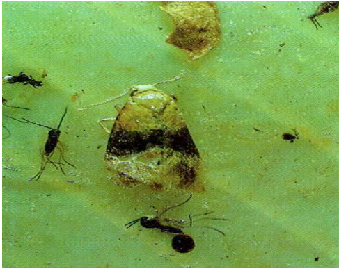
Slika 13: Žuti grozdov moljac