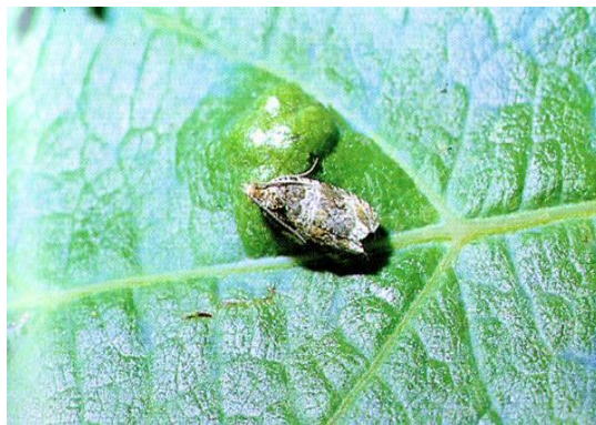
Slika 16: Leptir pepeljastog grozdovog moljca groždanih moljaca