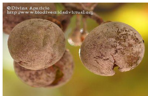
Slika 2: Pepelnica na bobama