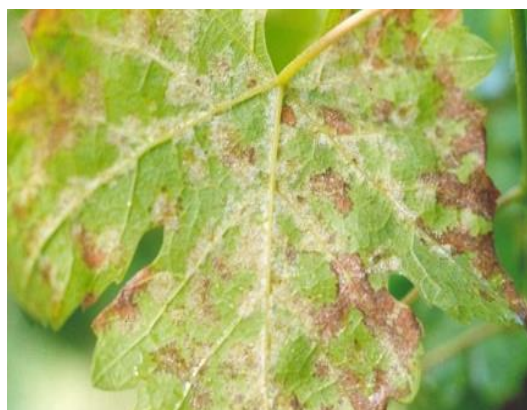
Slika 4: Simptomi plamenjače na starom lišću