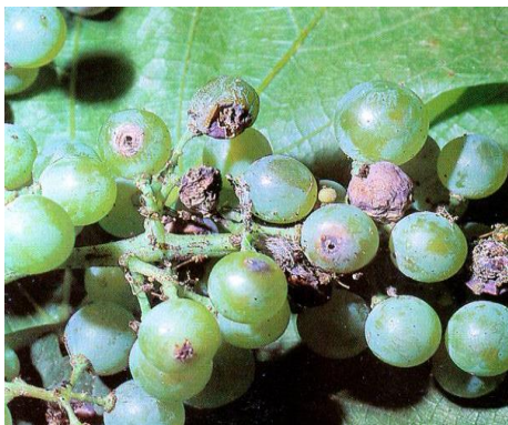
Slika 15: Grozd uništen od gusjenice

Duljina tijela leptira pepeljastog moljca je od 5 do 6 mm, raspon krila 11 do 12 mm. Tamnosive boje su prednja krila sa izraženim šarama. Stražnja su prema rubu tamnija a prema sredini svjetlija i bez šara. Gusjenica naraste i do 10 mm. Sivi ili pepeljasti grozdov moljac javlja se u sušnijim, toplijim godinama. U našim uvjetima može imati i tri generacije a leti u sumrak ili u ranim jutarnjim satima (Maceljki i sur., 2006.).