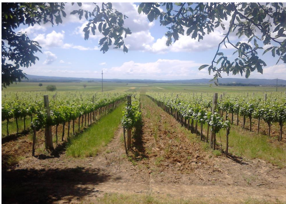
Slika 17: Vinograd OPG Marinclin u Vetovu

U klimatskom pogledu za Kutjevačko vinogorje karakteristične su srednje vrijednosti kontinentalne humidne, odnosno semihumidne klime. Klima sa svim značajnim karakteristikama (toplina, sunčevo svjetlo, oborine, vjetar), te idealnim tлом, fizikalno-kemijskim i biološkim svojstvima, blago nagnuti južni položaji pogoduju proizvodnji visokokvalitetnih vina.