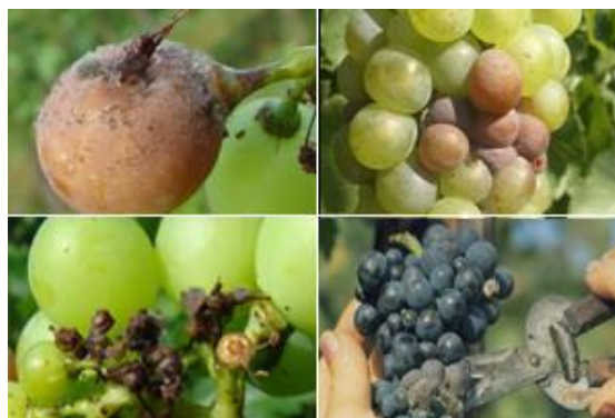
Slika 9: Siva plijesan na grozdu