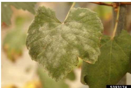
Slika 1: List prekriven bjelkastom prevlakom

mora biti. To je bolest koja se vrlo brzo širi i za 3-6 dana može se proširiti vinogradom (Kišpatić i Maceljki, 1991.).