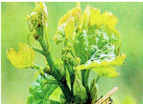
Slika 10: Lozina grinja uzročnik akarinoze

Čim krene vegetacija u proljeće nastaju štete. Veliki broj grinja na relativnoj maloj površini otvorenog pupa ili istjerale mladice potpuno deformira rast mladice. Već kasnije u vrijeme brzog rasta listova grinja ne uspije napraviti veće štete.