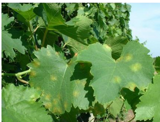
Slika 3: Simptomi plamenjače na mladom lišću

ako je zahvaćeni dio plojke dolazi do sušenja i otpadanja lista. Krajem srpnja može doći do defolijacije. Zaraženi listovi su izvor zaraze.