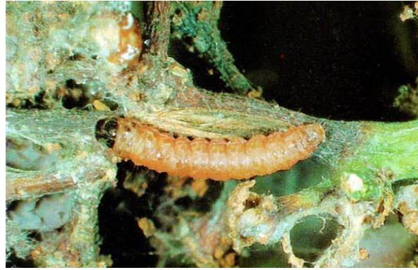
Slika 14: Gusjenica žutog grozdovog moljca