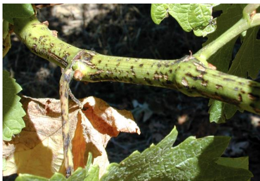
Slika 5: Crna pjegavost na zelenim mladicama

rozgve, a moguće je da bude zahvaćena i cijela rozgva. Tu promjenu boje rozgve uzrokuje micelij gljive koji se razvija ispod kore. Na površini izbjeljenje kore u proljeće se formiraju crne točkice – piknide. Piknidi su lako vidljivi golim okom ( www.vinogradarstvo.com , 2016.).