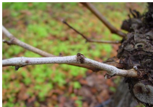
Slika 6: Srebrnkasta kora rozgve