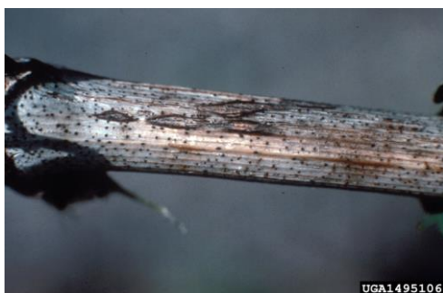
Slika 7: Izbjeljena kora s vidljivim točkicama piknidima