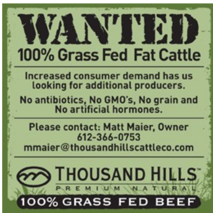
Slika 5. Oglas za govedinu proizvedenu na ispaši.

35% višu cijenu za mlijeko i meso s ispaše u odnosu na iste proizvode stajski držanih i TMR-om hranjenih životinja.