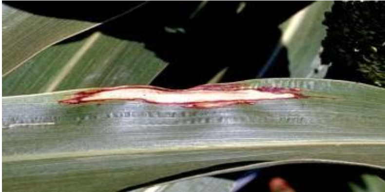
Slika 1: Helminthosporium turcicum (Pass.)