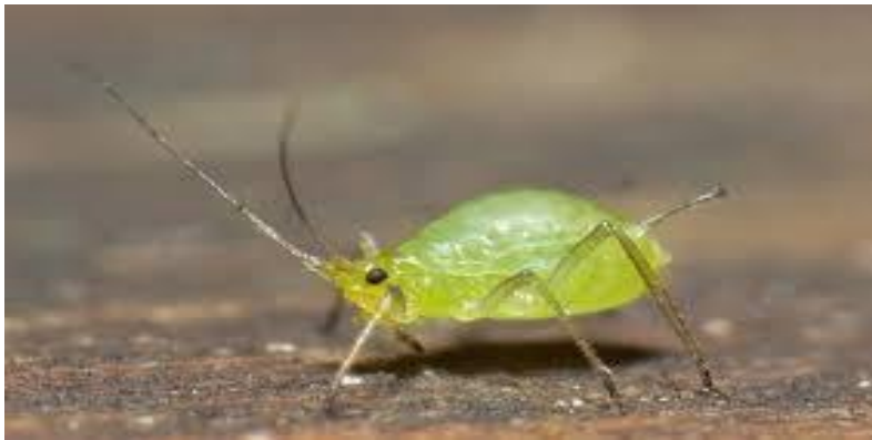
Slika 5: Lisna uš

Lisne uši napadaju sve površinske dijelove biljke sirka, prilikom čega na metlicama i listovima nastaju deformacije. Isto tako, lisne uši prenose virusna oboljenja, što ih čini izuzetno opasnim štetnicima (KWS, 2012.).