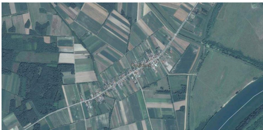
Slika 5: Mjesto Poljanci

Istraživanje uzgoja sirka provedeno je na području Brodsko - posavske županije u mjestu Poljanci, s ritskom crnicom, reprezentivnim tipom tla za sjeveroistočnu Hrvatsku. Korišteno je 10 hibrida sirka: Leonie (KSH2F12), Tarzan, Sole (9901) - sudanka x sirak, Zerberus, KSH3723, Santos, Merlin, Lemnos ( S. bicolor ), KSH3724 ( S. bicolor ) i Sammos sudanka x sirak.