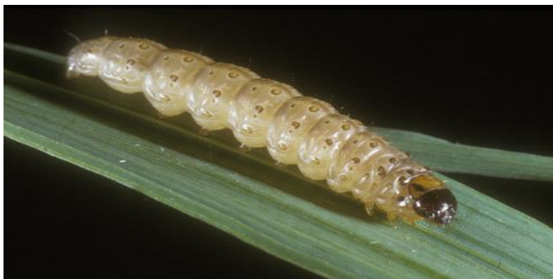
Slika 3: Kukuruzni plamenac

Kukuruzni plamenac je štetnik koji napada i sirak. No u usporedbi sa kukuruzom štete su znatno manje. Ovaj štetnik za odlaganje jajašaca rado bira razvijene, jake biljke pa mu sirak zbog svog slabijeg razvoja mladih biljaka nije primarni cilj. Zato je težište odlaganja jajašaca u usjevu kukuruza, čije sumlade biljke dobro razvijene (KWS, 2012.).