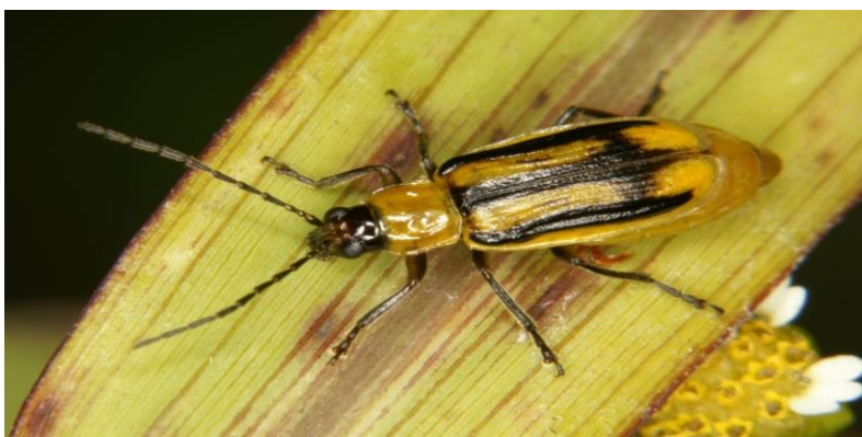
Slika 2: Kukuruzna zlatica

Ličinke kukuruzne zlatice ne mogu se razviti u usjevu sirka. Za ove štetnike je kukuruz puno bolji domaćin. Iz tog razloga sirak je pogodan kao rasterećenje za plodorede u kojima dominira kukuruz, koji može biti zahvaćen kukuruznom zlaticom (KWS, 2012.).