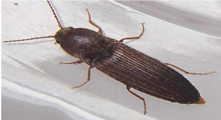
Slika 4: Žičnjak