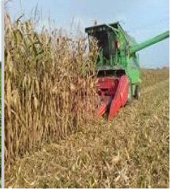
Slika 9. Žetva kukuruza na PG „Mario Lučić“

Na PG „MARIO LUČIĆ“ osim sjetvom merkaltilnog kukuruza za potrebe pri tovu svinja također se bavimo i sjetvom pokusnih hibrida za tvrtku PIONEER. Zastupljeni hibridi i ostvareni prinosi vidljivi su u Tablici 7.