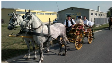
Slika 11. Vožnja fijakerom

Posebno iskustvo je sjediti u fijakeru, slušati topot konja i voziti se kroz šumu, polja ili selo. Kako se živjelo nekoć tajanstvena je i gotovo zaboravljena stvar u mnogim dijelovima svijeta, no u ovom našem kutku i nije neka prevelika tajna. Vožnja fijakerom daje poseban ugođaj i opušta. Vraća u vremena kad su konji bili od velikog značaja po pitanju prijevoza i radne snage.