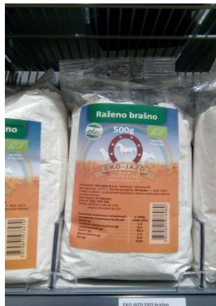
Slika 7. Gotov proizvod, raženo brašno