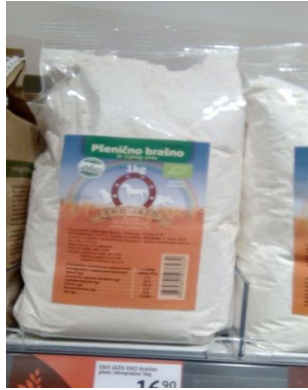
Slika 3. Gotov proizvod, pšenično brašno