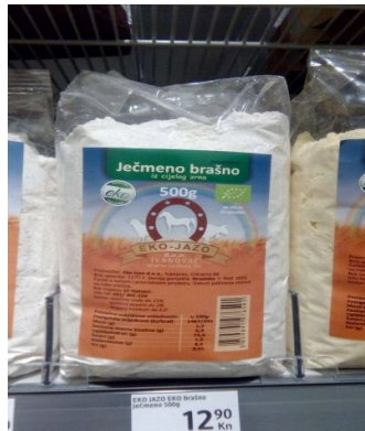
Slika 5. Gotov proizvod, ječmeno brašno