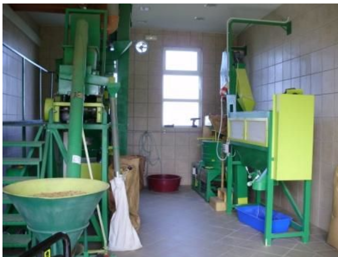
Slika 8. Prva faza prerade žitarica

U svom vlasništvu Ivan Jazbec ima i pakiraonicu, u kojoj svakodnevno radi 4 radnika uz vlasnika i suprugu, kako bi zadovoljili potrebe tržišta za ekološkim proizvodima koje je sve veće. Njihova ambalaža danas je prepoznatljiva.