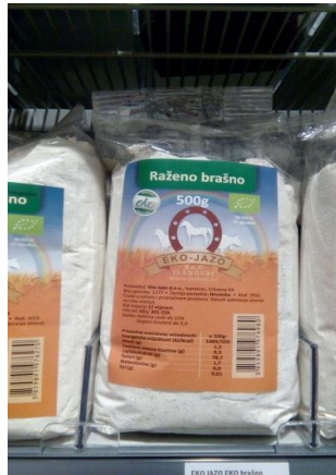
Slika 7. Gotov proizvod, raženo brašno