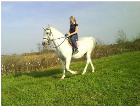
Slika 10. Rekreacijsko jahanje