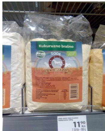
Slika 2. Gotov proizvod, kukuruzno brašno