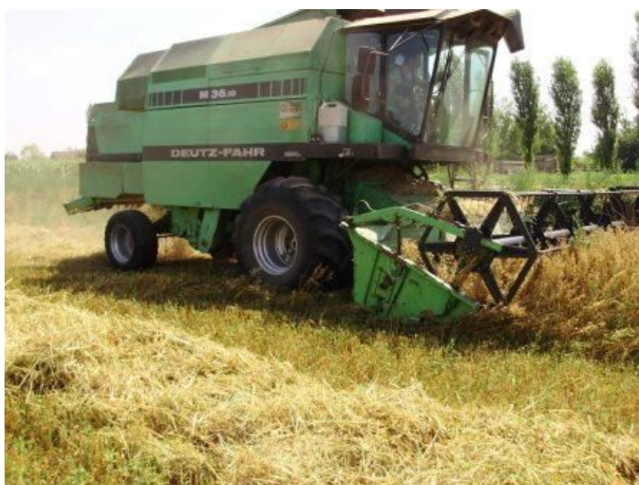
Slika 1. Vršenje pir pšenice

Unazad nekoliko godina donijeli su odluku o sužavanju obujma eko proizvodnje na proizvodnju žitarica i soje, te izgradili pogon za skladištenje, preradu i doradu žitarica. U vlastitom pogonu od žitarica proizvode pahuljice, integralno brašno, te ekspanzirane i dražirane žitarice.