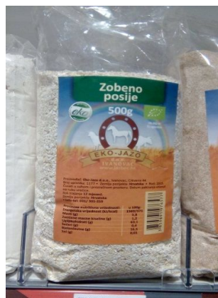
Slika 6. Gotov proizvod, zoben posje