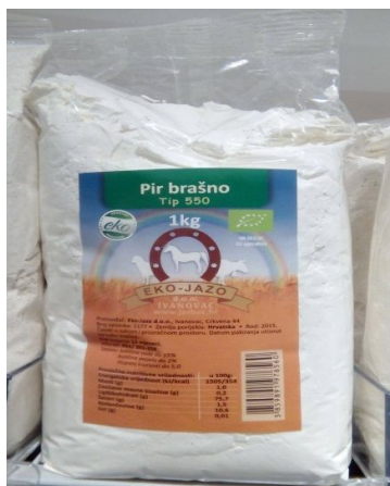
Slika 4. Gotov proizvod, pir brašno