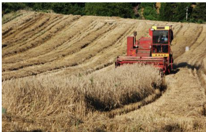
Slika . Žetva pšenice