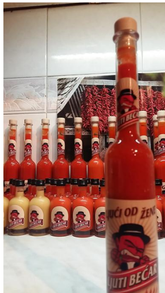
Slika 9. Vlastiti proizvod – umak "Ljući od žene"