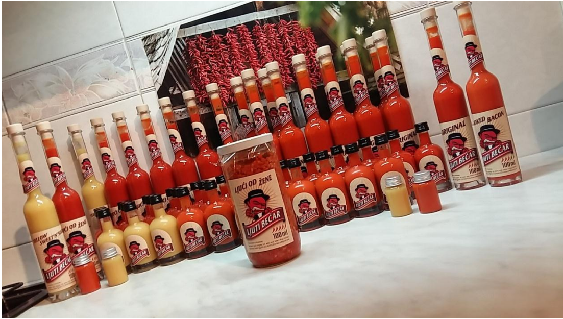
Slika 8. Vlastiti proizvodi, umaci i ajvar