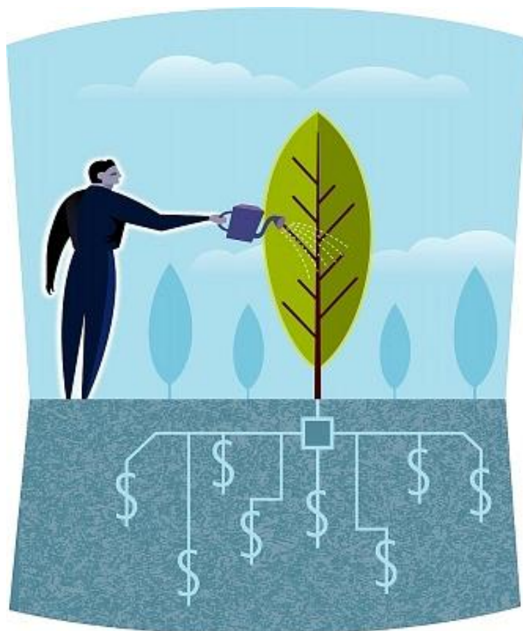
Slika 1. Proizvodnja hrane i porast prihoda ( http://proizvodnjahrane.com )

Stoga ne čudi što se javlja sve više pitanja i dvojbi vezanih uz utjecaj hrane na zdravlje čovjeka, sve je više pobornika zdrave prehrane, "zelenih" i slično. Sve veći dio znanstvenika postaje svjestan nužnosti kvalitativne promjene odnosa čovjeka prema prirodi, načinu proizvodnje hrane te njene raspodjele i potrošnje.