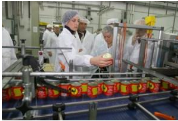
Slika 2. Proizvodna industrija, Podravka ( http://www.proizvodnaindustrija.com )

Prehrambena industrija spada u laku industriju, odnosno spada u industrije koje svoju proizvodnju temelje na sredstvima za potrošnju. Predmet prehrambene industrije je prerada biljnih, životinjskih i mineralnih sirovina radi zadovoljavanja prehrambenih potreba ljudi. Ova industrija je u izravnoj vezi s ratarstvom i stočarstvom, od koje dobiva osnovne sirovine, zatim ih prerađuje, te im poboljšava kvalitetu i produljuje vrijeme trajanja. Ovim činom, prehrambena industrija potiče kvalitetniju i ravnomjerniju ishranu stanovništva tijekom čitave godine, a ujedno potiče i poljoprivrednu proizvodnju. 3