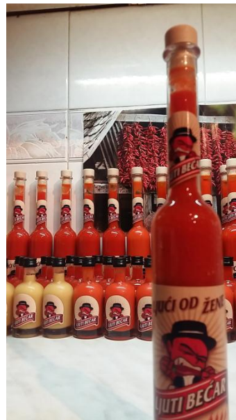
Slika 9. Vlastiti proizvod – umak "Ljući od žene"