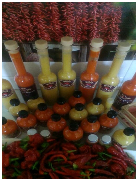
Slika 7. Vlastiti proizvodi – umaci i svježi plodovi

Ova vrsta proizvodnje nije iznimno zahtjevna, međutim da bi se od nje ostvarila dobit i plasirali proizvodi na tržište, obzirom da na našem području već ima nekoliko proizvođača koji se bave istom ili vrlo sličnom proizvodnjom, jako je važno napraviti kvalitetne umake, ambalažu koja im pristaje, i naljepnice koje će se kupcima/potrošačima svidjeti, kako bi se vratili nama i kupovali iznova. Naše ideje realizirali smo, imamo još dosta angažiranja oko svega ovoga, trebali bismo izraditi određeni promocijski materijal, kao npr. letke ili brošure, koje ćemo dijeliti kao besplatno promoviranje vlastitih proizvoda. Planiramo također početi posjećivati sajmove na kojima ćemo dijeliti testere svojih proizvoda, s ciljem probuđivanja svijesti kupaca kako je baš naš proizvod ono što im treba.