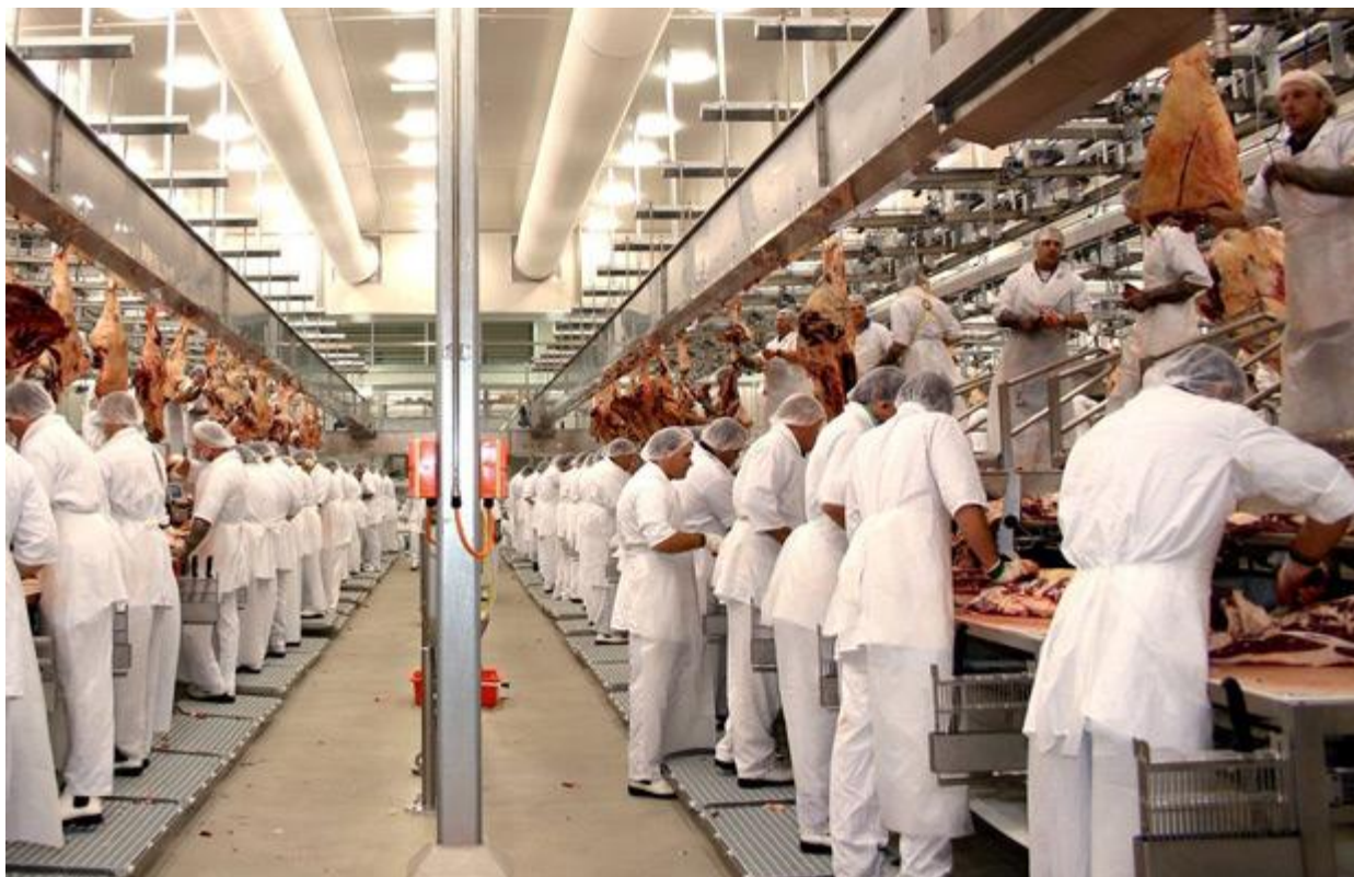
Slika 3. Mesna industrija