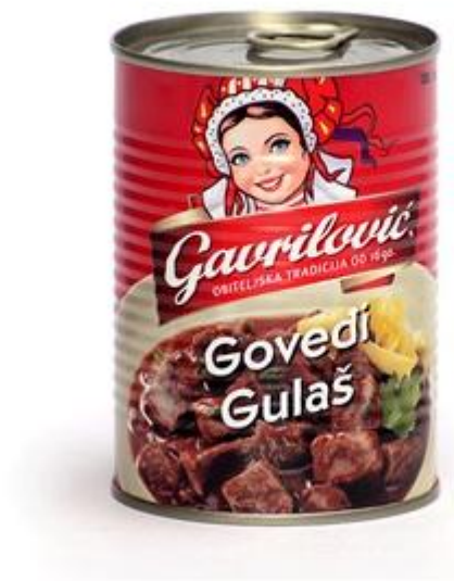
Slika 5. Gavrilović konzervirana hrana

U Hrvatskoj djeluje velik broj tvrtki koje su poznate i na svjetskom tržištu, a prvenstveno se bave proizvodnjom mesnih i mliječnih prerađevina, ali i ostalih proizvoda. Gavrilović d.o.o. je hrvatska tvrtka koja se bavi proizvodnjom mesa i mesnih proizvoda. Dugogodišnje povjerenje kupaca i uspjeh na svjetskom tržištu, stečeno je zbog vrhunske kvalitete, i odličnih promocijskih aktivnosti koje je ova tvrtka ponudila. 4