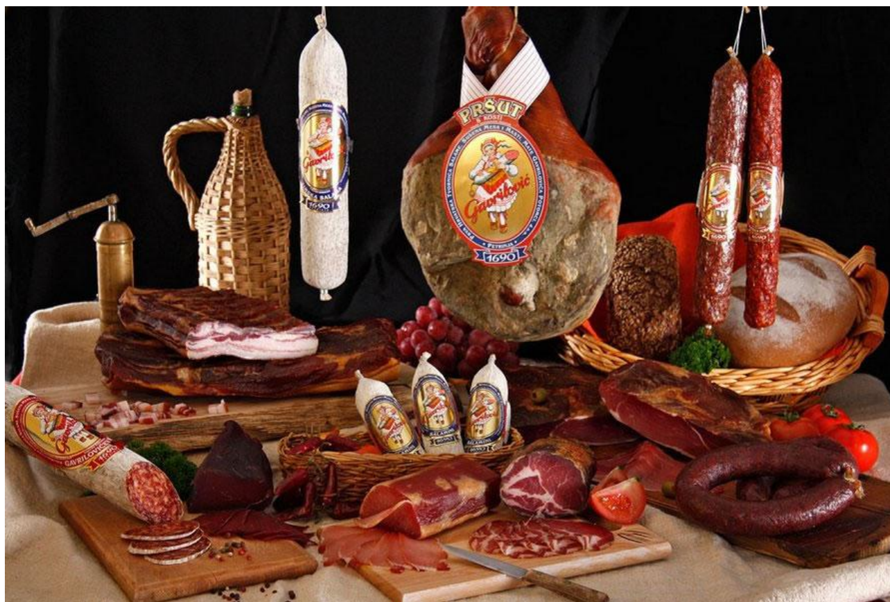
Slika 6. Gavrilović – brend od povjerenja ( http://gavrilovic.com )

Za Hrvatsku je također vrlo važna prehrambena industrija Kraš d.d., ona se bavi proizvodnjom konditorskih proizvoda, a također je jedna od najvećih u jugoistočnoj Europi jer njezina godišnja proizvodnja premašuje brojku od 33.000 tona. Ledo je tvrtka koja proizvodi sladolede i zamrznute proizvode poput tijesta, voća i povrća te ribe. Osnovan je 1958. godine i tada i tada je predstavio svoj prvi proizvod Snjeguljicu, dio je koncerna Agrokor. PIK Vrbovec je Hrvatsko dioničko društvo iz Vrbovca. 2005. godine postaje dijelom koncerna Agrokor i tada počinje brži razvoj kompanije, koja svake godine proizvodi veće količine proizvoda. PIK proizvodi visokokvalitetne robne marke, te one svojom kvalitetom mogu parirati najboljim svjetskim proizvodima. 5