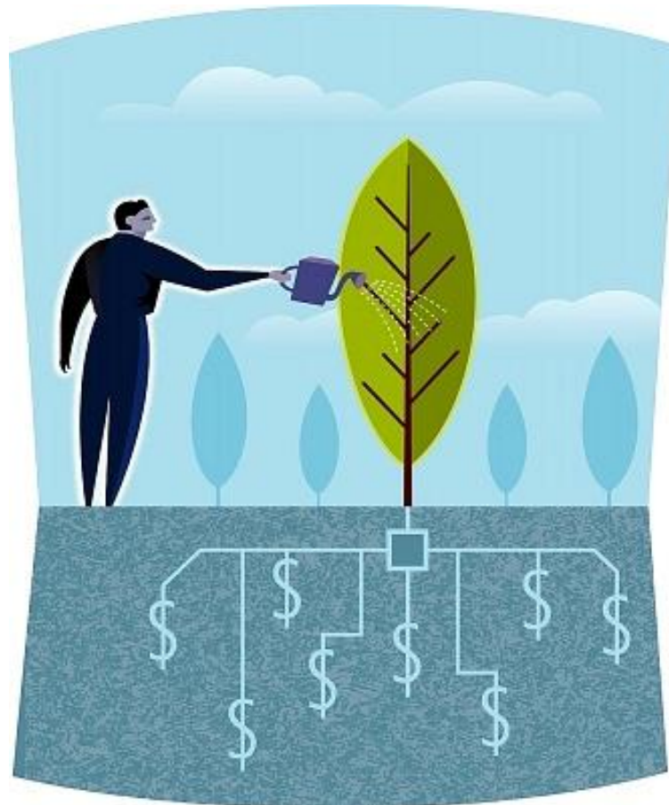
Slika 1. Proizvodnja hrane i porast prihoda ( http://proizvodnjahrane.com )

Stoga ne čudi što se javlja sve više pitanja i dvojbi vezanih uz utjecaj hrane na zdravlje čovjeka, sve je više pobornika zdrave prehrane, "zelenih" i slično. Sve veći dio znanstvenika postaje svjestan nužnosti kvalitativne promjene odnosa čovjeka prema prirodi, načinu proizvodnje hrane te njene raspodjele i potrošnje.