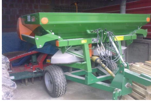
Slika 13. Rasipač na OPG-u „Dugina“

Prihrana je obavljena 26.02.2016. sa 170 kg/ha KAN-a. Njega usjeva obavljena je sredinom studenog, obavljeno je valjanje s drljanjem zbog jake zbijenosti tla. Valjanje s drljanjem uspostavilo je bolji kontakt sjemena i tla i omogućeno je brže klijanje i nicanje. Žetva pšenice obavljena je 6.07.2016. Prinos pšenice iznosio je 6.5 t/ha. (slika 14.).