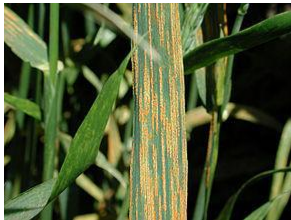
Slika 3. Puccinia striiformis simptomi

Bolest se do nedavno javljala sporadično i nije bilo značajnijih šteta, međutim u 2014. utvrđena je u epidemijskim razmjerima. Napada sve nadzemne dijelove žitarica (pšenica, ječam, zob, raž). Najkarakterističniji simptomi bolesti su na plojci, te pljevicama, a slabije se pojavljuju na rukavcu i vlati (slika 3.). Jak napad na pljevice je štetan jer značajno smanjuje punjenje zrna. Na početku bolesti na listovima nastaju uredosorusi koji izgledaju kao limun žute boje. Po nastajanju su pojedinačni, vrlo sitni (0,5 - 1,0 mm x 0,3 - 0,5 mm). Kod zaražena pšenice dolazi do nekroze i sušenja zaraženih dijelova lista. Pljevice djelomično ili potpuno poprime smeđu boju. Pred kraj vegetacije nastaju teleutosorusi crne boje koji su trajno pokriveni epidermom i u kojima se nalaze teleutospore. Na pojavu hrđe povoljno utječe hladno i vlažno vrijeme. Optimalne temperature za klijanje uredospora su od 10 do 15 °C uz vlagu 100%. Životni ciklus je pri tim temperaturama kratak. Uredospore su otporne na temperaturu do -15 °C pri kojoj mogu ostati vitalne do tri mjeseca (Kišpatić, 1992.).