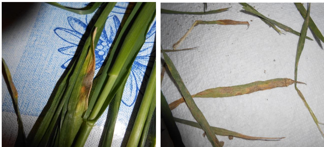
Slika 20,21. Septoria tritici na pšenici

13.05.2016. utvrđena je u slabijem intenzitetu i pojava pepelnice, uz već utvrđenu S. tritici (slika 22.). S. tritici se proširila i na list zastavičar, ali u slabijem intenzitetu. U cilju zaštite lista zastavičara i klasa obavilo se suzbijanje kombinacijom fungicida Caramba u količini od 1,2 - 1,5 l/ha i Duett Ultra u dozi od 0,4 - 0,6 l/ha.