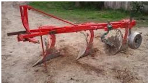
Slika 11. Trobrazdni plug na OPG-u „Dugina“

Pšenica je bila zasijana na 60 hektara. Predusjevi su bili suncokret (30 ha) i kukuruz (30 ha). Prije sjetve obavljeno je duboko oranje 25.09. 2015. godine trobrazdnim plugom na dubinu 30 cm (slika 11.). Budući da je prošla godina bila ekstremno kišna tlo je bilo teško za obradu.