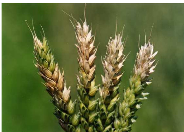
Slika 7. Fuzarijska palež klasova

zelene boje, a zaraženi klasovi gube boju, postaju slamnato žuti, odnosno bijeli te su uspravni (slika 7.). Od posljedice napada zrna su sitna i smežurana, a vrlo često ne proključaju. Uvjeti koji pogoduju ovoj bolesti su dužina cvatnje, kišna godina i visoka relativna vlažnost zraka (85%) uz temperature oko 25 °C (Champeil i sur. 2004.). Suzbijanje gljiva iz roda Fusarium obavlja se neizravnim i izravnim, odnosno kemijske mjerama suzbijanja. Najznačajnija neizravna mjera jest plodored u kojem se pšenica ne bi trebala sijati iza kukuruza. Žetvene ostatke treba duboko zaorati u tlo, poželjno je koristiti i deklarirano sjeme kao i otporne sorte. Izvor zaraze mogu biti i neki korovi (Ilić i sur. 2012.). Kemijsko suzbijanje provodi se od početka pa do pune cvatnje žitarica. Kod prskanja treba obratiti pažnju o jačini vjetra jer klas treba biti tretiran sa svih strana.