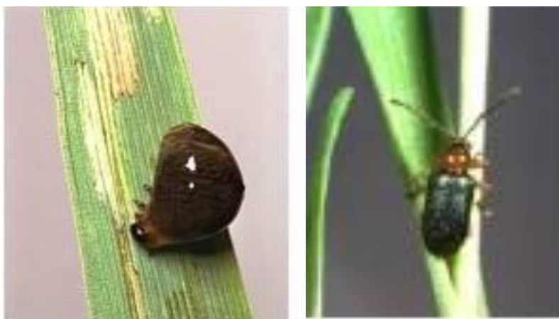
Slika 8. i 9. Ličinka i odrasli oblik žitnog balca

Kornjaš plave boje, nadvratnjak i noge su mu narančaste boje, a glava i ticala su crne boje (slika 8.). Njegova dužina kreće se oko 4 mm. Ličinke su žute. Svojim izgledom podsjeća na balavog puža zbog toga što je ličinka pokrivena crnom sluzi koja je nastala od izmeta (slika 9.). Odrasli kukci se hrane listom izgrizajući ga u vidu pruga. Ličinke se hrane isto gornjim slojem lista, što dovodi do pojave prozirnih izduženih pruga. Pojavljuje se i lokalno te čini mjestimične štete (Ivezić, 2008.). Od preventivnih mjera suzbijanja značajna je je duboka jesenja obrada tla, gdje se žitni balac unosi u dublje slojeve i tako se uništava. Kod jačeg napada tijekom vegetacije, osnovno suzbijanje ličinki vrši se kada je utvrđena 1 ličinka po zastavici.