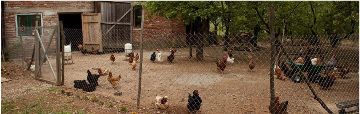
Slika 12 : Ekološki uzgoj kokoši (Linatura, 2016.)