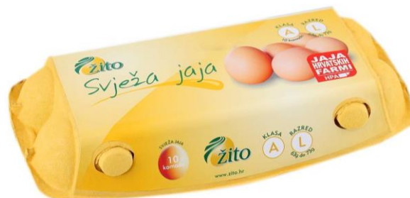
Slika 5: Jaja A klase tvrtke Žito d.o.o. (Konzum, 2016.)

2. jaja »B« klase namijenjena industrijskoj preradi.