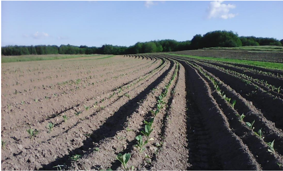
Slika 11. Duhan nakon presađivanja u polje, OPG Krapac