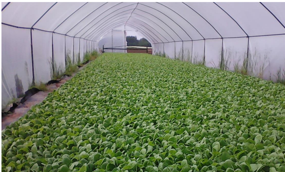
Slika 4. Presadnice duhana u plasteniku na OPG Vuković

Vuković Luka vlasnik je OPG-a na kojem je proizvodnja duhana zasnovana na 10,5 ha i kooperant je Hrvatskih duhana. Plitice sa posijanim sjemenom kupuje od Hrvatskih duhana, a presadnice proizvodi u hidroponu u plastenicima (slika 4). Sjeme je strojno posijano u kontejnere, a OPG kupuje 19 paleta (96 kom./paletu). Ima tri bazena dubine 20 cm napunjenih vodom na kojima plutaju stiropor kontejneri. Od gnojiva je dodano NPK 5 kg/bazenu, a presad je stavljen 12.03. na vodu. Prihrana se vršila s dušičnim gnojivom (KAN) u količini od 5 kg/bazen, a od zaštitnih sredstva dodavali su se izmješani Ridomil Gold MZ Pepite (metalaksil + mankozeb) u količini od 62 g, Previcur Energy (propamokarb + fosetil) u količini od 62 ml i Ortiva Top (azoksistrobin + difenkonazol) u količini od 62 ml po bazenu i prozračivalo se. Šišanje duhana obavljalo se 03.05., 29.06. i 04.05. Sredinom petog mjeseca tretiralo se insekticidom Boxer 200 SL (imidakloprid) u količini od 10 ml/10 l vode/ plasteniku protiv lisnih uši.