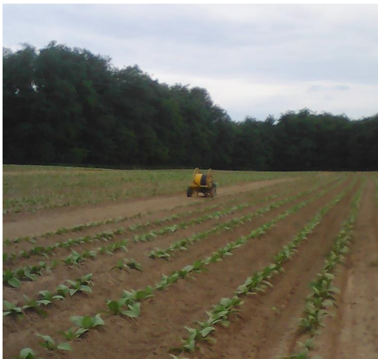
Slika 13. Uređaj za navodnjavanje – rolomat, OPG Krapac