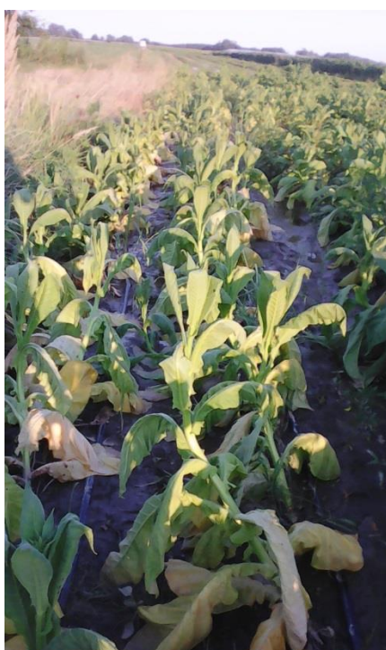
Slika 16. Duhan nakon obilnih oborina, OPG Vuković