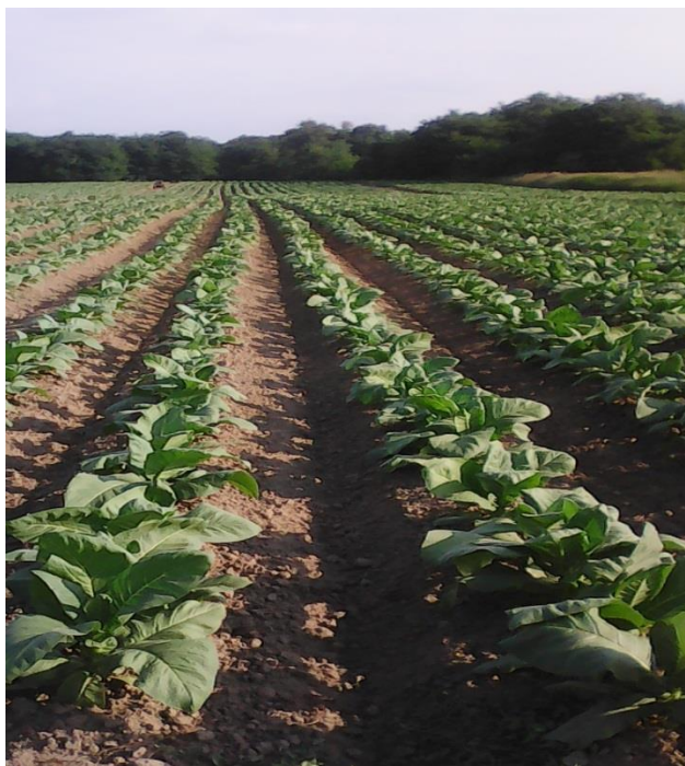
Slika 15. Duhan u fazi intenzivnog porasta, OPG Krapac