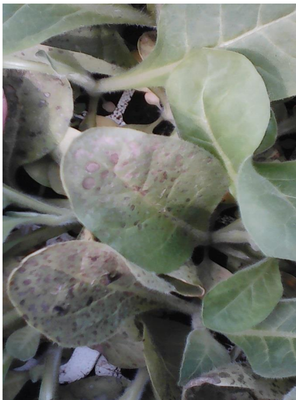
Slika 17. Colletotrichum nicotianae (foto Martina Miholančan)