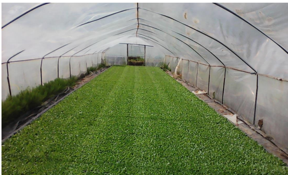
Slika 5. Presadnice duhana u plasteniku na OPG Krapac

Na OPG Krapac u plodoredu duhan se izmjenjuje s kamilicom i pšenicom. Suzbijanje korova vršilo se herbicidom Command 480 EC (klomazon), zbog postojećih zaliha sredstva. Sredinom šestog mjeseca tretiralo se s Karate Zeon (lambda cihalotrin) i Dali SL (imidakloprid) protiv buhača. Prva berba obavljena je 07.07.2016. godine.