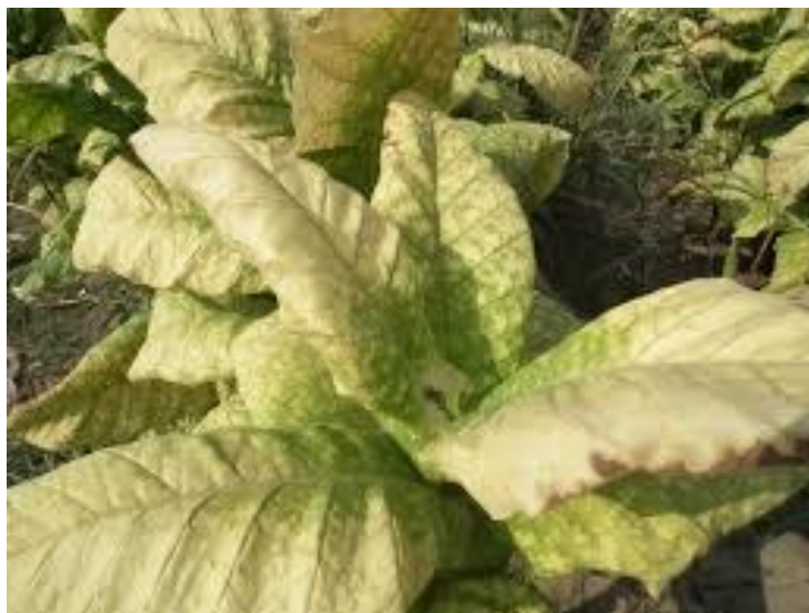
Slika 1. Plamenjača na duhanu.

Ostojić, Glasilo biljne zaštite, 2016.). Dithane je kontakti fungicid i vrlo je bitno da se koristi u razmacima od 5 do 7 dana. Prema Gošić (2013.) broj i razmak između prskanja ovisi o oborinama, a najčešći intervali u sušnim godinama su maksimalno 14 dana. U godinama masovne pojave plamenjače koriste se sredstva kao Ridomil za zalijevanje rasada, a kasnije i u polju nakon presađivanja uz dodatak nekog od kontaktnih fungicida.