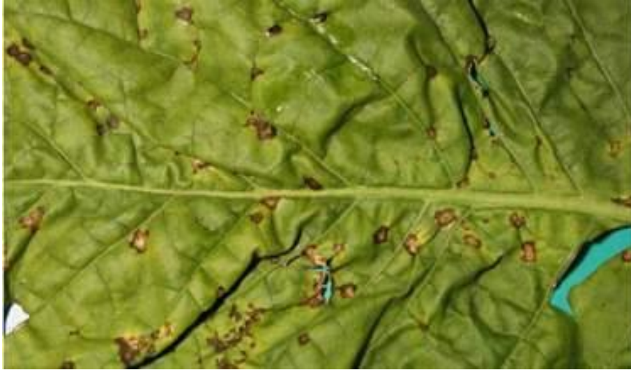
Slika 2. Bakterijska palež ili Divlja vatra na duhanu.

Mozaik duhana ( Nicotiana virus ) čini velike štete u Podravini. To je polifagna virusna vrsta koja napada 550 zeljastih i drvenastih kultura. Simptomi na najmlađem lišću su svjetlija nervatura i mozaična pjegavost. Prema Gagro (1998.) zaraženi listovi lošeg su kemijskog sastava (puno bjelančevina, manje ugljikohidrata). Virus se održava na zaraženim biljnim ostacima i fermentiranom duhanu pa pušači ne smiju raditi u proizvodnji rasada bez prethodne dezinfekcije ruku. Rasad je potrebno proizvoditi u sterilnom supstratu, neophodno je raditi sa čistim priborom, a radnici nakon rada trebaju oprati ruke i ne trebaju pušiti. Jedina mjera borbe je čupanje i odstranjivanje zaraženih biljaka. Prenosi se mehanički, viličicom i sjemenom (ali ne i sjemenom duhana).