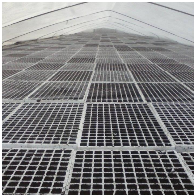
Slika 7. Kontejneri tek stavljeni na vodu, OPG Krapac