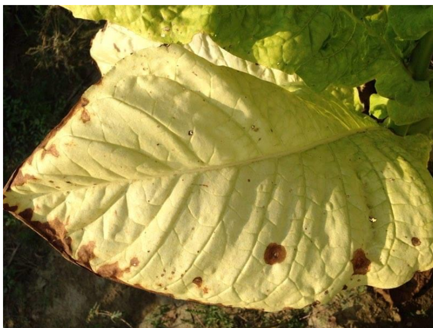
Slika 18. Alternaria alternata