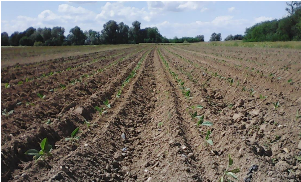
Slika 10. Duhan nakon presađivanja u polje, OPG Vuković