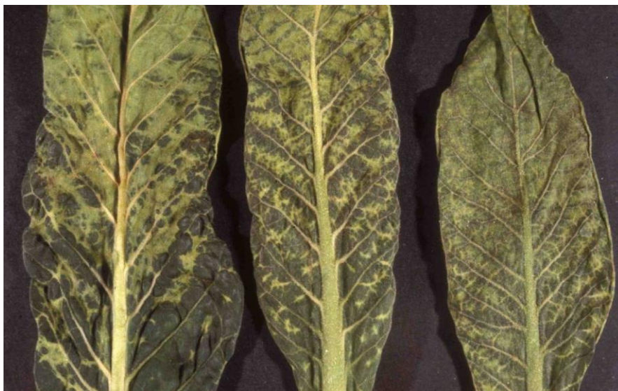
Slika 3. Virus mozaika duhana.