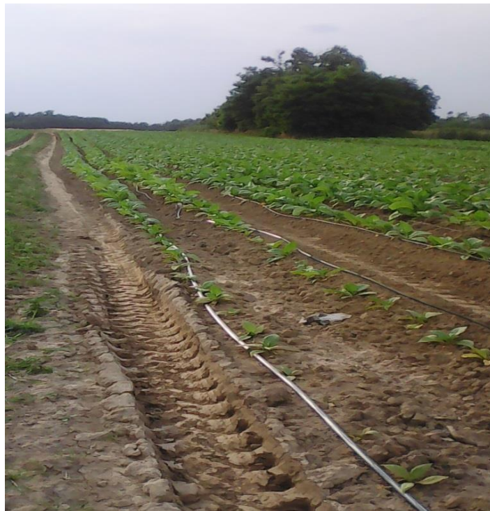
Slika 12. Cijevi za navodnjavanje, OPG Vuković