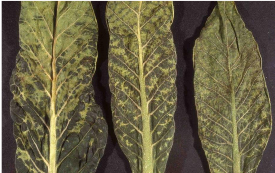
Slika 3. Virus mozaika duhana.