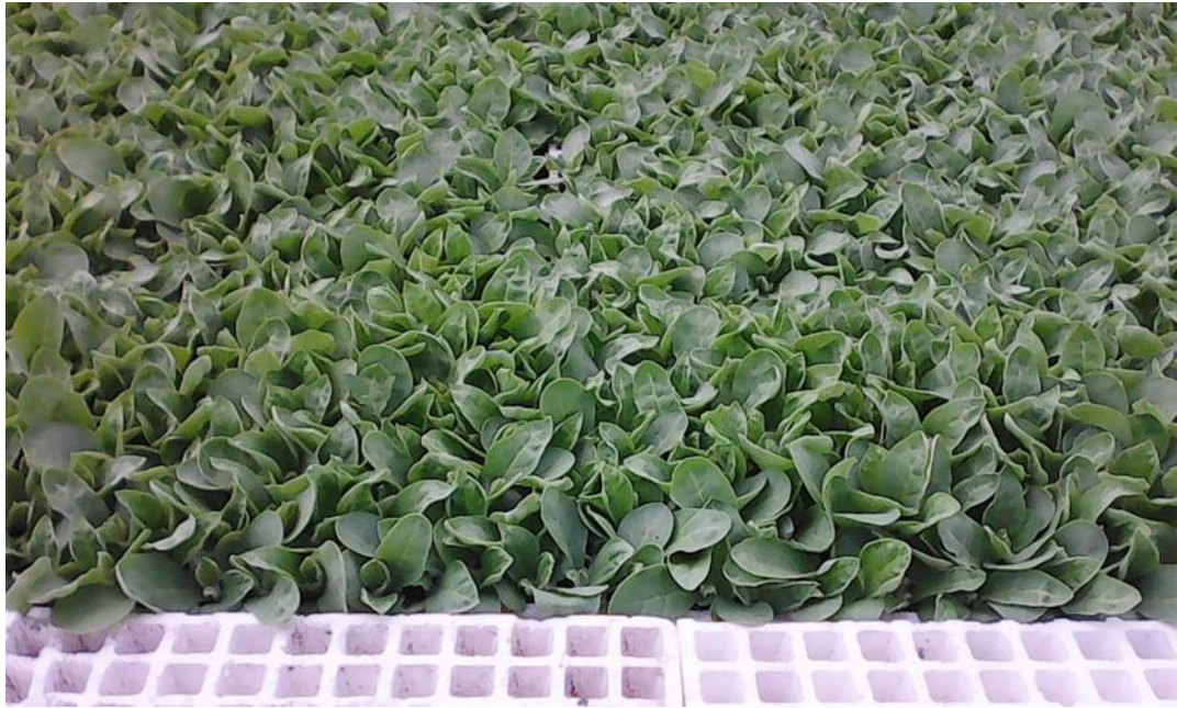
Slika 9. Rasad duhana, OPG Vuković