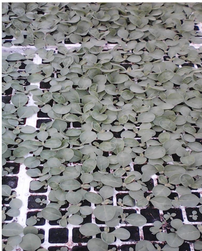
Slika 8. Rasad duhana, OPG Krapac