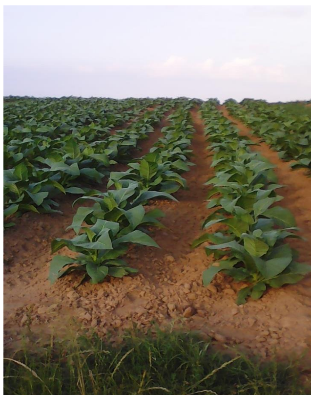
Slika 14. Duhan u fazi intenzivnog porasta, OPG Vuković