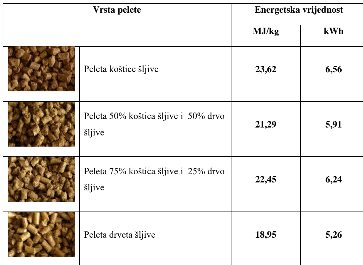
Tablica 4. Energetske vrijednosti proizvedenih peleta

Približne energetske vrijednosti koje odgovaraju peletama prikazane su u Tablici 5.