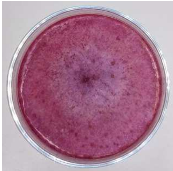
Slika 3. Fusarium culmorum (original)

Fusarium culmorum je gljiva koja je u stanju izazvati trulež korijena i donjeg dijela stabljike, te fuzarijsku palež klasa na različitim žitaricama malog zrna, a posebice na pšenici i ječmu. To uzrokuje značajne gubitke kvalitete i prinosa i rezultira zagađenost žitarica mikotoksinima (Scherf i sur., 2013).