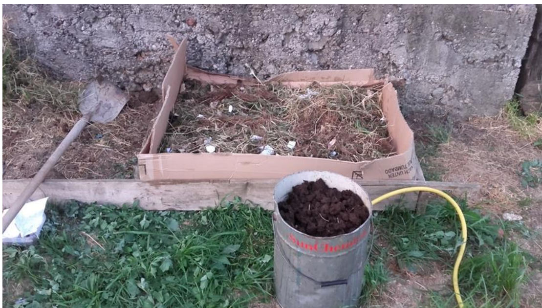
Slika 13: Izrada mjesta za glisnjak