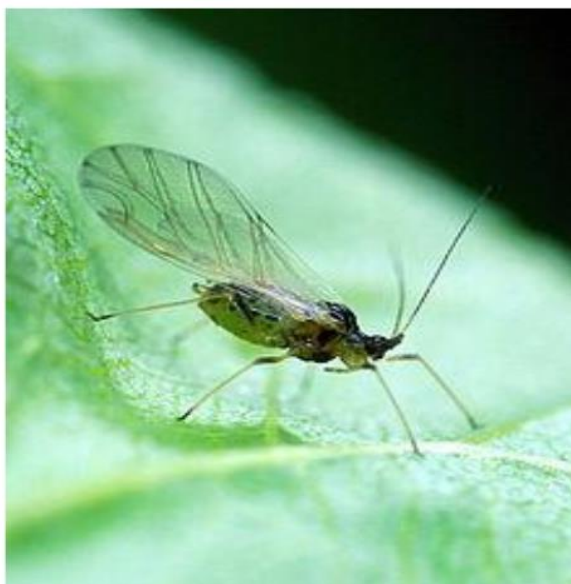
Slika 5. Lisna uš