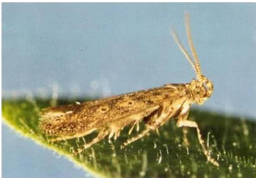
Slika 6. Lisni miner rajčice