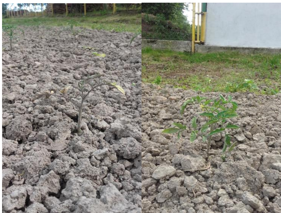
Slika 18: Primjer bolesne i zdrave rajčice

Iz navedenih rezultata se vidi da je pojava plamenjače bila slabijeg intenziteta, i ocjena bolesti nije bila veća od 1 (Slika 18.), dok se indeks bolesti kretao od 0,04 (Gz+Gp) do 0,08 u kontroli.