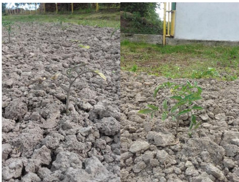
Slika 18: Primjer bolesne i zdrave rajčice

Iz navedenih rezultata se vidi da je pojava plamenjače bila slabijeg intenziteta, i ocjena bolesti nije bila veća od 1 (Slika 18.), dok se indeks bolesti kretao od 0,04 (Gz+Gp) do 0,08 u kontroli.