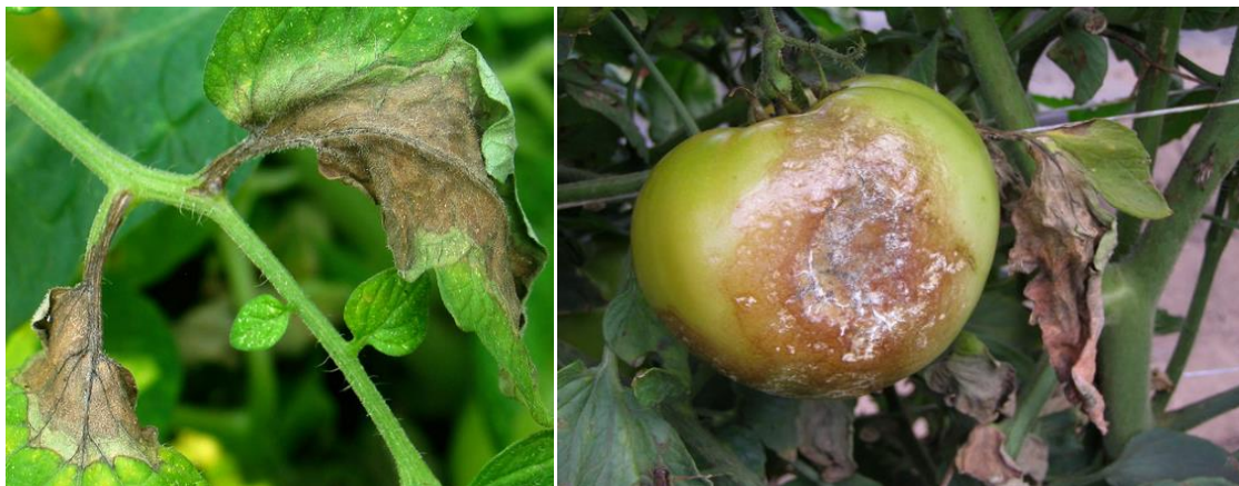
Slika 7: Kasna plamenjača – oštećeni listovi i plod rajčice