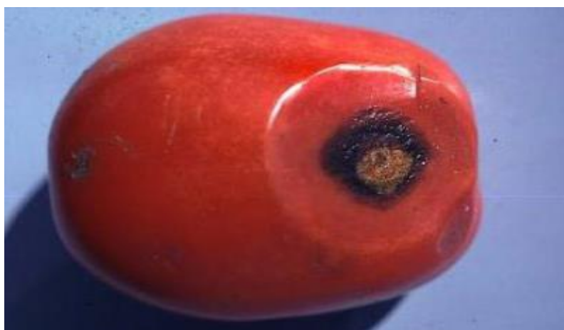
Slika 8: Antraknoza ploda rajčice

Antraknoza, uzrokovana gljivicom Colletotrichum coccodes , je jedno od najčešćih oboljenja rajčice. Prvi simptomi postaju vidljivi na zrelom plodu ili tijekom zrenja kao male kružne mrlje na koži. Kako se ove mrlje počinju širiti, razvija se tamno središte ili koncentrični prstenovi s tamnim pjegama, koje stvaraju spore od gljiva (Slika 8.).