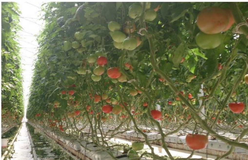
Slika 2. Hidroponski uzgoj rajčice

Dugogodišnja eksploatacije tla i nepoštivanje plodoreda u plastenicima dovodi do gubitka kvalitete tla, loše strukture, stvaranja nepropusnog sloja, visokog sadržaja hraniva i soli, pojava štetnika i bolesti tesmanjenja prinosa. Iskustva razvijenih zemalja govore da je najbolje rješenje uvođenje hidroponskog načina uzgoja povrća. Riječ hidropon dolazi od grč. Hydor - voda i ponos –rad, a predstavlja uzgoj biljaka na inertnim supstratima ili bez njih u hranjivoj otopini (Slika 2.)(Parađiković, 2008). Hidroponska tehnologija uzima zamah sredinom 20. stoljeća. Trenutačni lider u hidroponiji je Nizozemska koja je prije 15 godina imala čak 40% zaštićenih prostora s takvom proizvodnjom. Hrvatska je još uvijek na početku te su površine pod hidroponskom proizvodnjom zanemarive. Glavni oblik proizvodnje povrća u hidroponu jest uzgoj u inertnom supstratu.