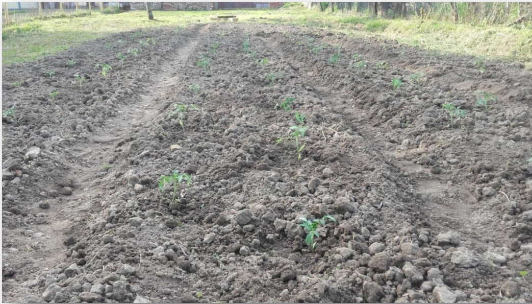
Slika 15: Sadnja rajčice