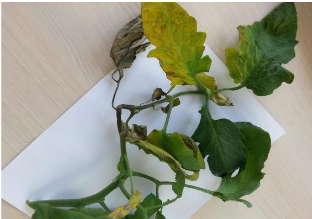
Slika 11: Simptomi fuzarioze na listu rajčice