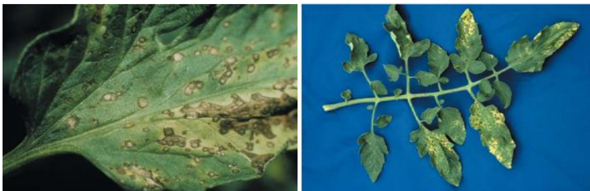
Slika 10: Septoria pjege na listu