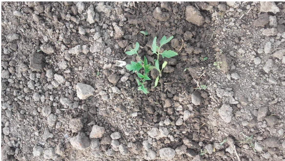
Slika 16: Biljka rajčice