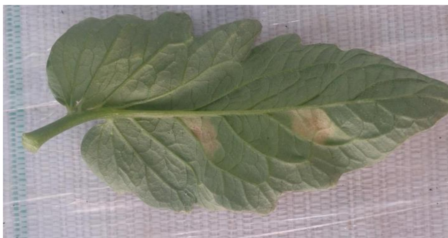
Slika 9: Baršunasta plijesan

Ova bolest javlja se u zaštićenim prostorima na osjetljivim sortama rajčice. Obično se javi u niskim plastenicima za vrijeme kišnog vremena, kada je teško regulirati vlagu, a temperatura u objektu bude 20 – 22 °C. Napad bolesti počinje od donjih najstarijih listova i širi se prema vrhu biljke. Na licu lista javljaju se nekroze, a s donje strane maslinastozelene baršunaste prevlake (Slika 9.). Ako gljiva napadne čitav list on se deformira i osuši. Zaraza se može proširiti na cvjetove koji otpadaju, a rjeđe zahvaća i plod. Uzročnik bolesti preživljava u tlu na zaraženim biljnim ostacima ili na armaturi plastenika. Izvor zaraze može biti zaraženo sjeme. Za razvoj gljive potrebna je temperatura 10-32 °C (optimalna 22 °C). Bolest se razvija samo pri visokoj relativnoj vlazi zraka (>85%) (Maceljki i sur. 2004).