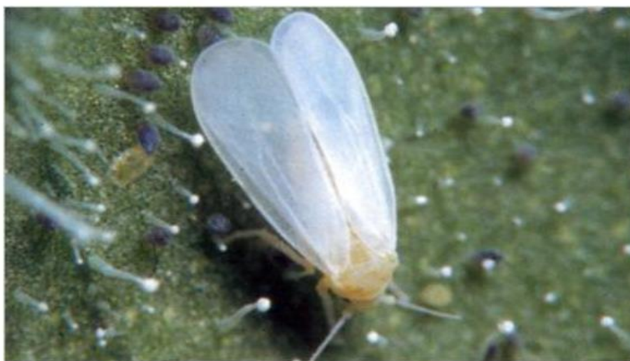
Slika 4. Napad cvjetnog štitastog moljca

Da je biljka zaražena tim štetnikom možemo vidjeti po mednoj rosi po plodovima i listovima, a kasnije se na ljepljivim naslagama razviju gljive čađavice. Odrasli oblici "leptirića" i jaja nalaze se masovno uvijek na vršnim listovima, a ličinke i kukuljice nalaze se na listovima donjih etaža. Početne zaraze odraslim oblicima teško se uočavaju jer se nalaze na naličju listova. Od plodovitog povrća najviše strada rajčica. Njezin prirod može biti smanjen do 40 % što je vrlo visok postotak (Maceljki, 2002).