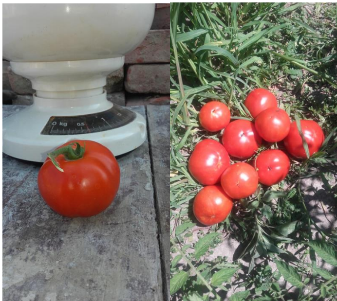
Slika 19: Plod rajčice

Kompostni čaj se općenito koristi na dva načina ili za kontrolu bolesti ili kao hranivo i promotor rasta. Iako je u našim istraživanjima pojava i intenzitet plamenjače bila slabijeg intenziteta uporaba kompostnog čaja je rezultirala većim urodom rajčice u usporedbi s kontrolom. Kompostni čaj pokriva površinski sloj biljke i korijen s mikroorganizmima osiguravajući povoljne uvjete za rast rajčice. Kombinacija kompostnog čaja i hraniva s pokazala kao jeftina, okolišno prihvatljiva i sigurna metoda u kontroli plamenjače rajčice u istraživanjima (Al-Mughrabi, 2007.). Također je utvrđeno da kompostni čaj aktivira induciranu otpornost kod biljaka. Naša istraživanja potvrđuju korisnost kompostnog čaja u uzgoju rajčice i kontroli plamenjače rajčice.