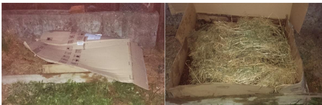
Slika 14: Završni sloj mjesta za glisnjak

Presadnice u sadene u razmaku od 50 cm. Smještene su u sredinu držeći se za stapku. Ogrnute su zemljom te su dobro učvršćene. Sadnja je obavljena 26. travnja 2016. godine. Razmak između redova je ostavljen dosta širok radi višekratne berbe i njege usjeva (Slike 15. i 16.). Svi agroekološki uvjeti – temperatura, svjetlost, voda i tlo su bili optimalni od sadnje pa do berbe. Vremenski uvjeti su bili povoljni za rast korova, tako da je već sredinom svibnja obavljeno prvo mehaničko odstranjivanje korova i plijevljenje nasada. Drugo odstranjivanje korova je obavljeno krajem svibnja kada se obavilo i zagrtanje do prvih donjih listova.