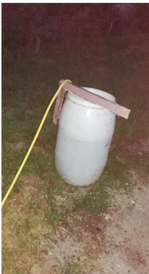
Slika 17: Izrada tekućeg gnojiva

Prvo tretiranje kompostnim čajem (glisnjakom) je obavljeno 26.05.2016. godine zalijevanjem tla ili nadzemnog dijela biljke ili oboje ovisno o varijanti pokusa. Tretiranje glisnjakom je obavljano još dva puta 15.06.2016. i 10.07.2016.