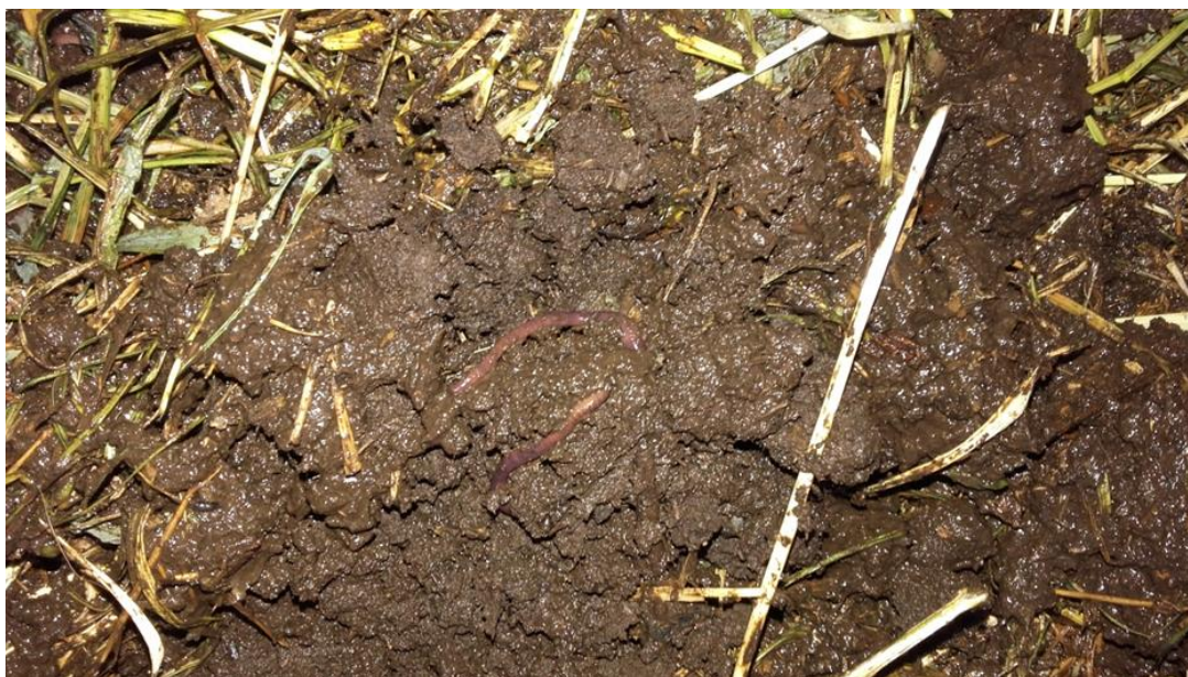
Slika 12: Kalifornijska glista

proizvodnju sadnica. U poljodjelstvu i povrtlarstvu služi kao osnovno i startno kao i za prihranjivanje tijekom vegetacije.