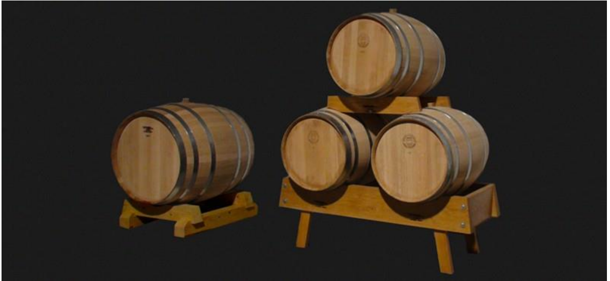
Slika 6. Barrique bačve

Vino može odležavati na talogu i u inox posudama, međutim tada se susrećemo s određenim problemima i opasnostima. Najveća opasnost je od pojave H_2S (sumpor vodik) koji daje neugodan miris na pokvarena jaja. Budući da kvasci djeluju redukcijski (troše kisik), a inox ne propušta zrak, stvaraju se uvjeti (redukcijski) za pojavu ovog nepoželjnog sastojka u vinu. Zato u ovom slučaju treba posebnu pažnju posvetiti talogu, redovito ga kontrolirati i pratiti tijekom dozrijevanja. Naravno potpuno isti efekt, kao kod odležavanja u drvu, nikad nećemo i ne možemo postići, jer je inox inertni materijal koji ništa ne propušta(zrak) i ništa ne daje vinu (drvo sadrži polifenole koje ekstrahira vino).