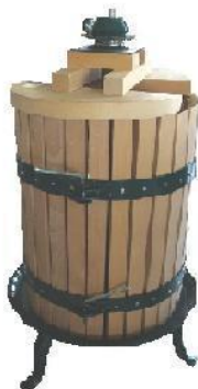
Slika 3. Mehanička preša

Okomite mehaničke preše vrlo su stare i još ih nalazimo u upotrebi, u manjim obiteljskim gospodarstvima, koja još proizvode vino na tradicionalan način. Ova se preša sastoji od metalnog postolja s vijkom, koša i potisne ploče. Potisna ploča (sastoji se iz dva drvena dijela) mehanički, putem poluge i vijka, pritišće drop prema dolje. Mošt istječe između letvica koša i skuplja se u posudi ispod koša. Najveći nedostatak ovih preša je da prilikom prešanja dolazi do velikog kontakta mošta i zraka (jaka oksidacija) te da nema mogućnost rastresanja dropa, što otežava prešanje i daje manji randman.