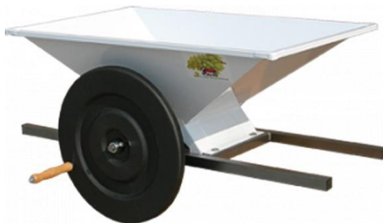
Slika 2. Ručna muljača

Runjanje je odvajanje bobice od peteljke, bez gnječenja. Strojewe nazivamo runjače, a kako rade na principu centrifuge, istodobno su i runjače i muljače. Izdvojene peteljke padaju u posebnu posudu, u kojoj se iznose iz preradbenog prostora ili kod većih pogona, izbacuju direktno pneumatskim elevatorom ili trakastim transporterom. Muljanje je gnječenje grožđa ili samo bobica, ako je prethodnom radnjom (runjanjem) u vodoravnom bubnju odvojena peteljka. Obavlja se gaženjem ili strojevima za odvajanje groždanog soka od kože i sjemenke. Runjanjem - muljanjem odvajamo dakle peteljku i gnječimo grožđe, te na taj način sprečavamo ekstrakciju taninskih i drugih tvari koji bi inače iz peteljke prešli u mošt (to je naročito pojačano tijekom vrenja, jer svi ti sastojci nisu topivi u moštu nego u alkoholu). Runjača - muljača sastoji se od lijevka za prihvatanje grožđa, rupičastog valjka za odvajanje bobice od peteljke i valjaka koji gnječe bobice.