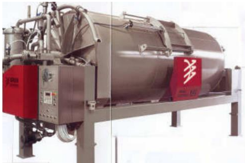
Slika 5. Vakuum preša

Najnovije tehnološko rješenje za prešanje masulja su vakuum preše. Njihov rad se zasniva na stvaranju vakuuma za razliku od pneumatskih koje prešaju na bazi stvaranja tlaka. Ocjeđivanje mošta se vrši kroz drenirane otvore (koji se sami čiste) a nalaze se u unutrašnjosti spremnika. Takav tip preše ima sistem pranja dreniranih otvora koji se sastoje od inox ventila a postavljeni su na samom ulazu spremnika. Kroz drenirane otvore mošt se usisava i usmjerava ka vanjskom spremniku za prihvatanje. Membrana za separaciju između dva odjela spremnika je najlonska, a sam materijal je termo spojiv u slučaju oštećenja membrane. Sa ovakvim novim sistemom prešanja postiže se najkvalitetnije odvajanje mošta, bez negativnih učinaka i s pozitivnim kvalitativnim rezultatima, koje niti jedan drugi način prešanja nije postigao.