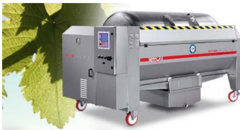
Slika 4. Pneumatska preša

Pneumatske preše novijeg su datuma i predstavljaju veliki tehnološki napredak u proizvodnji vina. Njihova najveća prednost je u tome da se prešanje obavlja pomoću platna (membrane) te na taj način ne dolazi do oštećenja krutih dijelova masulja, pa tako ni do nepoželjne ekstrakcije polifenola. Pored toga, ove preše rade s vrlo malim pritiscima, tako da gotovo cjelokupna količina isprešanog mošta može biti iskorištena u proizvodnji kvalitetnih vina, a to je vrlo bitno s obzirom na visoke cijene grožđa za proizvodnju takvih vina.