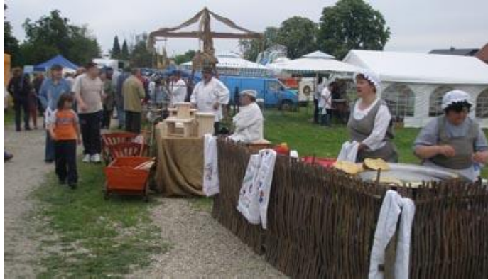
Slika 1. Sajmovi u Slavoniji danas