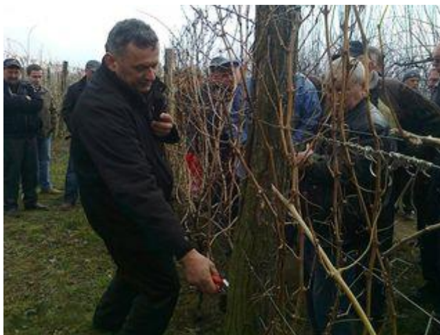
Slika 5. Dani voćara