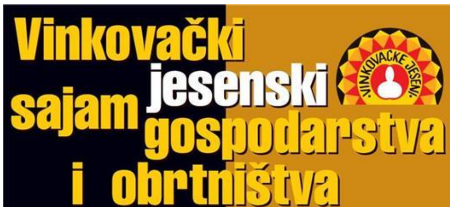
Slika 4. Sajam gospodarstva