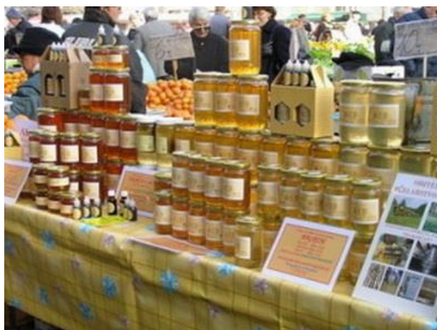
Slika 7. Dani pčelara