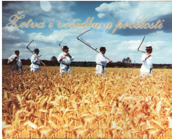
Slika 9. Žetveni sajam u Županji