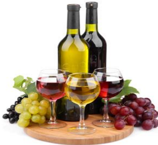
Slika 6. Ocjenjivanje vina u Iloku