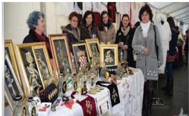
Slika 8. Tradicijske rukotvorine