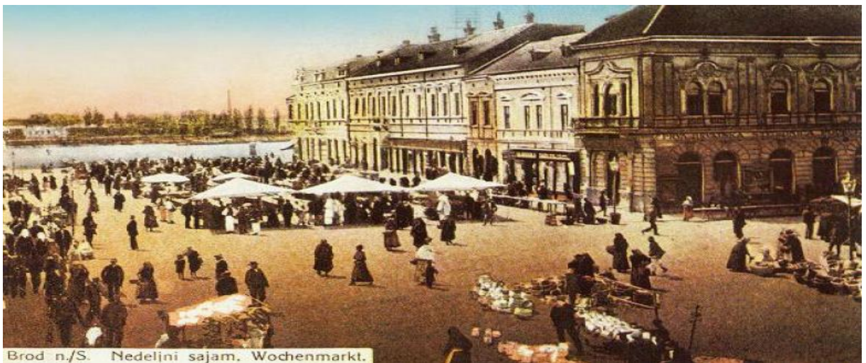
Slika 2. Sajmovi u Slavoniji nekad