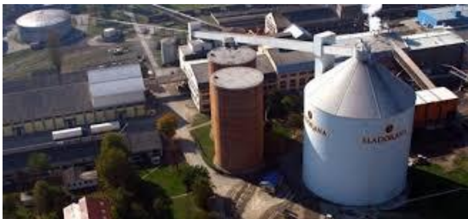
Slika 3. Prikaz tvornice šećera „Sladorana“ Županja

Tvornica šećera u Osijeku (Kandit premjer) izgrađena je 1905. godine, a prva kampanja počela je 17. 09. 1906. godine. U Belom Manastiru je šećerana puštena u rad 1912. godine, a zatvorena je zbog rata 1991. godine. Šećerana u Županji (Sladorana) je izgrađena i puštena u rad 11. 09. 1947. godine, a šećerana u Virovitici (Viro-Virovitica) 19. 10. 1980. godine.