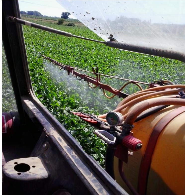
Slika 9. Zaštita od bolesti lista