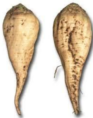
Slika 4. Korijen šećerne repe

Rep korijena je donji dio korijena uži od jednog centimetra i ide u dubinu više od 2 metra. Kod vađenja ostaje u zemlji. Jako je važan kod korištenja vode iz dubljih slojeva. 4