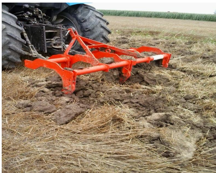
Slika 6. Podrivanje

Podrivanjem se dovodi kisik u dotada zbiti i neprozračeni sloj tla u kojem su prevladali redukcionni procesi. Nadalje ubrzanim tokovima vode u prorahljeni sloj dolaze aktivna hranjiva i korisni mikroorganizmi, a i korijenje kulturnog nalazi povoljne uvjete života. Podrivanje se vrši u kontinuiranim ili isprekidanim „pojasevima“ na određenoj dubini ispod linije oranja. Bolje je svakako da se obrađeni, odnosno podrivani sloj povezuje. Debljina podrivanog sloja varira, a iznosi u širem prosjeku od 5-15 cm. Podrivanje u pravilu ne prelazi 20 cm. Ovim načinom obrade znatno se povećava otpor tla, te se računa da podrivanje od 10 cm uz oranje na 20 cm (ukupna dubina 30 cm) povećava vučni otpor do 50%. Učinak podrivanja ne traje dugo od 2 do 3 godine. 9