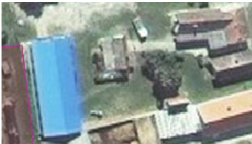
Slika 5. Prikaz ekonomskog dvorišta

Ekonomsko dvorište širine je 38 m i dugačko je 74 m. Dio dvorišta je izbetonirano, a na drugom dijelu je sitni kamen te na rubnim dijelovima trava. U dvorištu se nalazi hala dužine 30 m i širine 12 m. Pod u hali je od sitnog kamena, gospodarstvo ima u planu kroz dvije godine staviti beton umjesto kamena. Ispred te hale je šupa dimenzija 8 * 10 m u kojoj se skladišti gnojivo, pesticidi, sjeme je se tu nalazi cisterna za gorivo kapaciteta 4000 litara i prenosiva cisterna od 1000 litara. Većina strojeva bude odložena u hali, a ostali strojevi koji nisu natkriveni nalaze se u stražnjem dvorištu.