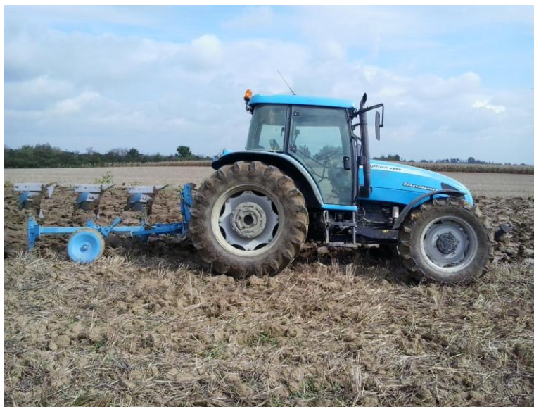
Slika 7. Oranje za šećernu repu

Druga operacija osnovne obrade je bilo oranje. Oranje se obavilo sredinom listopada 2012. godine sa traktorom Landini Mythos 110 i plugom Lemken OPAL 090 zahvata 105 cm. Dubina oranja bila je 35 cm a radna brzina 7,4 km/h.