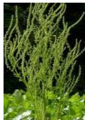
Slika 2. Šećerna repa u 2. godini

Izvor: Priručnik za proizvodnju šećerne repe