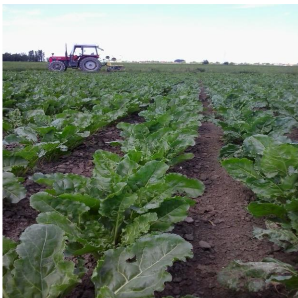
Slika 8. Izgled zemlje i šećerne repe nakon 2. kultivacije