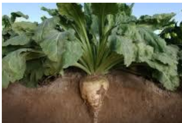
Slika 1. Šećerna repa u 1. godini

Biljke šećerne repe koje u prvoj godini uzgoja daju stablo, cvijet i plod zovu se proraslice. Do ove pojave dolazi ako biljka „greškom prepozna“ niske temperature u proljeće kao zimu između dvije godine i odmah krene u formiranje organa iz druge godine. Ova pojava je štetna jer takve biljke iscrpljuju korijen hraneći nadzemne organe i time korijen postaje potpuno nekoristan za preradu. Proraslica uvijek daje sjemenke iz kojih će izrasti proraslice.