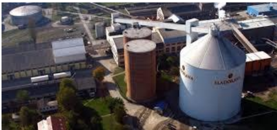
Slika 3. Prikaz tvornice šećera „Sladorana“ Županja

Tvornica šećera u Osijeku (Kandit premjer) izgrađena je 1905. godine, a prva kampanja počela je 17. 09. 1906. godine. U Belom Manastiru je šećerana puštena u rad 1912. godine, a zatvorena je zbog rata 1991. godine. Šećerana u Županji (Sladorana) je izgrađena i puštena u rad 11. 09. 1947. godine, a šećerana u Virovitici (Viro-Virovitica) 19. 10. 1980. godine.