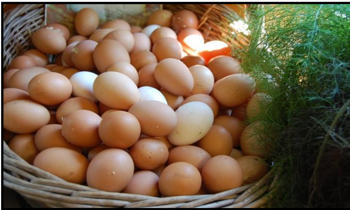
Slika 17. Jaja kokoši hrvaticice

U Republici Hrvatskoj prema godišnjem izvješću HPA, u 2014. godini je broj snesenih jaja u prosijeku 553.360, a nasadenih 184.300. Broj izvaljenih pilića je 164.454, dok je 147.399 odgojenih pilića.