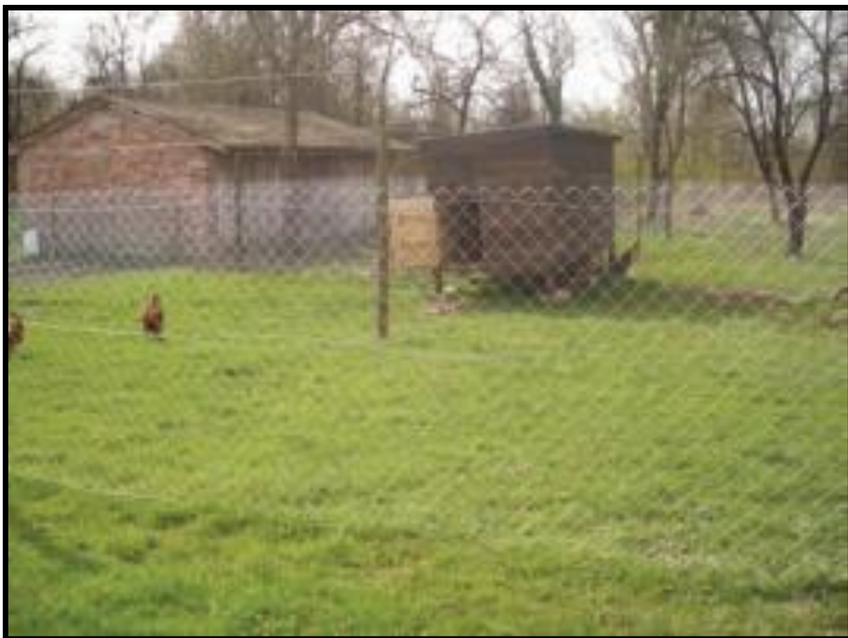
Slika 12. Smještaj kokoši/ vanjski izgled kućice

http://mystart3.dealwifi.com/search/images?fcoid=417&fcop=topnav&fpid=2&q=+doma%C4%87a+koko%C5%A1+hrvatica (20.2.2016.)