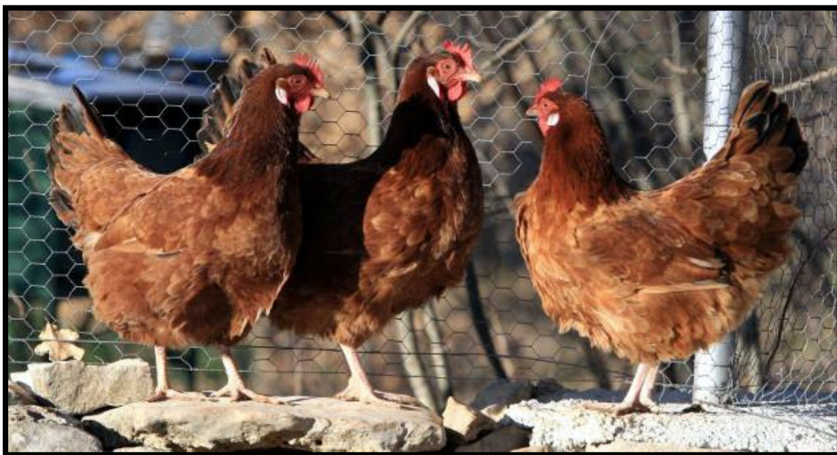
Slika 1. Kokoš hrvatica

Godišnje nese 200 do 220 jaja, svijetlo smeđe boje ljuske (Barać i sur., 2011.).