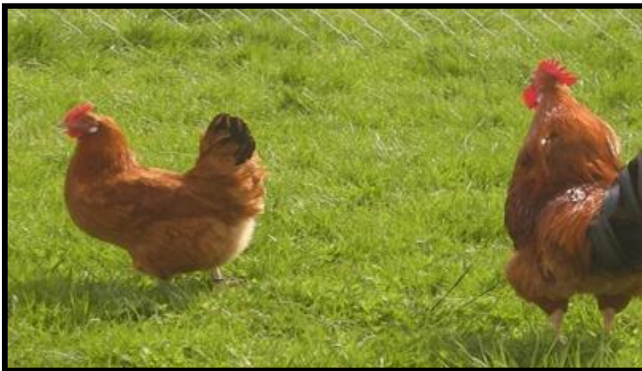
Slika 13. Kokoš hrvatica u prirodnom okruženju

Sukladno navodima HPA (2009.) sakupljanje jaja treba se vršiti svakodnevno. Jaja treba čuvati na hladnijem mjestu s prosječnom temperaturom koja ne prelazi 18°C i relativnom vlažnošću zraka oko 70%. U slučaju čuvanja rasplodnih jaja dulje od 7 dana, treba ih najmanje jednom dnevno okretati dužno za 180°.