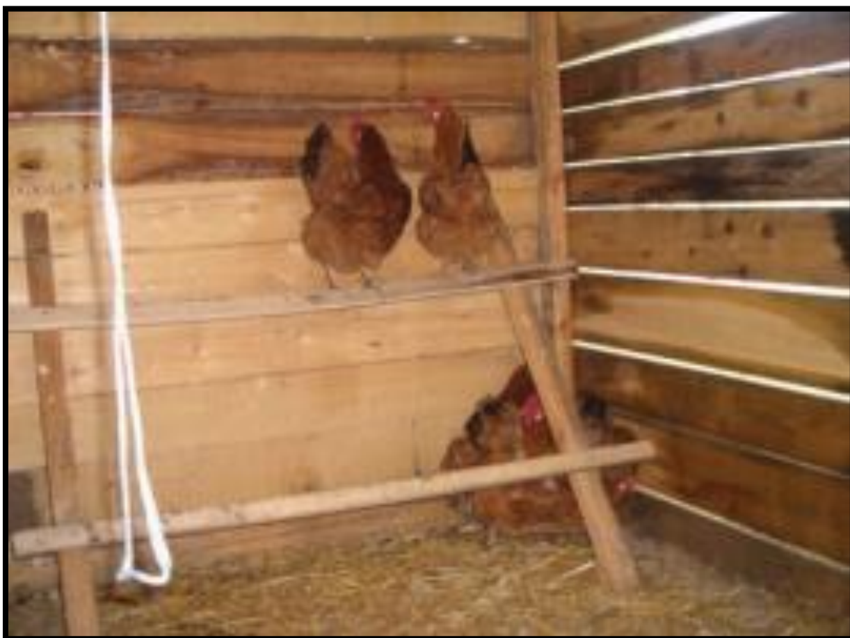
Slika 11. Unutrašnjost smještaja kokoši

http://mystart3.dealwifi.com/search/images?fcoid=417&fcop=topnav&fpid=2&q=+doma%C4%87a+koko%C5%A1+hrvatica (20.2.2016.)