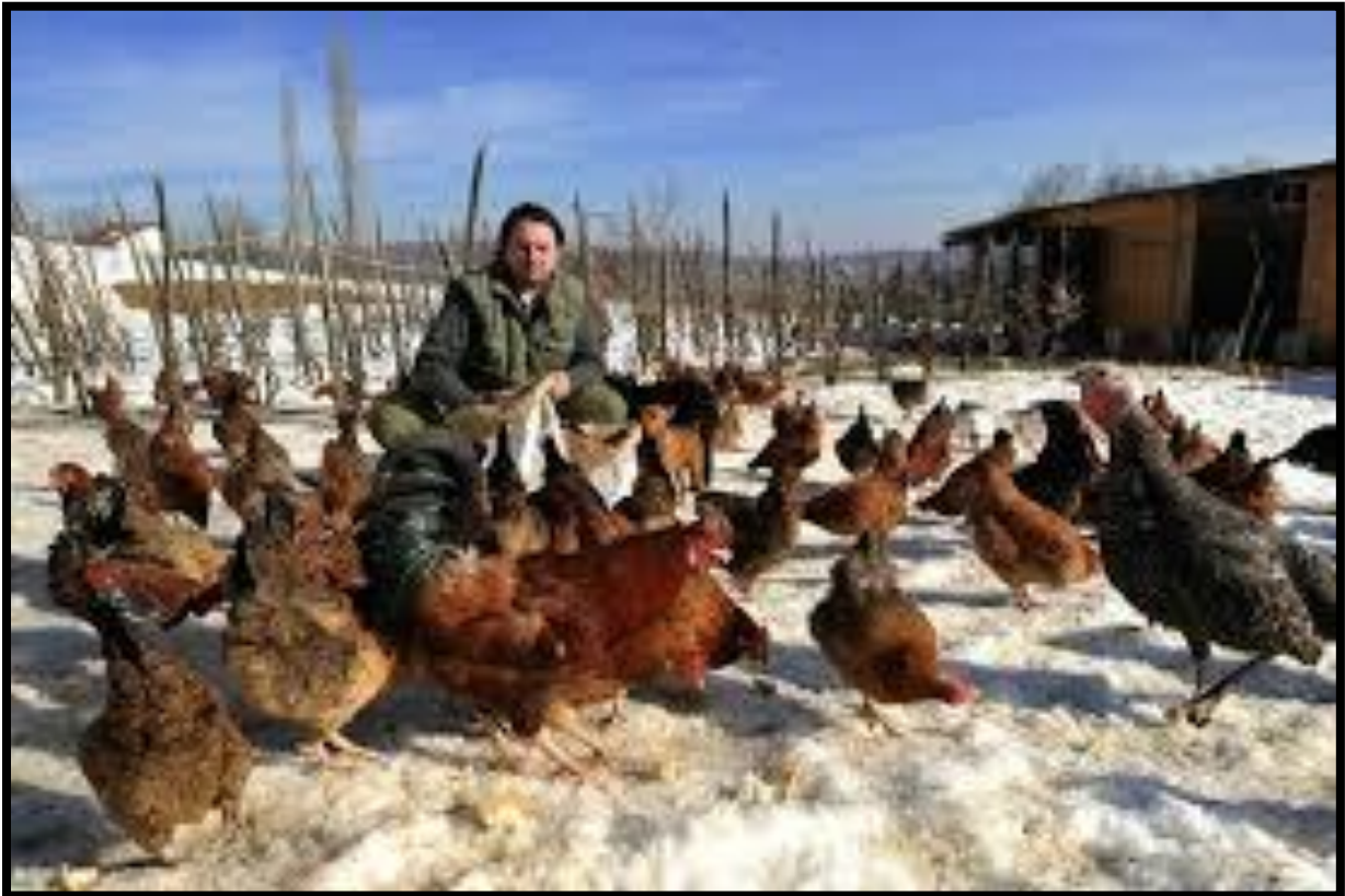
Slika 9. Kokoši hrvaticice u slobodnom uzgoju s drugom peradi

Prema Senčiću (2010.) slobodan uzgoj peradi, s korakom dalje prema organskom uzgoju temelji se na prirodnoj krmi bez primjene dodataka i sredstava za zaštitu zdravlja i održivom razvoju s prirodom. Navedeno omogućuje, uz nešto veće gubitke i cijenu, proizvodnju peradi vrlo kvalitetnih organoleptičkih svojstava, jednako mesa i jaja, a uz pravilnu i pravodobnu zaštitu zdravlja istodobno i zdravstveno ispravnu perad.