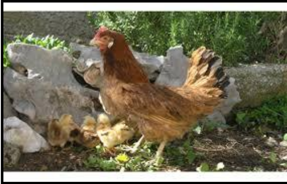
Slika 14. Kokoš hrvatica s pilićima

U tehnologiji proizvodnje konzumnih jaja kokoši hrvaticice, jedna od najzahtjevnijih faza je uzgoj samih pilenki. Pilenke se najčešće uzgajaju podnim načinom držanja.