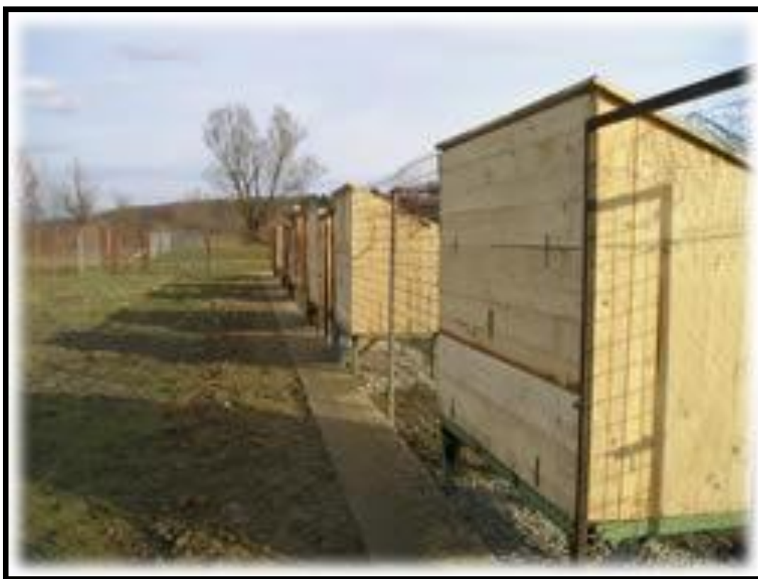
Slika 10. Prikaz kućica za smještaj kokoši

Jedan uzgajivač može imati više porodica uz uvjet osiguravanja odvojenog držanja porodica.