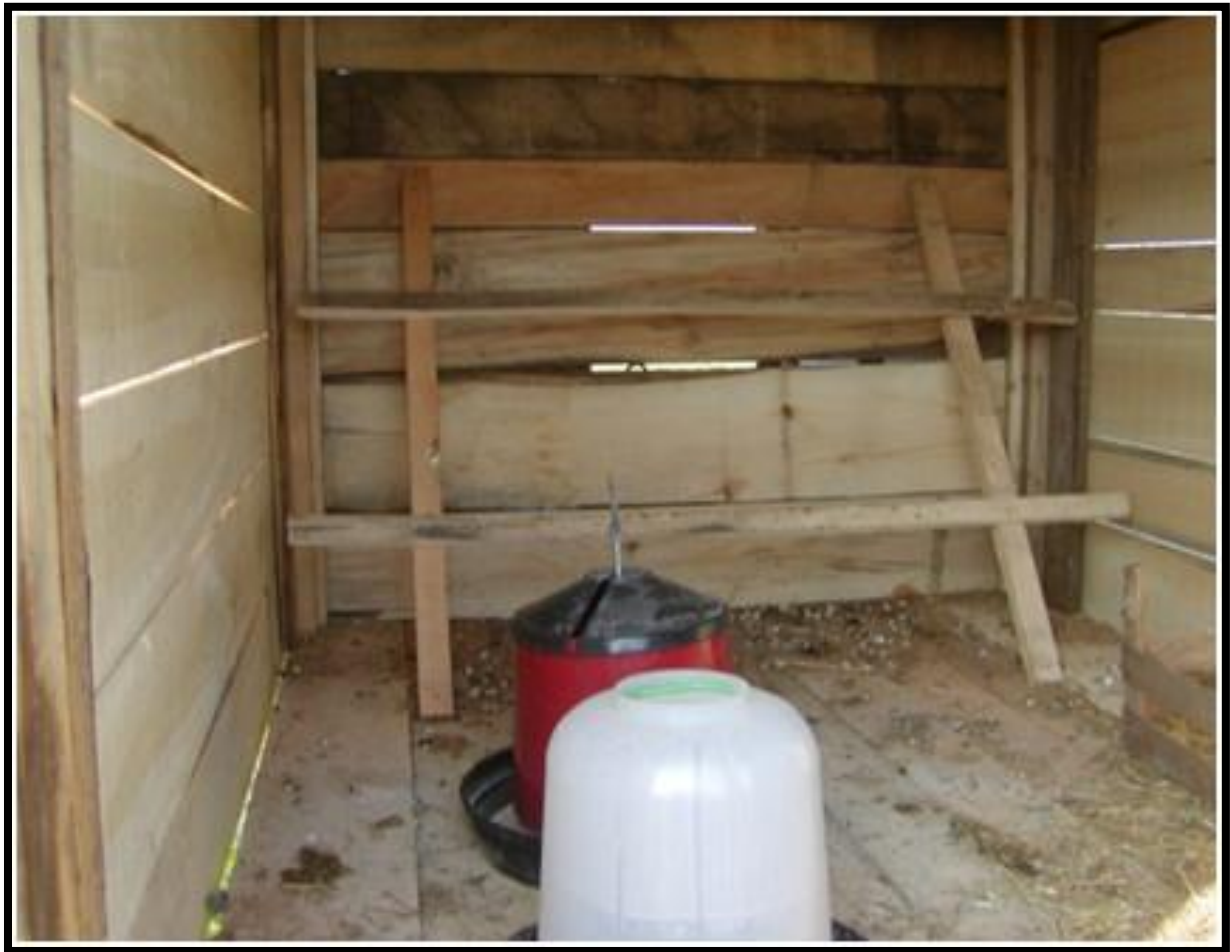
Slika 16. Objekt za smještaj

Materijali od kojih se slaže prostirka debljine sloja 10 cm su različiti, a kao najbolja se pokazala drvena hoblovina.