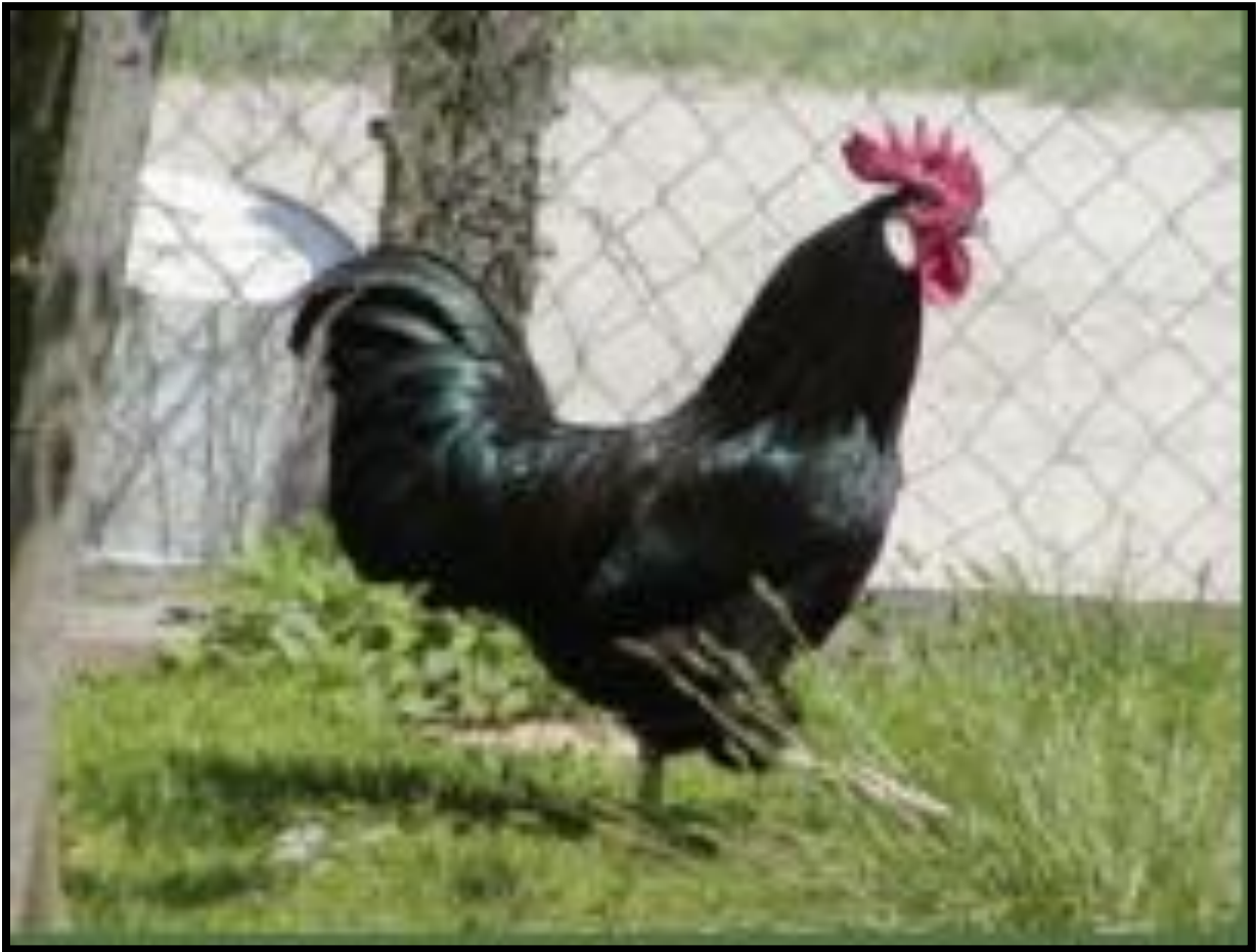
Slika 3. Kokoš hrvatica/crni soj

Razlikuje se od drugih sojeva po tome što su mu noge sivkaste boje dok ostalim sojevima su bijele boje. Također pijetao i kokoš ovog soja se ne razlikuju nego su potpuno iste boje.