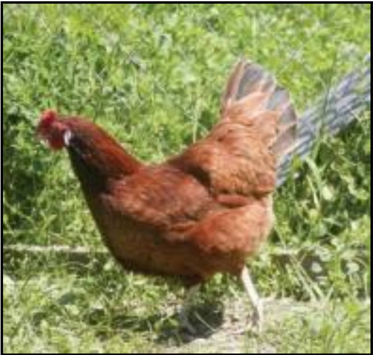
Slika 2. Kokoš hrvatica/crveni soj

Sukladno navodima HPA (2009.) pijetao i kokoš crvenog soja, najzastupljeniji su u uzgoju na malim gospodarstvima. Imaju osnovnu ciglasto-crvenu boju perja s narančasto-zlatnim vratom bez crnog crteža. Pijetao ima crni rep, metalno zelenog sjaja, dok je kod kokoši crno obojen samo vrh repa (slika 2.). Crveni soj je najzastupljeniji u ukupnom udjelu uzgoju kokoši hrvaticice u Hrvatskoj sa čak 70%.