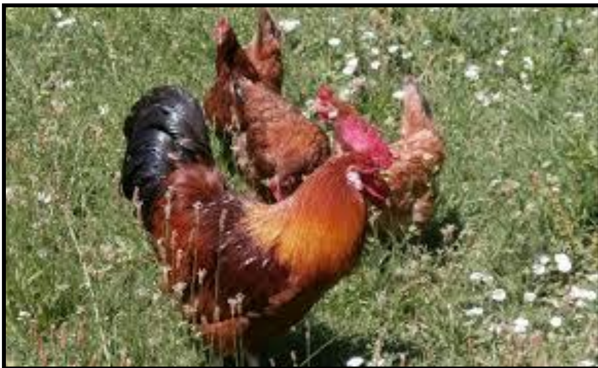
Slika 7. Kokoš hrvatica na pašnjaku

http://mystart3.dealwifi.com/search/images?fcoid=417&fcop=topnav&fpid=2&q=+doma%C4%87a+koko%C5%A1+hrvatica (20.2.2016.)