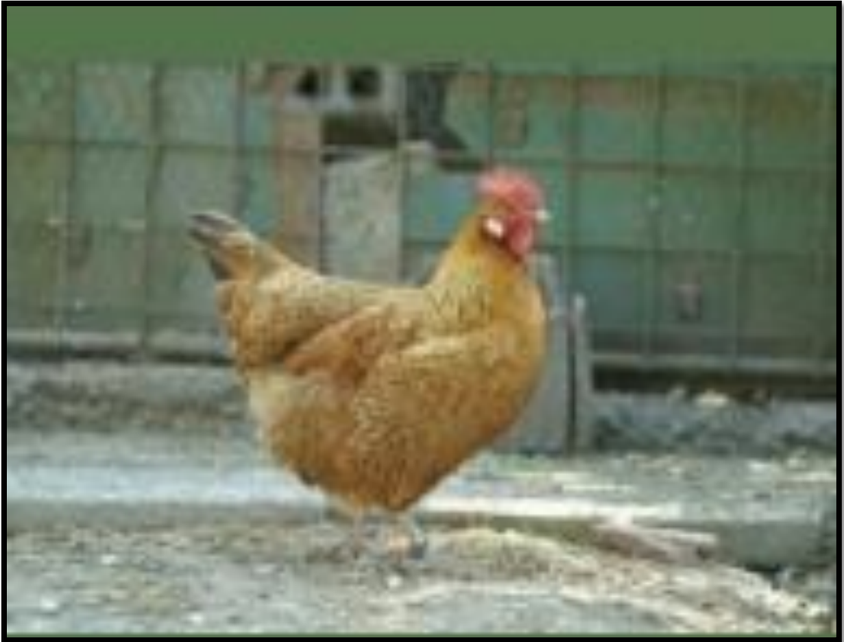
Slika 5. Kokoš hrvatica/crno-zlatni soj

Sukladno navodima HPA (2009.) pijetao crno-zlatnog soja ima narančasto zlatni vrat, leđa i zavjesu sedlišta, dok mu je ostali dio tijela pokriven crnim perjem metalno zelenog sjaja. Na slici 5 vidljivo je da kokoši imaju narančasto žut vrat, dok je ostalo perje crne boje metalno zelenog sjaja. U Hrvatskoj se najmanje uzgaja od drugih sojeva sa oko 2,1%.