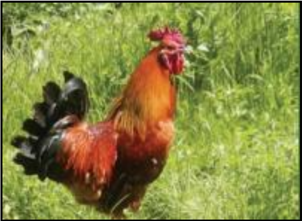
Slika 4. Kokoš hrvatica/jarebičasti soj

Jarebičasti soj je drugi po redu najzastupljeniji soj u ukupnom udjelu uzgoja kokoši hrvatice sa oko 25%.