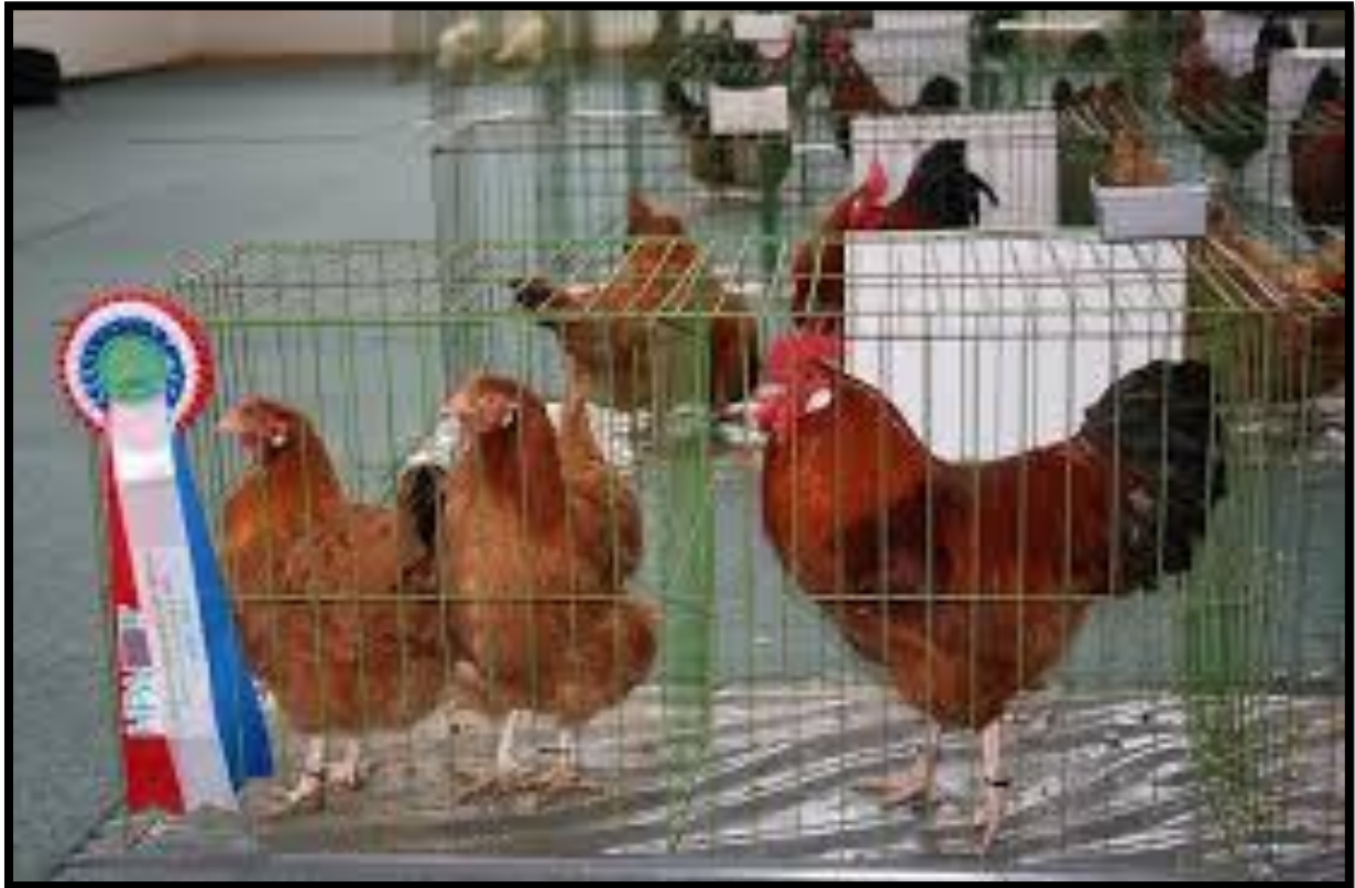
Slika 6. Kokoš hrvatica/natjecanje

U nastavku su prikazana grla kokoši hrvaticice (kokoši i pijetao) na izložbi te na pašnjaku (slike 6.,7.).