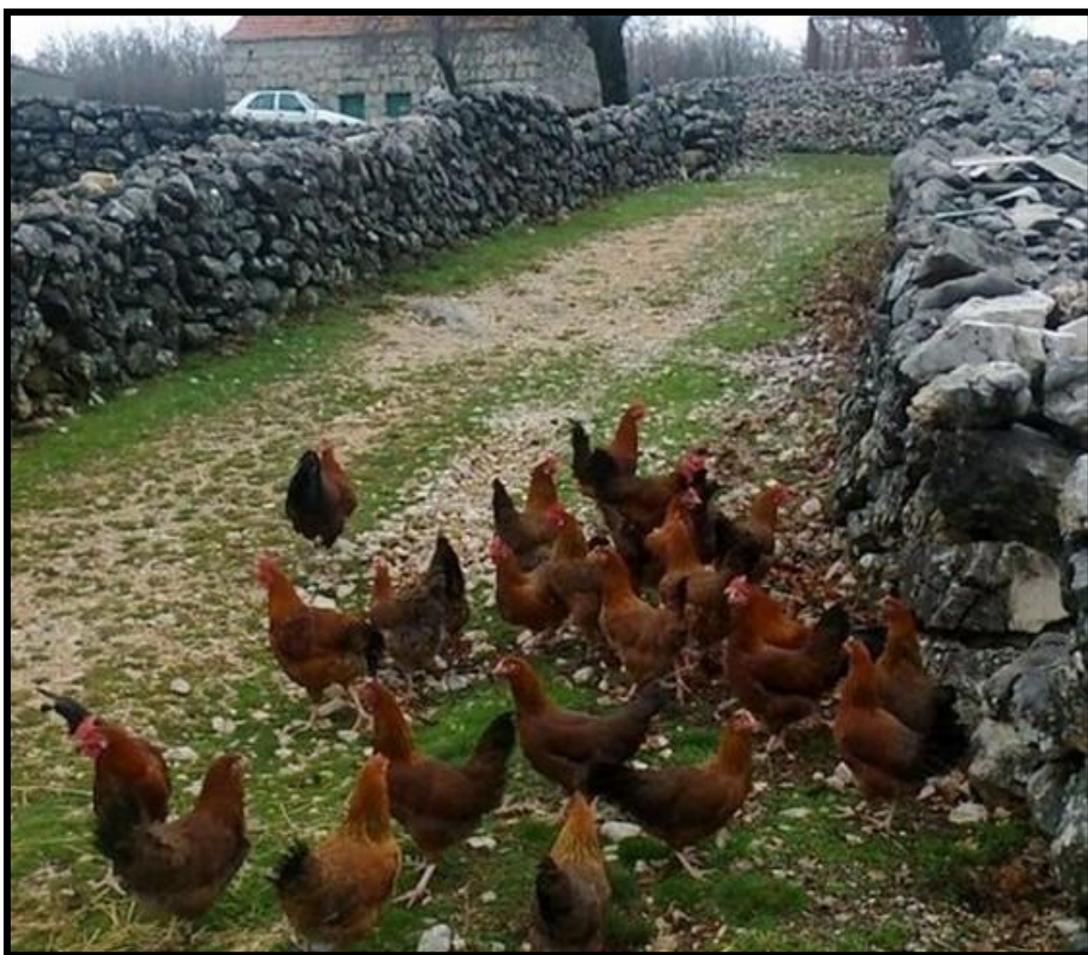
Slika 8. Kokoš hrvatica u prirodnom okruženju

Prema Janječiću (2007.) kokoš hrvatica je zbog izrazito dobre otpornosti prilagođena slobodnom sustavu držanja (slika 8.). Držanje peradi u slobodnom sustavu jedan je od najzastupljenijih alternativnih načina držanja peradi u svijetu. Omogućava uzgoj koji je u najvećoj mjeri u skladu s dobrobiti i zdravljem životinja. Dobrobit po definiciji predstavlja stanje u kojem se jedinka pokušava nositi sa svojim okolišem (Broom, 2001.)