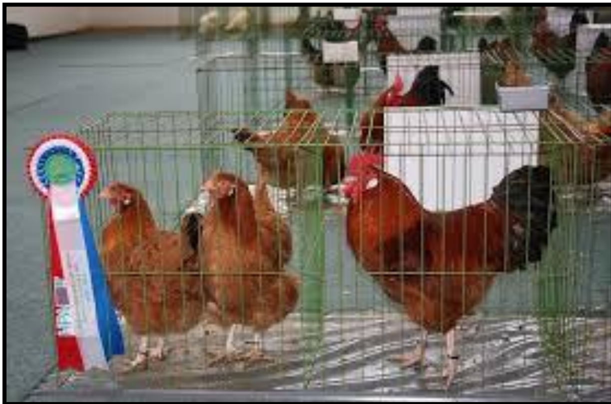
Slika 6. Kokoš hrvatica/natjecanje

U nastavku su prikazana grla kokoši hrvaticice (kokoši i pijetao) na izložbi te na pašnjaku (slike 6.,7.).