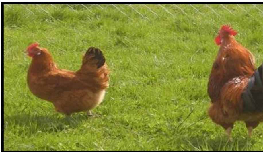
Slika 13. Kokoš hrvatica u prirodnom okruženju

Sukladno navodima HPA (2009.) sakupljanje jaja treba se vršiti svakodnevno. Jaja treba čuvati na hladnijem mjestu s prosječnom temperaturom koja ne prelazi 18°C i relativnom vlažnošću zraka oko 70%. U slučaju čuvanja rasplodnih jaja dulje od 7 dana, treba ih najmanje jednom dnevno okretati dužno za 180°.