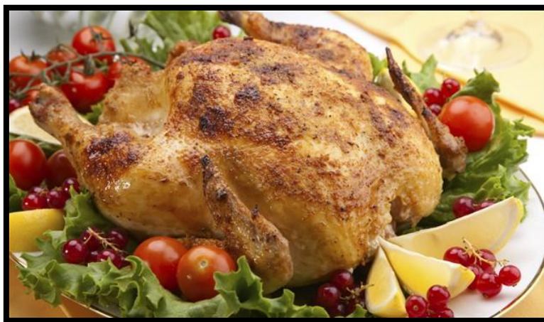
Slika 18. Meso kokoši

Držanje peradi u slobodnom sustavu jedan je od najzastupljenijih alternativnih načina držanja peradi u svijetu. Omogućava uzgoj koji je u najvećoj mjeri u skladu s dobrobiti i zdravljem životinja. Potrošači vjeruju da je meso pilića uzgajanih na otvorenom prostoru u prirodnim uvjetima „zdravije“ od mesa pilića držanih u uvjetima intenzivne proizvodnje (Fanatico,2006.) odnosno da takovo meso ima bolju kvalitetu. Kvaliteta mesa je širok pojam i ekonomski je vrlo značajan.