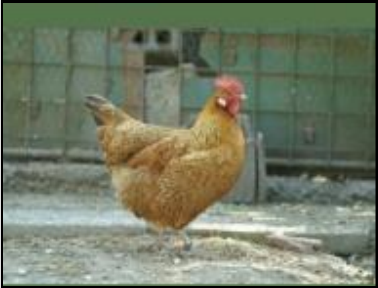
Slika 5. Kokoš hrvatica/crno-zlatni soj

Sukladno navodima HPA (2009.) pijetao crno-zlatnog soja ima narančasto zlatni vrat, leđa i zavjesu sedlišta, dok mu je ostali dio tijela pokriven crnim perjem metalno zelenog sjaja. Na slici 5 vidljivo je da kokoši imaju narančasto žut vrat, dok je ostalo perje crne boje metalno zelenog sjaja. U Hrvatskoj se najmanje uzgaja od drugih sojeva sa oko 2,1%.