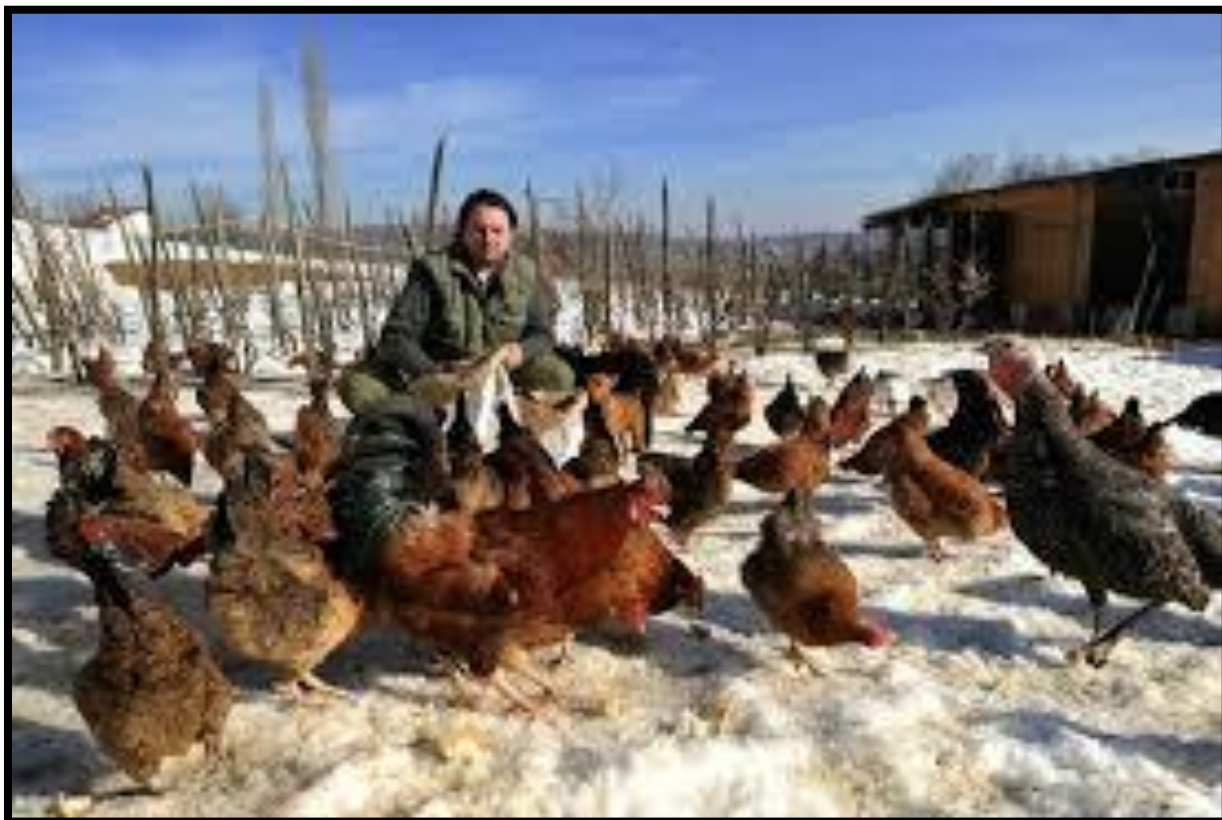
Slika 9. Kokoši hrvaticice u slobodnom uzgoju s drugom peradi

Prema Senčiću (2010.) slobodan uzgoj peradi, s korakom dalje prema organskom uzgoju temelji se na prirodnoj krmi bez primjene dodataka i sredstava za zaštitu zdravlja i održivom razvoju s prirodom. Navedeno omogućuje, uz nešto veće gubitke i cijenu, proizvodnju peradi vrlo kvalitetnih organoleptičkih svojstava, jednako mesa i jaja, a uz pravilnu i pravodobnu zaštitu zdravlja istodobno i zdravstveno ispravnu perad.