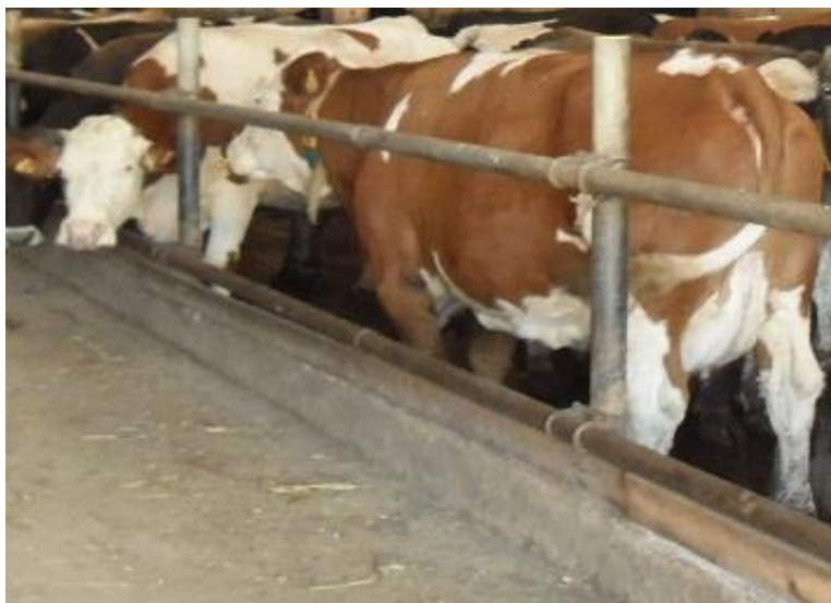
Slika 4. Pasmina Simentalac

Tjelesna masa krava je 600 - 750 kg, visine 136 - 140 cm. Prvi put se pripušta sa 16 mjeseci, a teli s 25 mjeseci. Porodna masa teladi je 40 - 45 kg. Proizvodni vijek u intenzivnom iskorištavanju traje 5 - 7 godina. Stoga je simentalska pasmina goveda računajući financijski najisplativija u dugoročnoj proizvodnji.