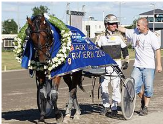
Slika 8. Pobjednik CharlottenlundRacetrack-a 2013