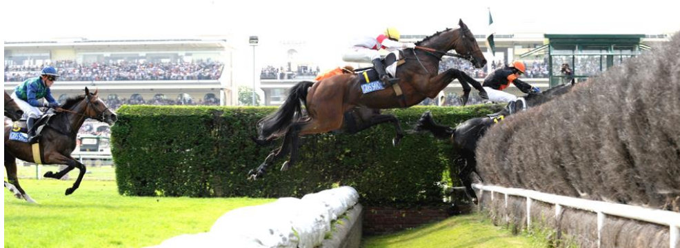
Slika 2. Speelachase preponske utrke

( http://www.france-galop.com/uploads/tx_fgpccontent/Gras_Savoie_prez_evenement__04.jpg )