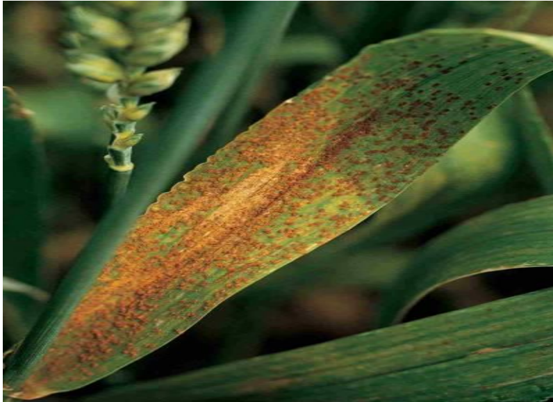
Slika 7. Puccinia recondita ( http://www.bayercropscience.ro/ )