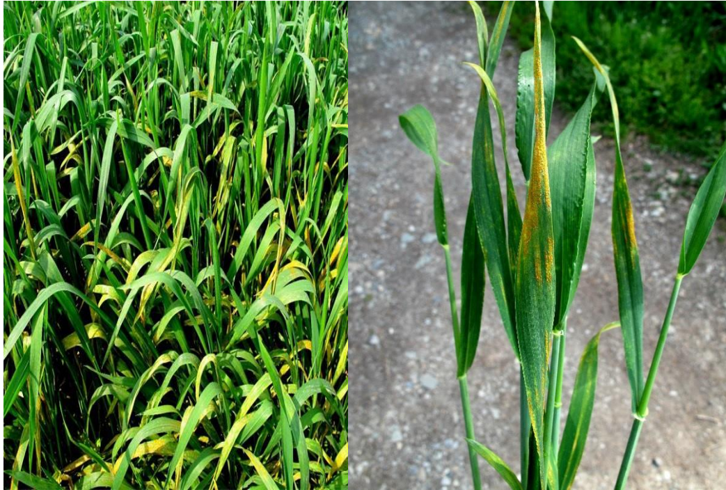
Slika 8. Puccinia striiformis