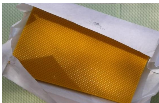
Slika 6. Ekološka satna osnova – izrađena od voska; Izvor: www.google.hr/search?q=ekološke+satne+osnove , 3.1.2016.

Jedna od najčešćih i najopasnijih bolesti pčela protiv kojih se bore pčelari dilje svijeta, jest nametnička bolest – varooza. Čiji je uzročnik grinja Varroa destructor . Odrasle jedinke