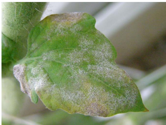
Slika 28. Prevlaka micelija na licu lista