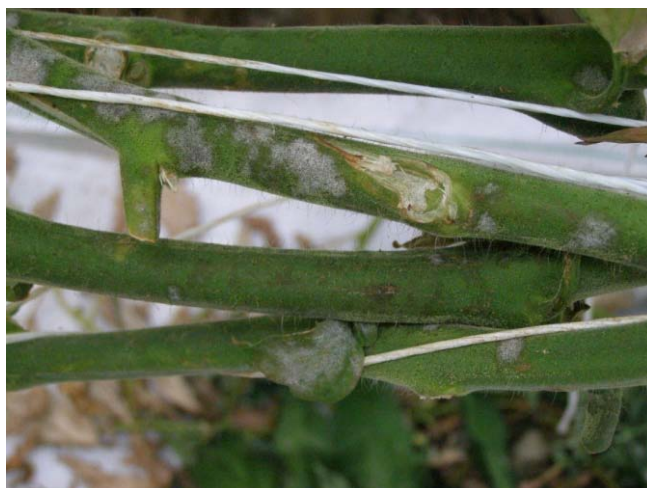
Slika 29. Prevlaka micelija na stabljici