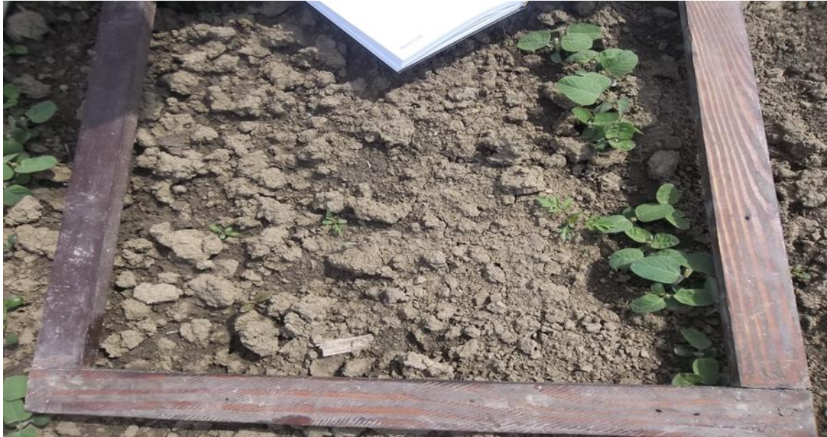
Slika 3. Prebrojavanje korova u usjevu soje