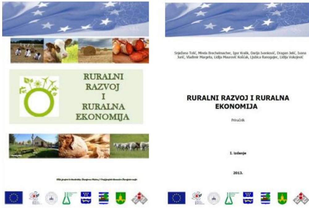
Slika 9. Naslovnica priručnika „Ruralni razvoj i ruralna ekonomija“