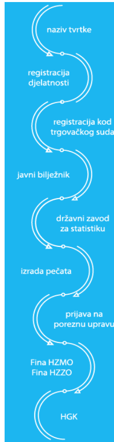
Slika 8. Osnivanje jednostavnog društva s ograničenom odgovornošću (j.d.o.o.)

visini jedne četvrtine dobiti iskazane u godišnjim financijskim izvješćima umanjene za iznos gubitka iz prethodnih godina, a za što d.o.o. nema obvezu.