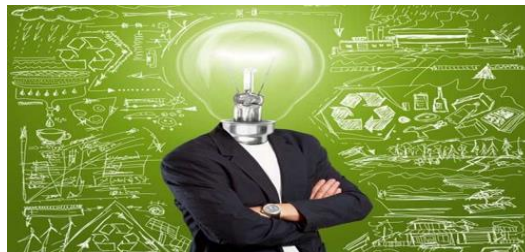
Slika 1. Izbor različitih oblika organizacije

Odluka o obliku registracije temelji se na pomnom promišljanju i savjetovanju sa stručnjacima, jer poznavanje propisa omogućit će vam njihovu primjenu u vašu korist.