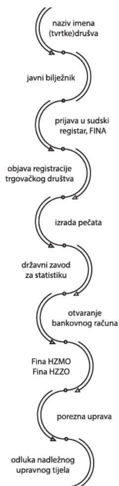
Slika 7. Osnivanje društva s ograničenom odgovornošću