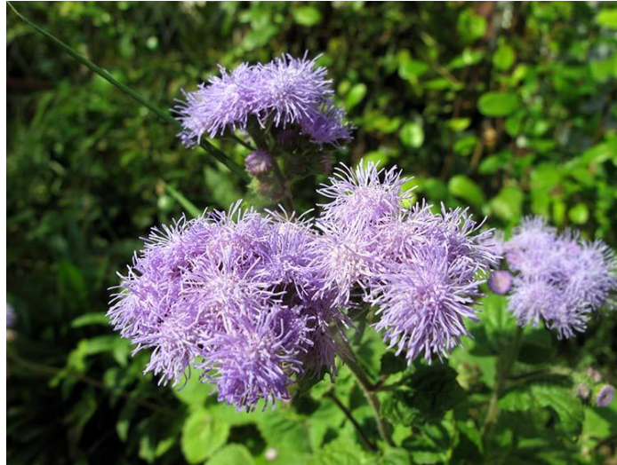
Slika 11. Ageratum houstonianum Mill.

Ima veliku popularnost jer cvjeta obilno i dugo, od svibnja pa do jeseni. Obavezno treba uklanjati uvele cvjetove kako bi se produžila cvatnja i zalijevati kada je suho vrijeme. Grmolikog je rasta i naraste do 30 centimetara (Hessayon, 1996.). Također, ima i sorti koje izrastu do 50 centimetara u obliku svilenkastih niti sljezovo-plave u pahuljastim glavicama koje se dugo drže svježim (Parađiković, 2014).