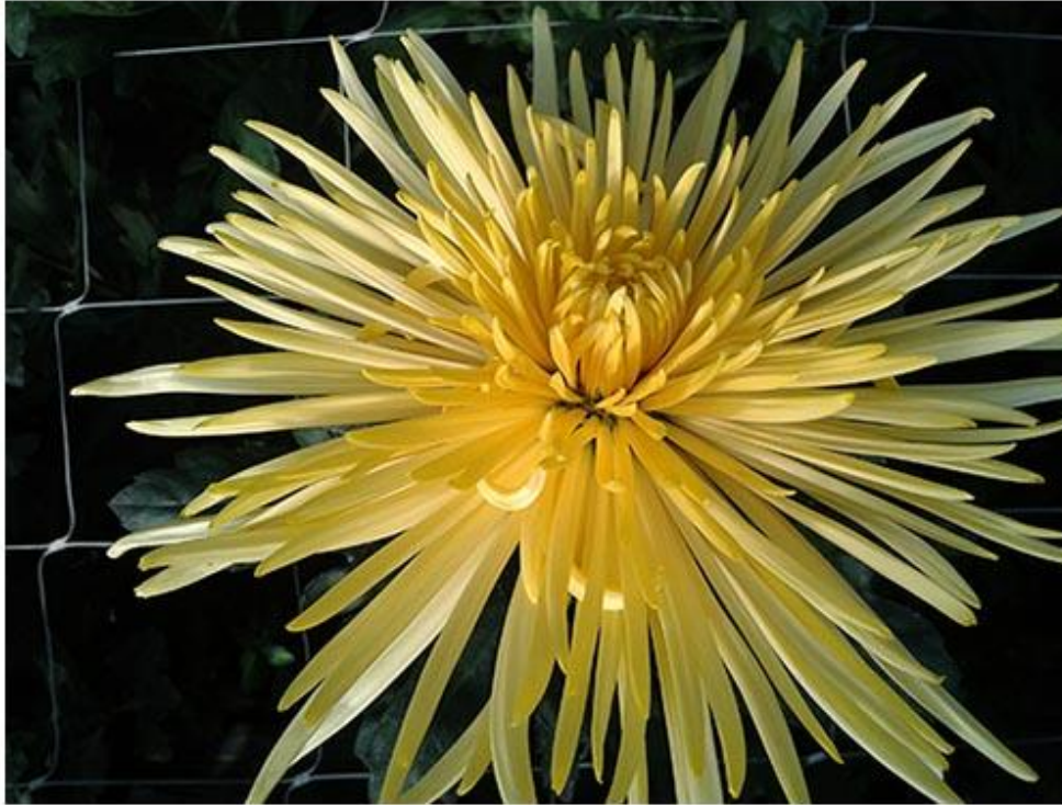
Slika 2. Žuta špina