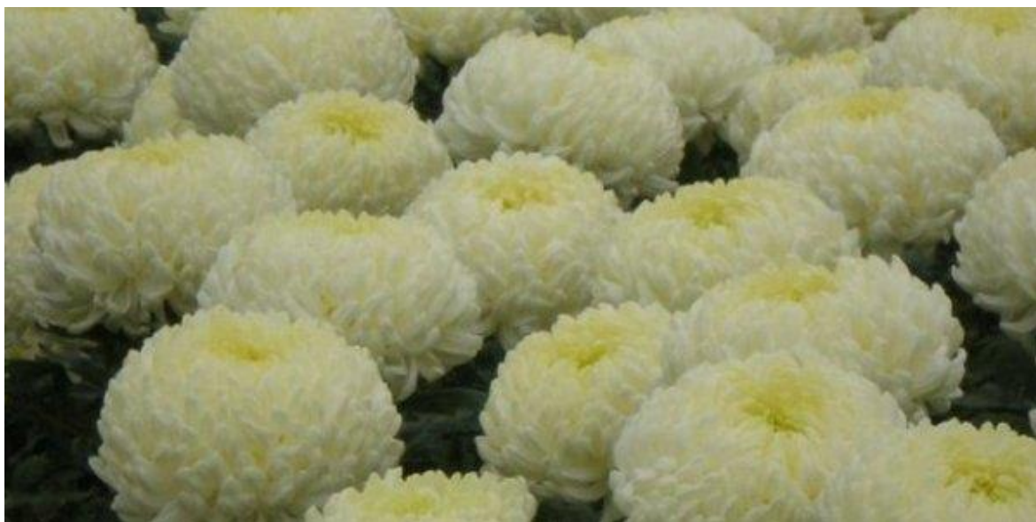
Slika 1. Bijela lopta

„ Naša kultura poznaje ovu cvjetnu vrstu kao ukras grobova za blagdan Svih Svetih. U Japanu krizantema predstavlja nacionalni cvijet, a u Kini simbol dugog života. U svjetskim razmjerima krizantema zauzima prvo mjestu u uzgoju rezanog cvijeća, ispred ruža i gerbera. Pod pojmom krizantema podrazumijevaju se tri glavne podskupine: špine ili spideri (bijeले ili žute), margarete kao skupina s najviše različitosti te krupno cvjetne krizanteme popularno nazvane Šmitovke.“ ( Citat preuzet iz rada Navodnjavanje krizantema, Bruno Zečević,2016.).