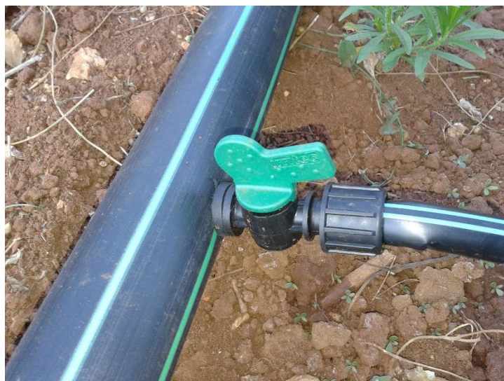
Slika 8. Alkatenska cijev za navodnjavanje