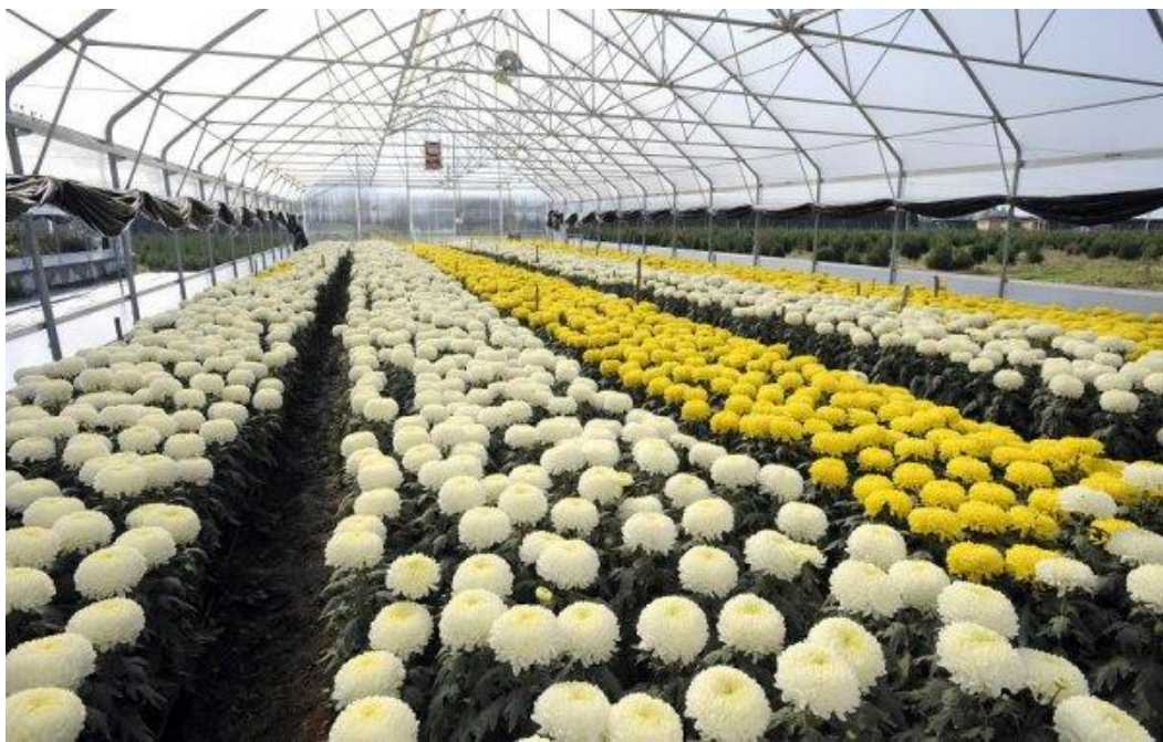
Slika 4. Dekorativne vrste krizantema za rezanje