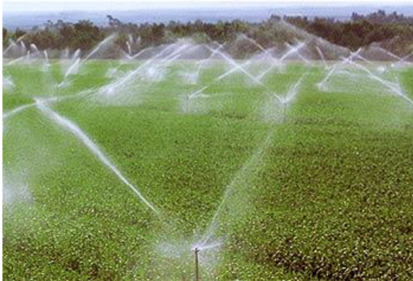
Slika 7. Navodnjavanje poljoprivrednih kultura

https://www.agroklub.com/povrcarstvo/navodnjavanje-u-povrcarstvu-na-otvorenom/178/