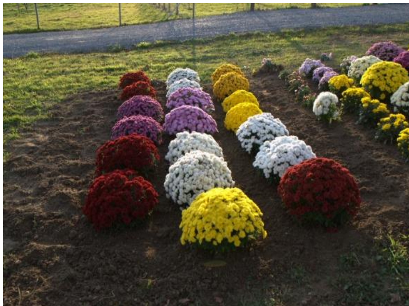
Slika 6. Krizanteme – multiflora

Lončane krizanteme se sade početkom 8.mjeseca, sadnja se obavlja u lonac promjera 25 cm, supstrat za sadnju je KLASMAN TS- 3. (www.savjetodavna.hr)