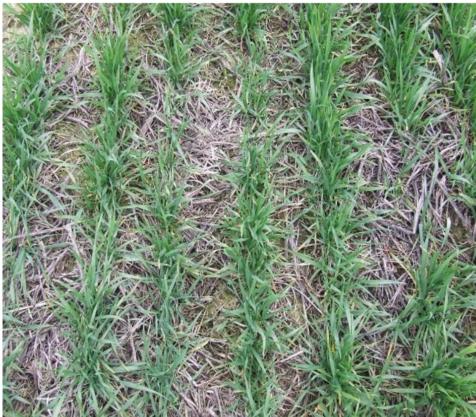
Slika 13. Pšenica - direktna sjetva