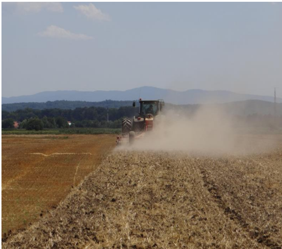
Slika 4. Prašenje strništa