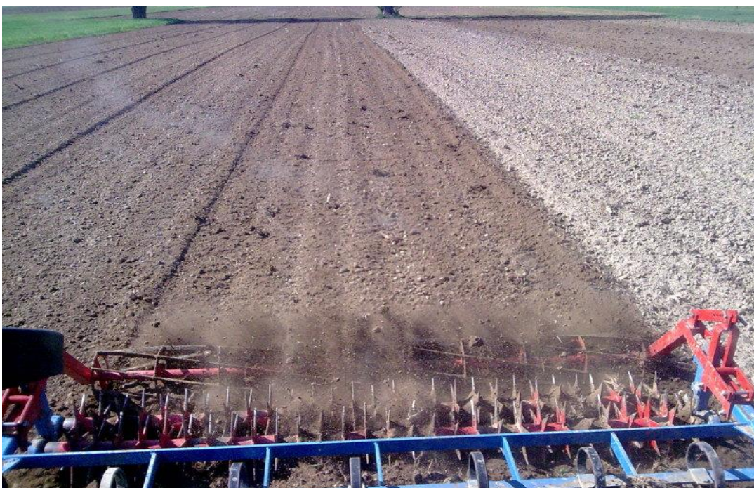
Slika 5. Prolaz sjetvospremača