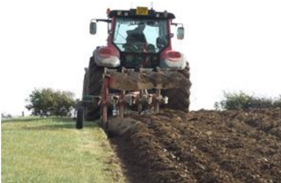
Slika 2. Tradicionalni pristup obradi - oranje