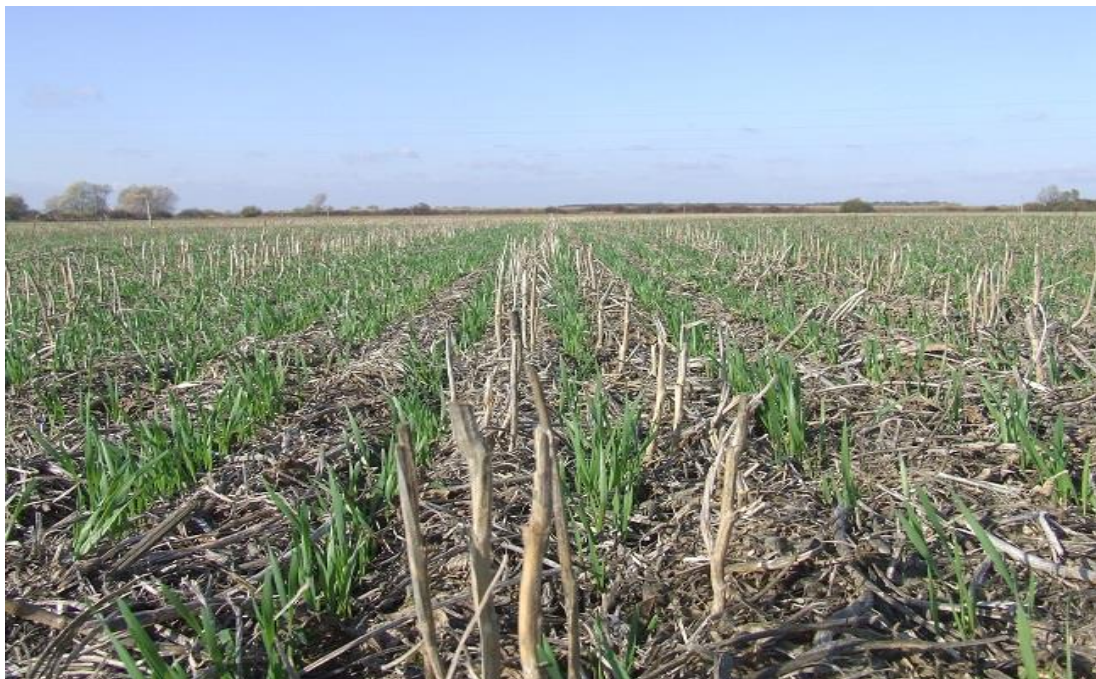
Slika 9. Konzervacijska obrada tla za ozimu pšenicu

Obrada u malč je sustav kojim se prakticira slaganje slojeva biljnog supstrata jedan na drugi. Prekrivanjem tla biljnim supstratom osiguravamo hranu mikroorganizmima, koji razgrađuju organsku tvar i tako osiguravaju hranjive tvari za ishranu bilja (Slika 10. – donji desni ugao).