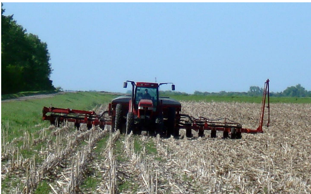
Slika 3. No-till (direktna sjetva bez obrade tla)