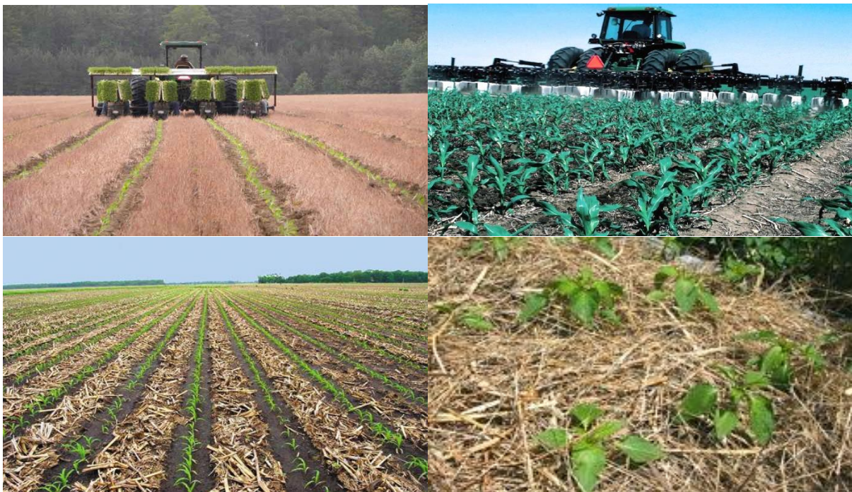
Slika 10. Oblici konzervacijske obrade tla