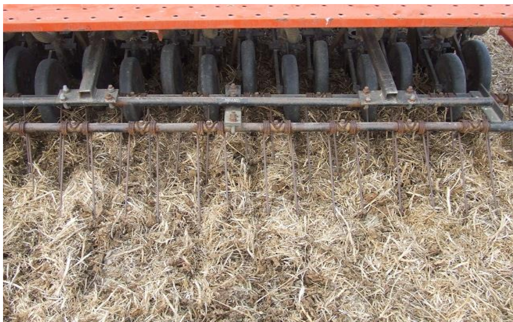
Slika 1. Sjetva pšenice u malčirano tlo