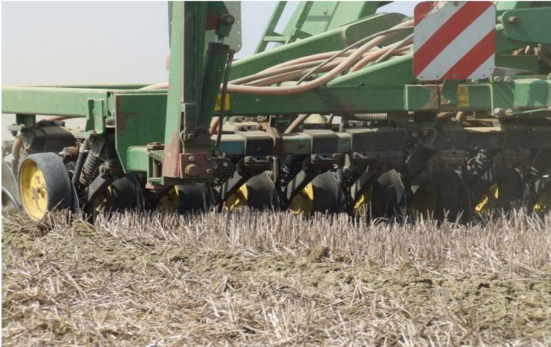
Slika 11. Sijačica za direktnu sjetvu

Uvođenje alternativnih sustava obrade tla počelo je tijekom 60-70-ih godina prošlog stoljeća (Butorac i sur., 1986.). Navedeni su primjeri gdje su se pokušali primijeniti različite dopunske obrade tla u kombinaciji sa različitom gnojidbom mineralnim gnojivima.