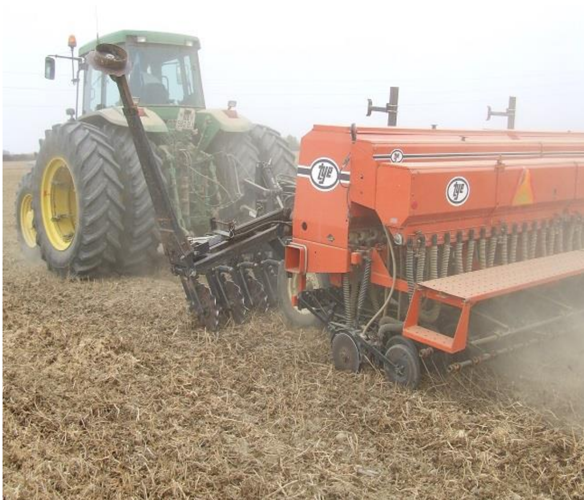
Slika 8. Sjetva pšenice u neobrađeno tlo

Iako je u svijetu već dosta zastupljena, u Europi, posebno istočnoj, još nije zadobila preveliki značaj. Predstavljene koncepcije reducirane obrade su: konzervacijska obrada, minimalna obrada, racionalna obrada i no-tillage (izostavljena obrada) (Slika 8.).