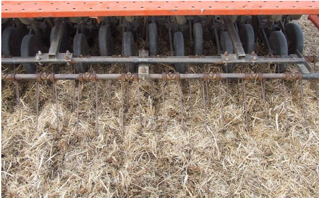
Slika 1. Sjetva pšenice u malčirano tlo