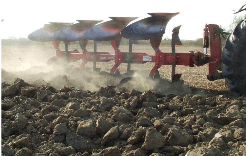
Slika 6. Zaoravanje žetvenih ostataka oranjem