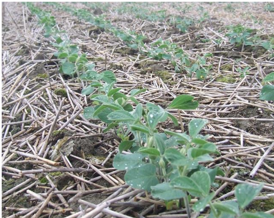
Slika 12. Soja - direktna sjetva

Ozima pšenica i soja su kulture koje dobro reagiraju na reduciranu obradu tla te bi ih se moglo proizvoditi i na taj način, odnosno ulaganja mogu biti i manja, u vidu obrade tla, dok bi se prinosi zadržali na razini konvencionalne obrade (Slika 12. Slika 13. ).