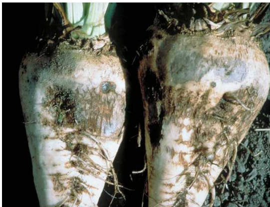
Slika 8. Smeđa trulež na korijenu repe

Gljiva koja je uzročnik bolesti živi u tlu i prezimljuje kao micelij na organskim tvarima u tlu. a njoj pogoduju visoke temperature od 25 – 30 °C. Simptomi smeđe truleži korijena vidljivi su kada je vruće i suho ljetno vrijeme. Listovi požute, a zatim se potpuno osuše i potamne. Na zaraženom korijenu, na presjeku možemo vidjeti trulo tkivo. Biljke pokušavaju stvoriti novo lišće, no do kraja sezone potpuno propadnu (Bažok i sur., 2015.).