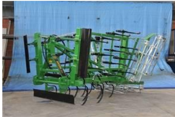
Slika 2. Sjetvospremač "PECKA"

Žetveni ostaci su se vrlo dobro zaorali pošto su prethodno usitnjeni i rašireni po površini tla. U proljeće kada se tlo prosušilo pristupilo se zatvaranju zimske brazde sjetvospremačem proizvođača "PECKA" zahvata 420 cm (Slika 2). Pred samu sjetvu na ovoj parceli su izvršili još jedan prohod sjetvospremačem i posijali suncokret.