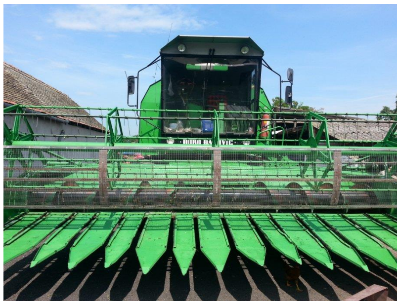
Slika 4. Kombajn za žetvu suncokreta