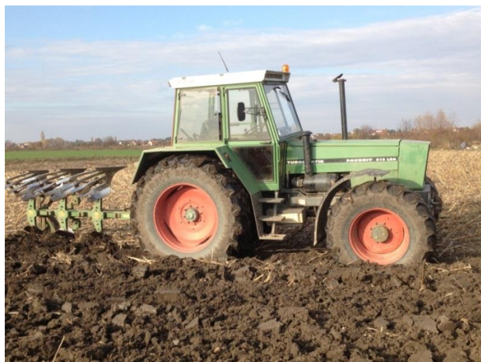
Slika 1. Oranje plugom "Eberhardt"

Na OPG-u Branimir Subotić suncokret je bio zasijan na različitim parcelama s različitim predusjevima i različitom osnovnom i dopunskom obradom tla. Tako je, na parceli na kojoj je bila predkultura kukuruz, nakon žetve obavljeno malčiranje žetvenih ostataka malčermom "IMT-618.058" zahvata 210cm. Nakon toga pristupilo se dubokom oranju u 11. mjesecu na dubinu 30-35 cm, plugom premetnjak proizvođača "Eberhardt" koji ima 3 brazde s rešetkastim daskama koje uvelike pomažu usitnjavanju i boljem slaganju brazdi (Slika 1.).