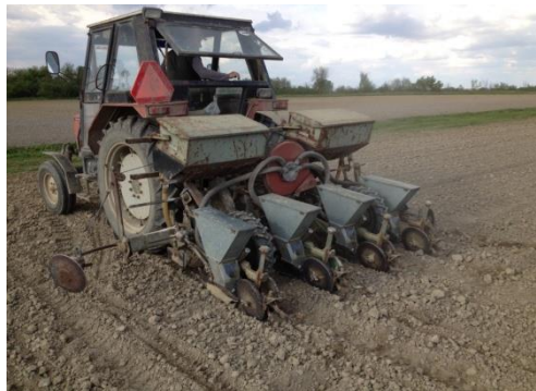
Slika 3. Sjetva suncokreta

Na OPG-u sjetva je obavljena na međuredni razmak od 70 cm te razmak u redu od 22,5 cm. Dubina sjetve je bila 5-6 cm. Ovakvom sjetvom, na ovakav međuredni razmak i razmak u redu postignuo se sklop od 58.000 biljaka/ha.