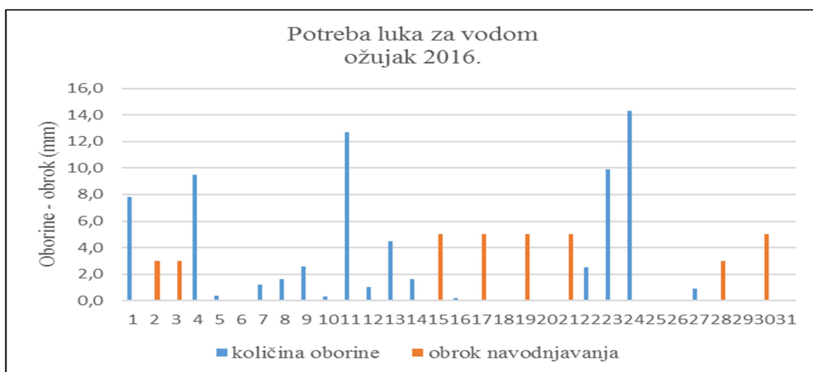
Slika 1. Oborine i navodnjavanje u ožujku 2016.

Sjetva luka je u rano proljeće kada to dopuste vremenski uvjeti. U 2016. godini sjetva luka je započela 6. ožujka. Na slici 1 slijedi prikaz registriranih količina oborina i danih obroka navodnjavanja tijekom mjeseca ožujka.