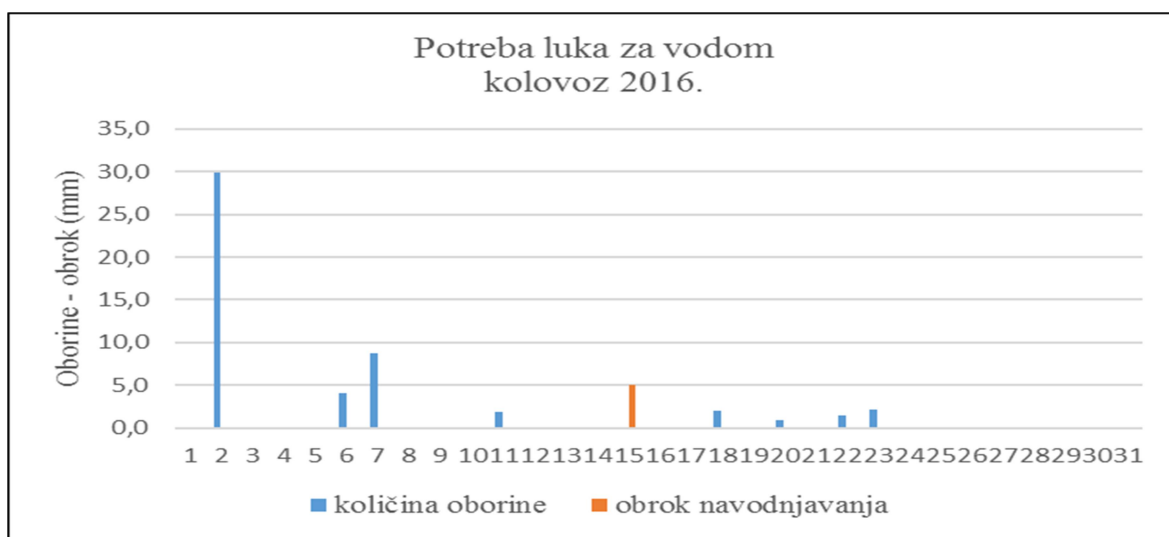
Slika 6. Oborine i navodnjavanje u kolovozu 2016.

Potreba luka za vodom se praktično završava u kolovozu jer se tada luk završava svoju vegetaciju i započinje se s vađenjem luka, ali i tada je vođena analiza oborina i navodnjavanja (Slika 6).