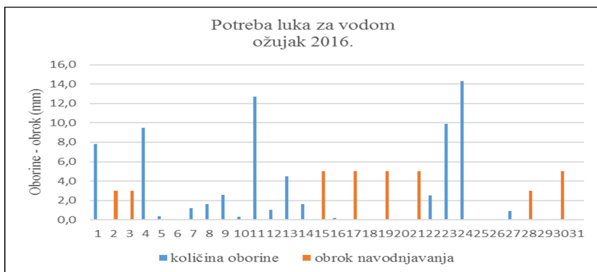
Slika 1. Oborine i navodnjavanje u ožujku 2016.

Sjetva luka je u rano proljeće kada to dopuste vremenski uvjeti. U 2016. godini sjetva luka je započela 6. ožujka. Na slici 1 slijedi prikaz registriranih količina oborina i danih obroka navodnjavanja tijekom mjeseca ožujka.