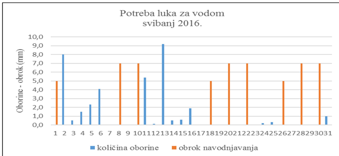
Slika 3. Oborine i navodnjavanje u svibnju 2016.

Količina oborina i obroci navodnjavanja tijekom mjeseca svibnja ukazuju na gotovo svakodnevnu manju količinu oborina do sredine mjeseca (Slika 3). Učestalije kišenje s kraja travnja (Slika 2) se nastavilo i početkom svibnja odnosno tijekom prvog dijela prve dekade u tom mjesecu.