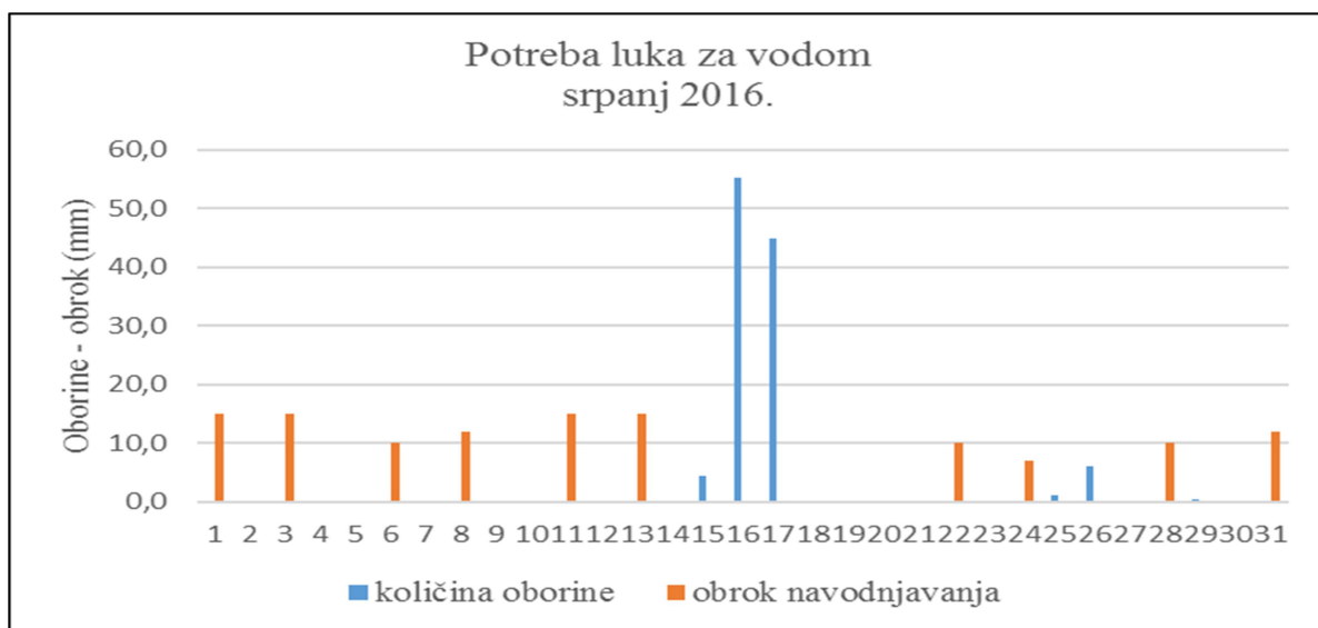
Slika 5. Oborine i navodnjavanje u srpnju 2016.

U nastavku rada biti će prikazana količina oborina i navodnjavanja kroz mjesec srpanj. Za ljetne mjesece je karakteristično suho vrijeme s povremenim jakim pljuskovima (Slika 5 ).