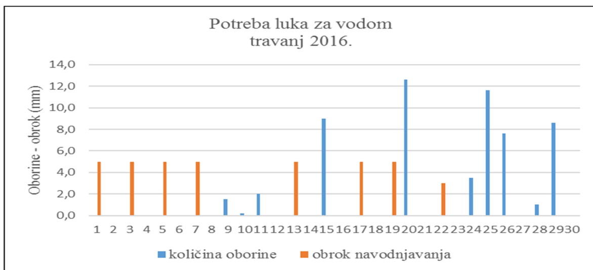
Slika 2. Oborine i navodnjavanje u travnju 2016.

U nastavku slijedi prikaz jednodnevnih količina oborina i danih obroka tijekom mjeseca travnja (Slika 2).