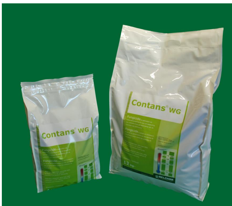
Slika 12. Preparat Contans ( http://195.98.196.121/en/distribution/belgien/ )