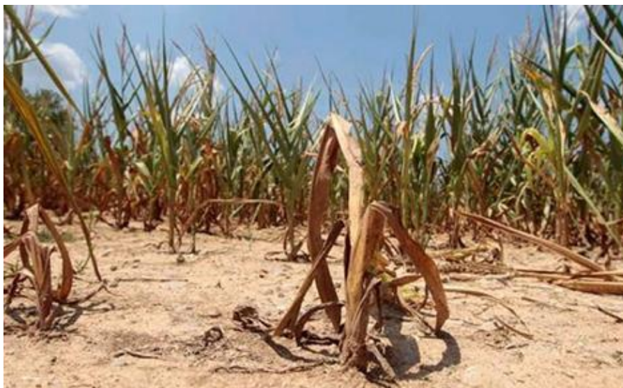
Slika 4. Posljedice suše