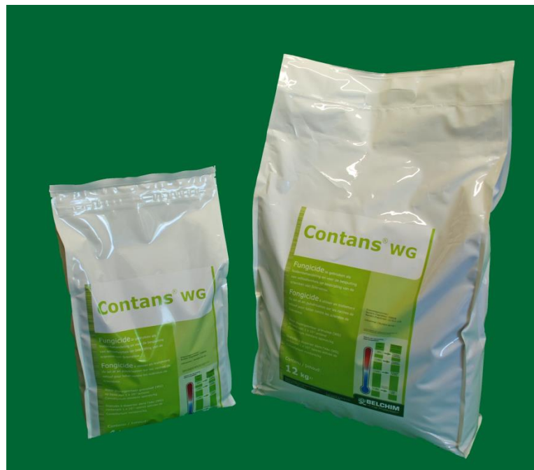
Slika 12. Preparat Contans ( http://195.98.196.121/en/distribution/belgien/ )