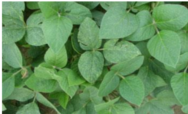
Slika 3. List soje

List soje ima četiri tipa i to su kotiledoni, jednostavni primarni listovi, troliske i trokutasti listovi- zalisci ( Slika 3.).