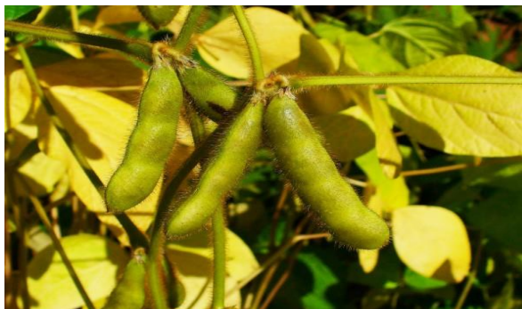
Slika 5. Mahuna soje

Plod soje je mahuna (Slika 5.) duga 3-5 cm, može biti žute, smeđe ili crne boje. Na površini je dlakava, gruba, kožasta i tvrda. U mahuni se nalaze 1-5 sjemenki. Masa 1000 sjemenki najčešće varira između 100 i 200 grama, ali može biti i u rasponu od 20- 500 grama (Vratarić i Sudarić, 2008.).