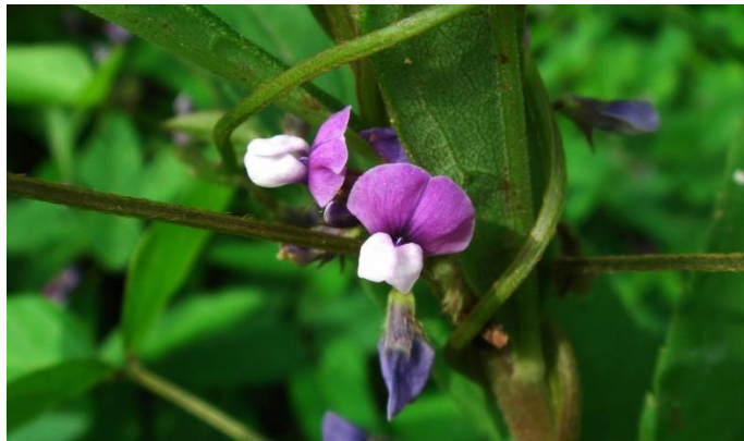
Slika 4. Cvijet soje

Cvjetovi se formiraju na svakom pazušcu lista na stabljici i granama (Slika 4.) Postoje razne boje cvjetova (bijela, ljubičasta ili kombinacija bijeloljubičaste boje). Cvjetovi su skupljeni u cvat racemozu. Cvijet se sastoji od čaške, vjenčića, tučka i deset prašnika od kojih je jedan samostalan, a ostalih devet je sraslo u jednu strukturu. Za vrijeme cvatnje u stresnim uvjetima može doći do odbacivanja cvijetova ili mahuna. Može otpasti 30-80% cvijetova ili mahuna, a najčešće opadaju 1 do 7 dana nakon cvatnje (Pospišil, 2010.).