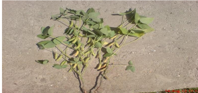
Slika 2. Stabljika soje

Stabljika je uspravna i visine uglavnom 18-120 cm (Slika 2.). Stabljika je člankovita, broj članaka kreće se od između 10 do 18, obrasla je dlačicama i zelene je boje, a ponekad može imati i jaču ljubičastu boja koju uzrokuje antocijan. Prema tipu habitusa razlikujemo indeterminirani (nedovršeni) i determinirani (dovršeni) tip rasta.