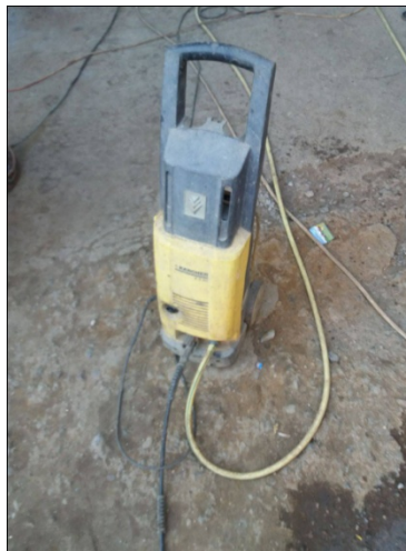
Slika 4. Visokotlačni čistač „Karcher k5“