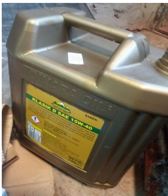
Slika 17. Novo ulje