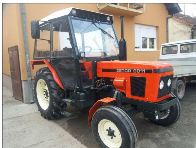
Slika 6. Traktor „ZETOR 6011“

Traktor „ZETOR 6011“, slika 6., ima četverocilindrični dizelski motor snage 44 kW/60 KS, traktor je kupljen kao polovan stroj 2010. godine.