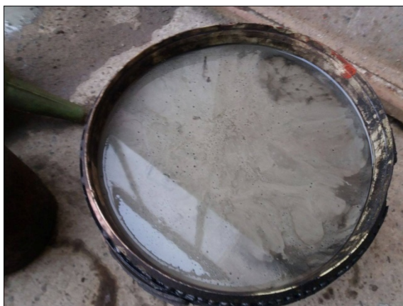
Slika 11. Ulje ispušteno iz motora