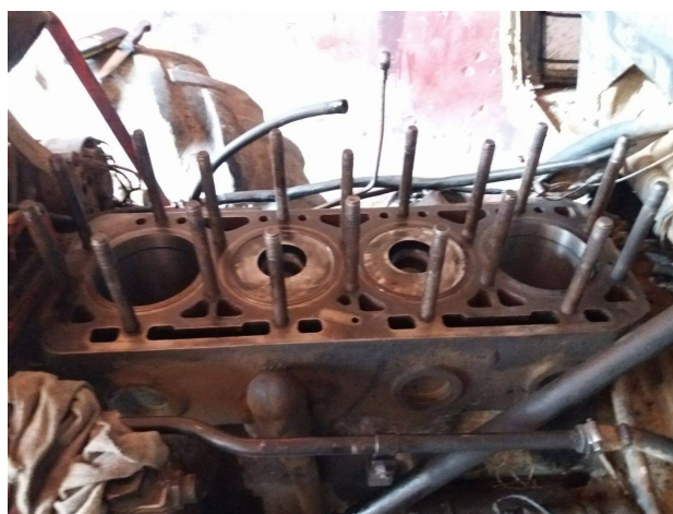
Slika 12. Skidanje glave motora i košuljica cilindara