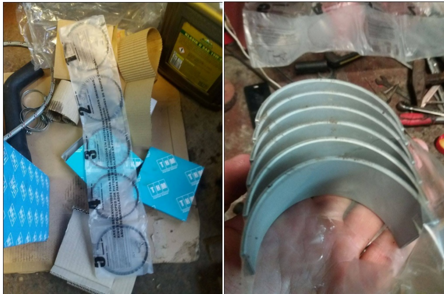
Slika 14. Novi leteći ležaji i klipni prsteni