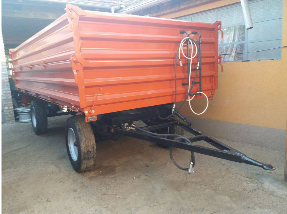
Slika 20. Završena prikolica „ZMAJ“