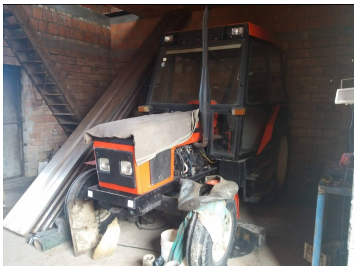
Slika 21. Garažiranje "Zetora 6011"