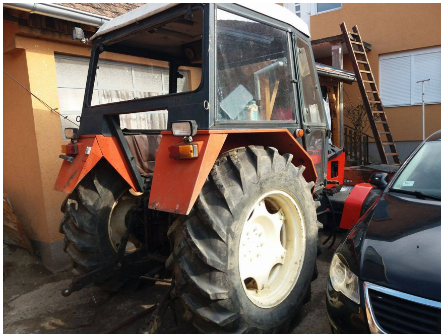
Slika 7. Traktor „ZETOR 7211“

Traktor „ZETOR 7211“, slika 7., ima četverocilindrični dizelski motor snage 51 kW/70 KS. Kupljen je kao polovan traktor 2015. godine.