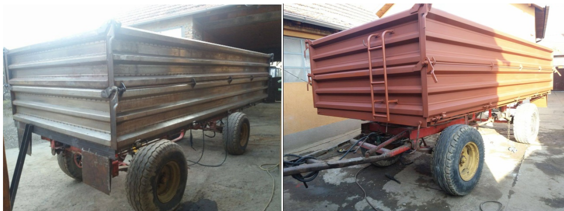
Slika 19. Prikolica „ZMAJ“ tijekom radova