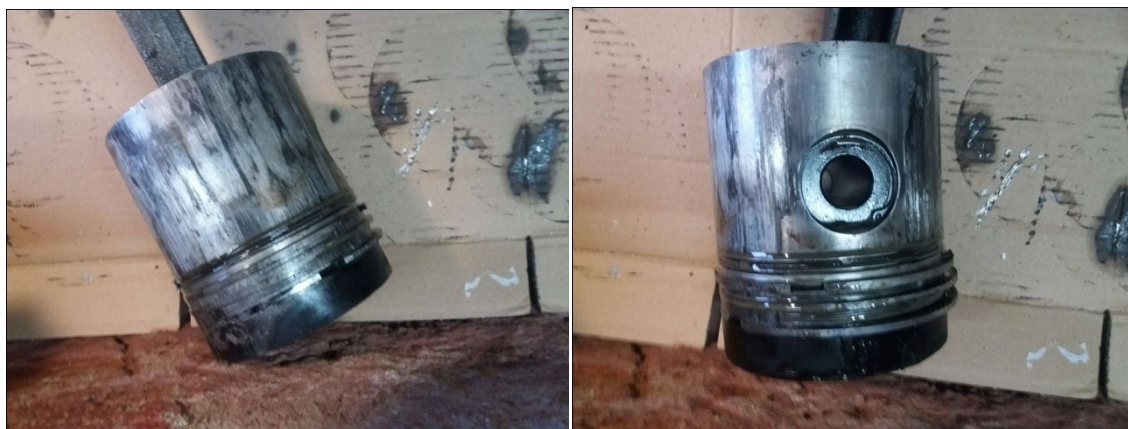
Slika 13. Oštećeni klipovi i klipni prsteni