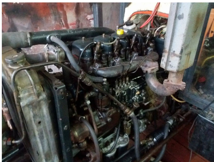
Slika 16. Motor nakon popravka