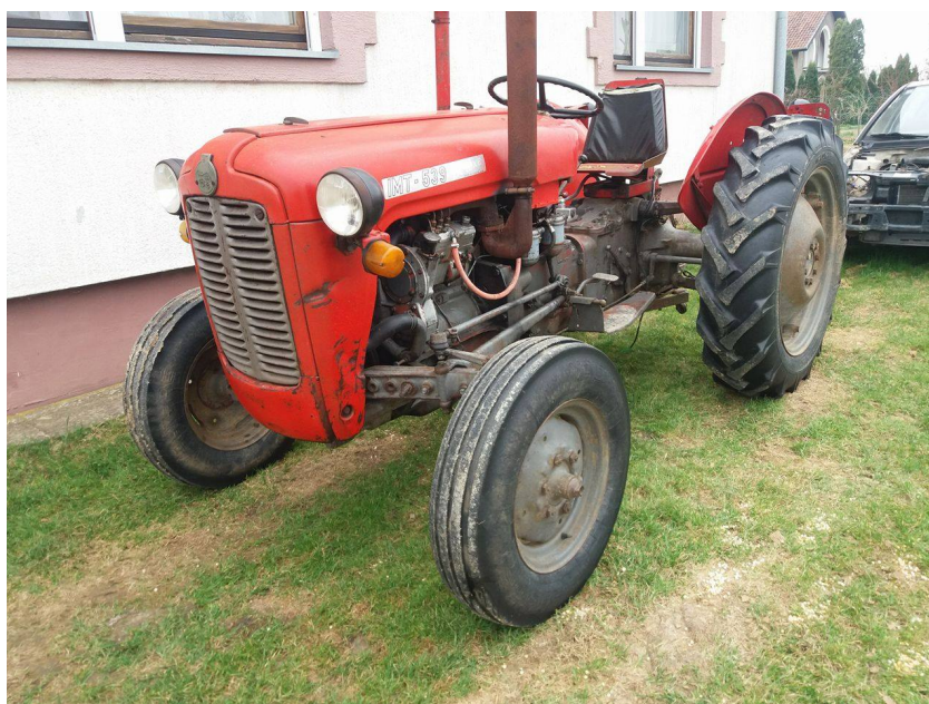
Slika 8. Traktor „IMT 539“

Traktor „IMT 539“ , slika 8., ima trocilindrični dizelski motor snage 28kW/39KS.