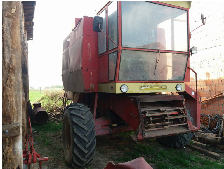
Slika 9. Kombajn „ZMAJ 142“

Kombajn „ZMAJ 142“ ,slika 9., ima šestcilindrični dizelski motor snage 81 kW/105 KS i služi za branje kukuruza, pšenice i suncokreta