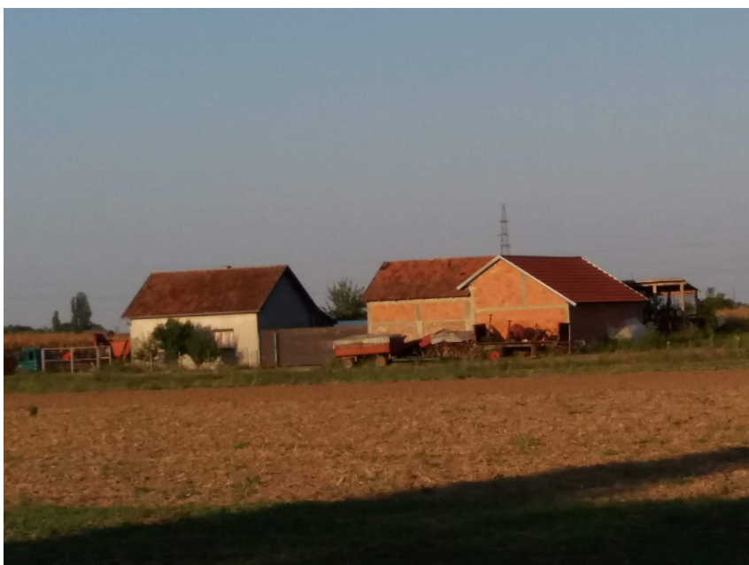
Slika 1. Slika gospodarstva

Traktor „ZETOR 8441“, slika 2., se koristi u oranju, tanjuranju i predsjetvenoj pripremi te za prijevoz tereta (prikolicama „ZMAJ“ 8t, slika 20., i kamionskom prikolicom 10t). Traktor „ZETOR 6011“, slika 3., koristi se većinom za vuču berača-komušača, međurednu obradu kultivatorom, prskanje i oranje manjih površina. Traktor „ZETOR 7211“, slika 4., služi za prijevoz tereta, pomoć pri oranju većih površina, za vuču dvorednog berača - komušača, a traktor „IMT 539“, slika 5., služi za sjestvu manjih površina, gnojidbu, kultiviranje, te pogon krunjača kukuruza.