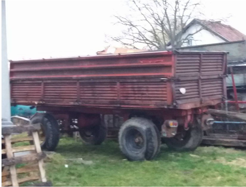
Slika 18. Prikolica „ZMAJ“ prije radova

Popravak prikolice „ZMAJ“ nosivosti 8 tona su obavili članovi gospodarstva u priručnoj radionici. Prikolica je kupljena u devastiranom stanju, korodirana, ispucala, nebojana, bez svjetlosne signalizacije i s lošim gumama, slika 18. Popravkom su na prikolicu stavljeni većinom novi dijelovi osim šasije (stavljene su nove stranice, grede, podnice, novi stupovi, naplatci i pneumatici bez zračnica koji su stabilniji na cesti, novi uređaj za kočenje, ruda i električna instalacija sa svjetlosnom signalizacijom) slika 19.