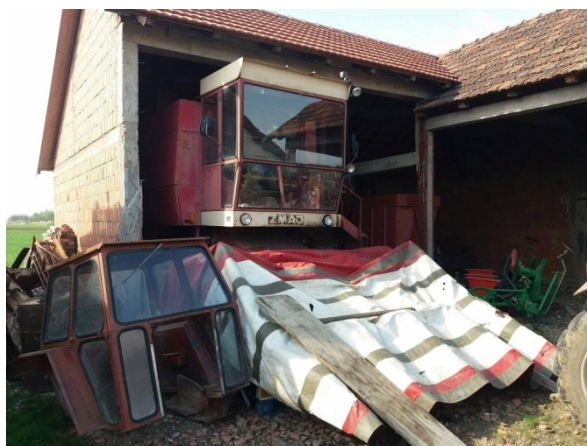
Slika 24. Garažiranje kombajna