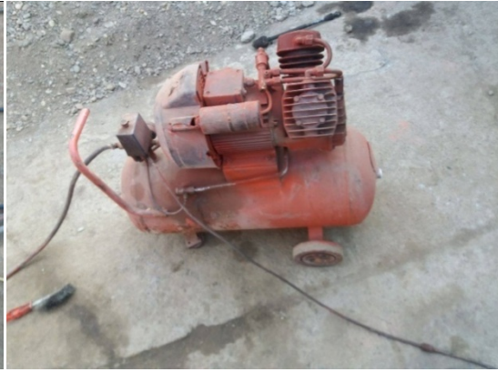
Slika 3. kompresor „Hobitool“