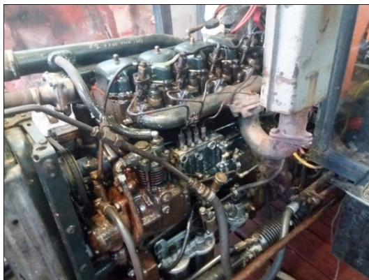
Slika 10. Motor prije rastavljanja

Novi dijelovi su ugrađeni u motor uz pomoć privatnog mehaničara, slika 16., te je u njega usuto novo motorno ulje, slika 17., nakon čega je motor pušten u probni rad 2 sata.