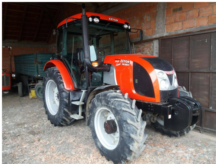
Slika 5. Traktor „Zetor Proxima 8441“

Traktor „ZETOR Proxima 8441“, slika 5., ima četverocilindrični dizelski motor snage 66 kW/90 KS. Proizveden je 2008. godine, a kupljen je 2014. godine kao polovan i trenutno je odradio malo manje od 4000 radnih sati.