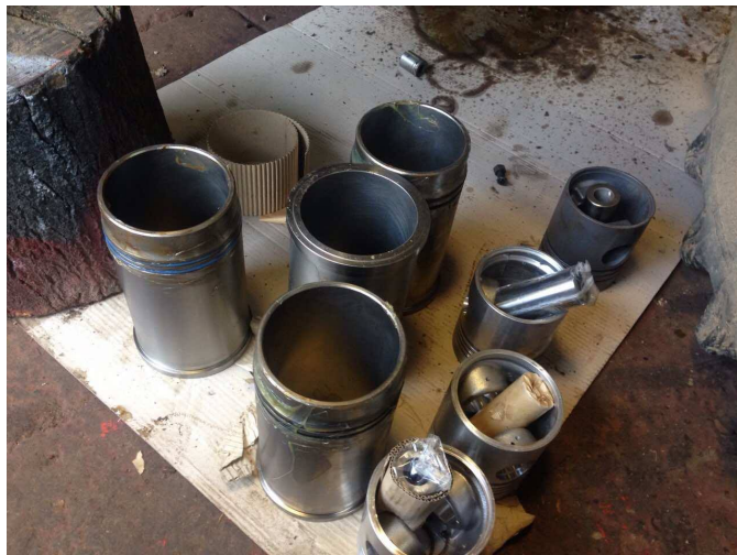
Slika 15. Novi klipovi i košuljice cilindara