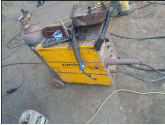
Slika 2. „Varstroj 160“