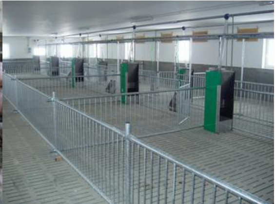
Slika 17. Čekalište

Izvor: ( https://www.butobu.rs/details/light/index.php?r=1950&usr=greengroup&naslov=Svinjogojstvo ) 02.07.2017.