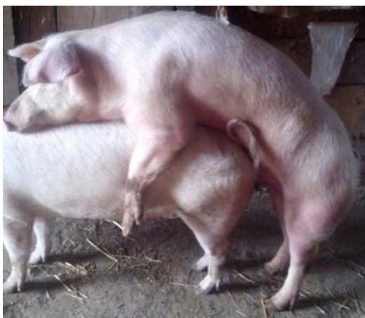
Slika 11. Pojedinačni pripust

2. Pojedinačni pripust - nerast se pripušta na krmaču koja je spremna za oplodnju. Ono zahtijeva malo više pažnje, ali je puno bolji od grupnog pripusta jer se točno zna koja je krmača, kada i kojim nerastom osjemenjena.