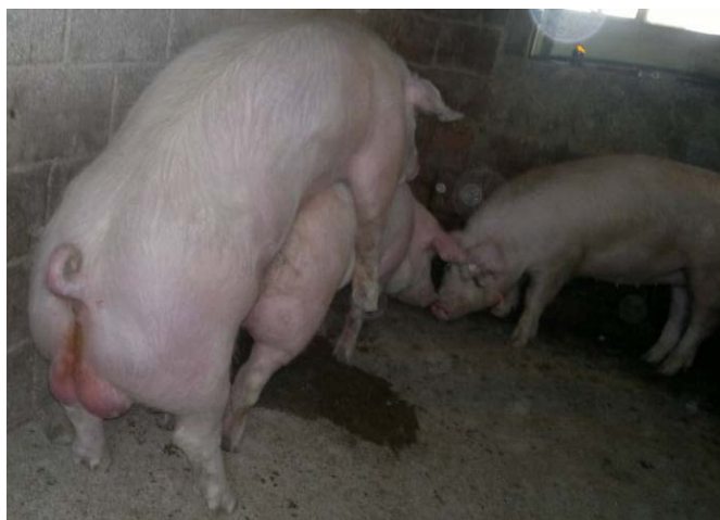
Slika 10. Grupni pripust