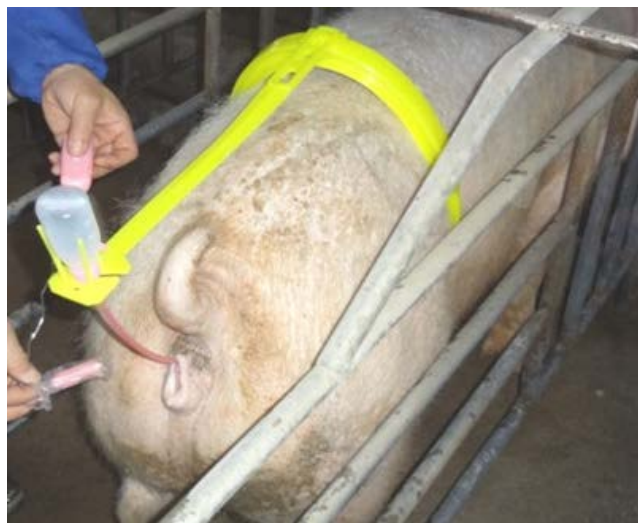
Slika 13. Umjetno osjemenjivanje

Izvor: ( https://www.alibaba.com/product-detail/Jiangs-Artificial-Insemination-Pigs-Framing_1725938662.html ) 18.06.2017.