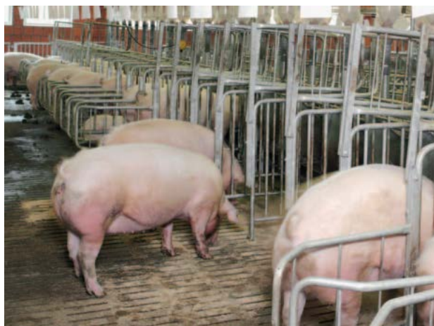
Slika 15. Grupno držanje sa pojedinačnim uklještenjem

Izvor: ( https://cdn.bigdutchman.hr/fileadmin/content/pig/products/hr/Svinjogojstvo-Drzanje-krmaca-Big-Dutchman-hr.pdf ) 02.07.2017.