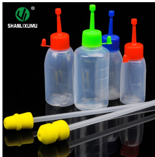
Slika 12. Bočica s kateterom za umjetno osjemenjivanje

Za proces umjetnog osjemenjivanja potrebna je bočica s razrijeđenim sjemenom i kateter za umjetno osjemenjivanje za jednokratnu ili višekratnu upotrebu. Kateter je cjevčica koja je napravljena od tvrde gume, dužine 45-55 cm, a na jednom kraju završava poput svrdla (kateter po Merloseu) ili olive (kateter po Šimuniću).