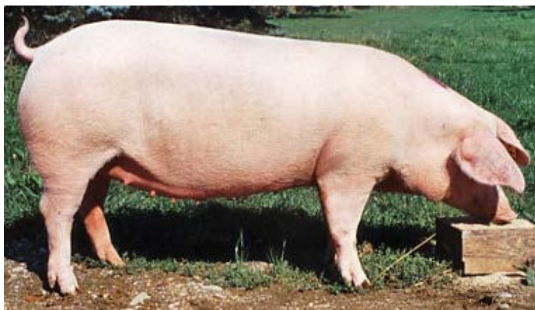
Slika 5. Landrasi (Landrace)

Spolno su zrele sa oko 7 mjeseci starosti, a krmače iz ove pasmine se najčešće pare sa nerastima velikog jorkšira. U odnosu na velikog jorkšira malo su osjetljiviji na industrijske uvjete proizvodnje, ali svejedno postižu dobre proizvodne rezultate u tovu. Dnevni prirast se kreće između 600 i 650 grama u tovu, a konverzija hrane između 3,4 -3,6 kg u normalnim uvjetima tova.