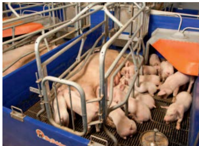
Slika 18. Klasični boks sa plastičnim rešetkastim podom i grijanim pokrovom za odojke

1. Klasični ili standardni boks – dužine su od 200 do 220 cm i širine 160 cm. Imaju dva dijela, u prvom je smještena krmača, a u drugom prasci. Prasci se slobodno kreću po cijelom boksu, a krmača je uklještena i boravi samo u srednjem dijelu boksa. Srednji dio napravljen je od metalnih cijevi koji imaju razmak od 20 cm. Hranilica i pojilica za krmaču su u prednjem dijelu boksa, a hranilica i pojilica za prasce su u postranom dijelu boksa.