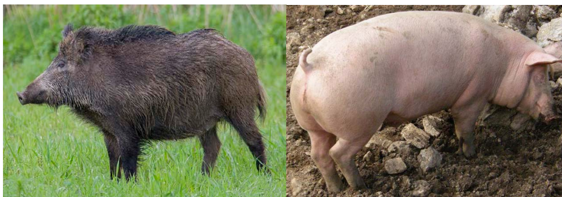
Slika 1. „ Sus scrofa “

Dva su izvorna oblika iz kojih potječu svinje, a to su: „ Sus vittatus “ ili azijska divlja svinja i „ Sus scrofa ferus “ ili europska divlja svinja. Sve europske primitivne pasmine potječu od europske divlje svinje. Podjela pasmina svinja je prema različitim svojstvima, a podjele koje su najčešće su prema stupnju oplemenjivanja i prema proizvodnom tipu.