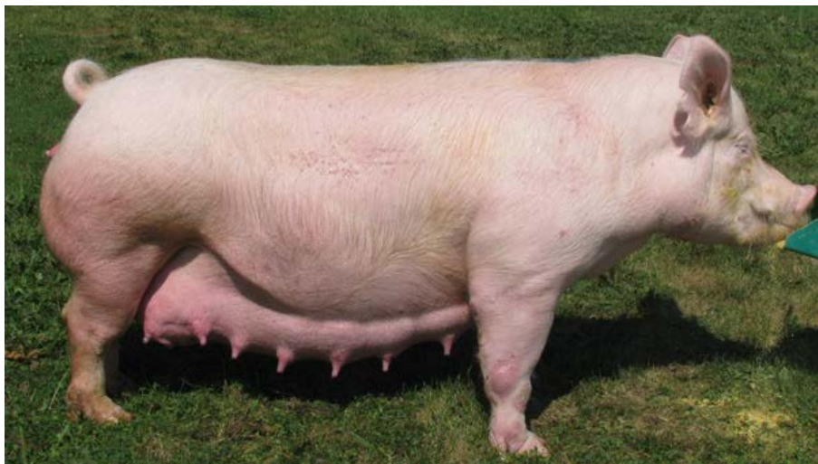
Slika 4. Veliki Jorkšir „Yorkshire, Large white“

Osim dobre mesnatosti ova pasmina je uglavnom otporna na stresne činitelje u odnosu na druge plemenite pasmine svinja, te ima dobra svojstva kakvoće mesa i snažnu konstituciju. Zbog te konstitucije i dobre plodnosti, ova pasmina se koristi u stvaranju križanih krmača F1 (prve) generacije.