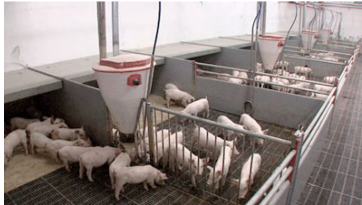
Slika 20. Kavezni način uzgoja sa djelomično rešetkastim podom

Zadnjih godina najbolje ocjene dobijaju boksovi sa djelomično rešetkastim podovima. Puni dio poda obavezno ima podno grijanje i služi za duže ležanje prasadi. Kavezi sa potpuno rešetkastim podovima se najviše koriste u praksi.