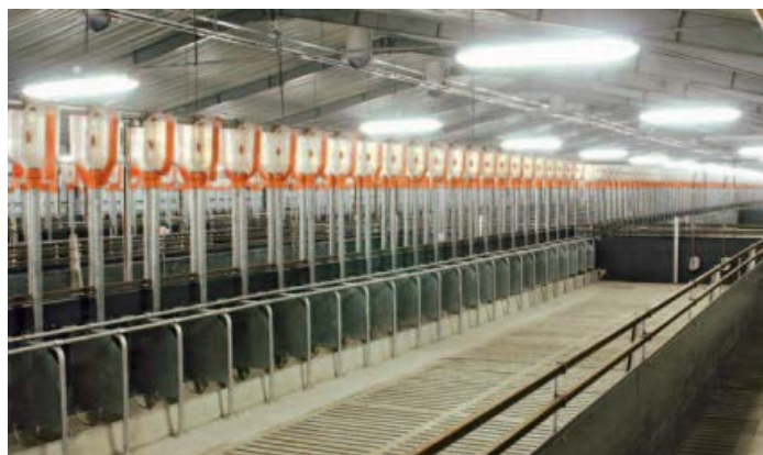
Slika 14. Grupno držanje sa rešetkastim podom

Više je zastupljeno skupno držanje plotkinja jer se kod tog načina brže i bolje uočavaju znakovi estrusa nego kod individualnog držanja u boksovima. U individualne boksove se odvajaju i osjemenjuju krmače kod kojih se uoče znakovi estrusa. Kod individualnog načina držanja prednost je u tome što se krmače mogu hraniti odvojeno prema njihovoj kondiciji.