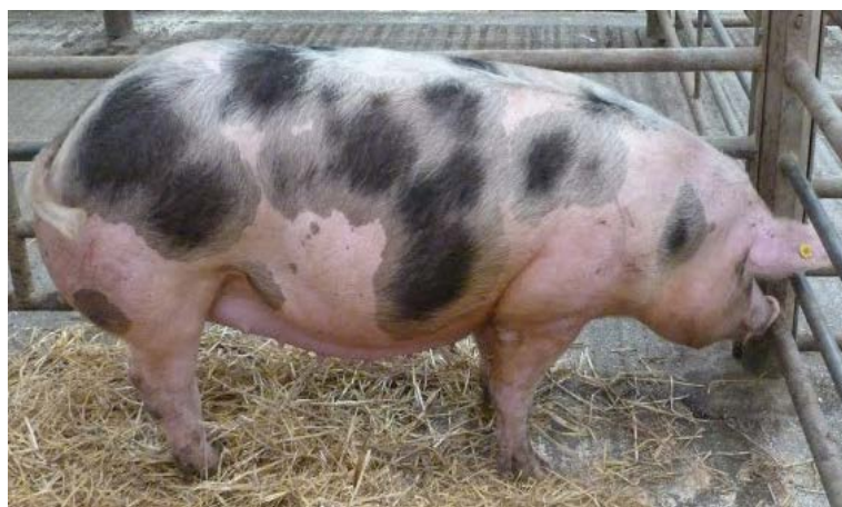
Slika 6. Pietren (Pietrain)

Dnevni prirast je nešto manji u tovu, a konverzija hrane veća (10 – 20%). Nerasti i odrasle krmače su nešto lakši od odraslih grla bijelih pasmina svinja, a spolnu zrelost dostižu puno ranije i estrus je vrlo izražen. To predstavlja ozbiljan problem u tovu jer rast grla usporava sa negdje oko 80 kg tjelesne mase.