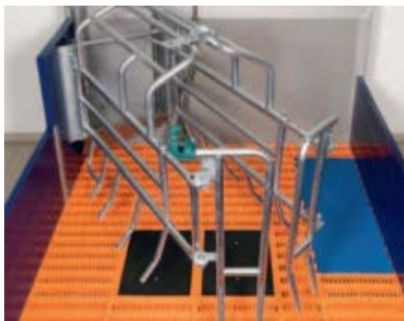
Slika 19. Dijagonalno uklještenje

2. Dijagonalni boks – u boksu ovog tipa uklještenje je postavljeno dijagonalno u odnosu na stranice boksa. Smještajni prostor se ovim načinom izvedbe boksa štedi i do 30 %, a prasad se mora odbiti do dobi od 5 tjedana. Razlika u odnosu na klasični boks je u tome što je kod dijagonalnog boksa uklještenje postavljeno dijagonalno, a svi ostali elementi su isti kao i u klasičnom boksu.