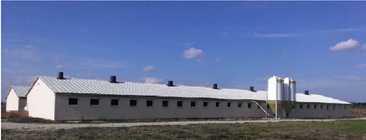
Slika 3. Primjer farme za držanje svinja