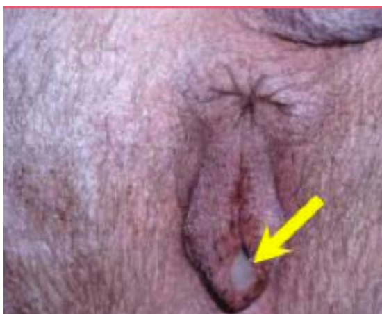
Slika 9. Iscjedak iz spolnog organa