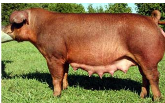
Slika 7. Durok (Duroc)

Karakteristika ove pasmine je manji obujam ejakulata uz povećanu koncentraciju spermatozoida o čemu se pri korištenju za umjetno osjemenjivanje mora voditi računa. Neujednačene je plodnosti koja se kreće od 8 do 12 prasadi u leglu kojoj je često posljedica način držanja, ali većinom dobre plodnosti (10 i više prasadi). Prasad dobro preživljava do odbića od sise pa i kasnije. Zadovoljavajuće su, pa čak i vrlo dobre brzine porasta u tovu i indeksa konverzije hrane, ali kvaliteta polutki nije posebno atraktivna. Durok je u odnosu na bijele pasmine svinja manje osjetljiv na sunčevo zračenje zbog pigmentirane boje kože i dlake pa je time pogodniji za sustav držanja na otvorenom kod ljudi koji se bave takvom vrstom proizvodnje.