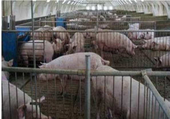
Slika 16. Čekalište