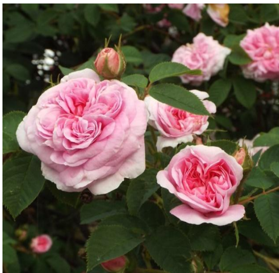
Slika 19. Ruža, Rosa x alba L.