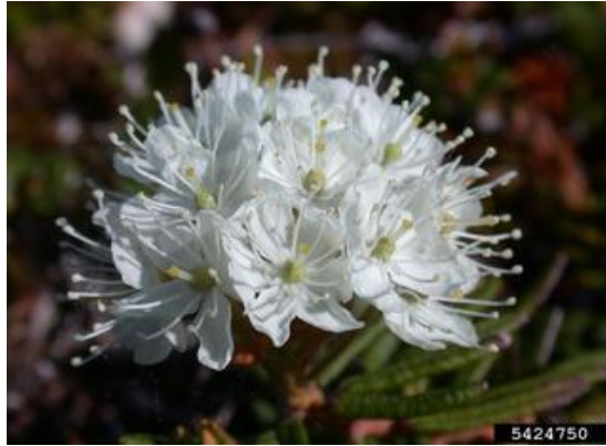
Slika 2. Divlji ružmarin, Ledum palustre L.