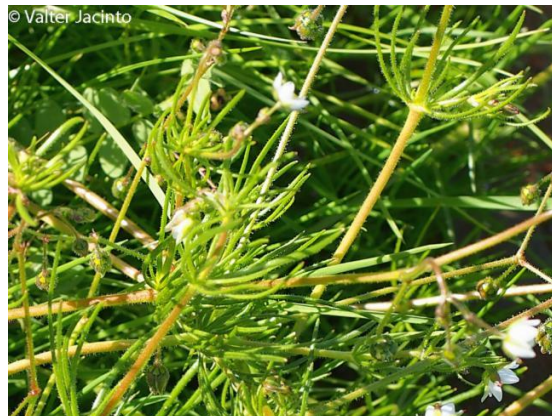
Slika 3. Poljska koljenika, Spergula arvensis L. https://images.nbnatlas.org/image/proxyImageThumbnailLarge?imageId=a7108325-06e3-4aa7-8fc3-f56a77031fdb