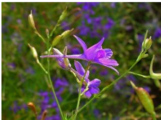
Slika 9. Kraljevski kokotić, Consolida regalis S.F.Gray

https://upload.wikimedia.org/wikipedia/commons/thumb/e/e0/Consolida_regalis_003.JPG/799px-Consolida_regalis_003.JPG