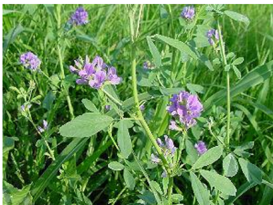
Slika 5. Lucerna, Medicago sativa L. https://legumeinfo.org/sites/default/files/tripal/tripal_organism/images/18.jpg