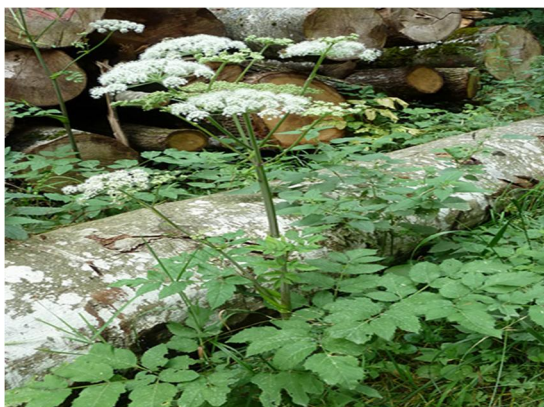
Slika 7. Šumska anđelika, Angelica sylvestris L. https://www.infoflora.ch/assets/piwigo/upload/2015/12/30/20151230161900-40d04419.jpg