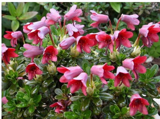
Slika 17. Dlakavi pjenišnik, Rhododendron hirsutum L.

https://i.pinimg.com/564x/d1/0d/a6/d10da6f765bafda2b21ade9b794f29b5.jpg