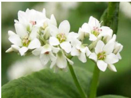
Slika 11. Heljda, Fagopyrum esculentum Moench.