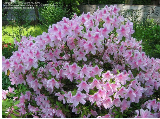
Slika 15. Azaleja, Azalea indica L.