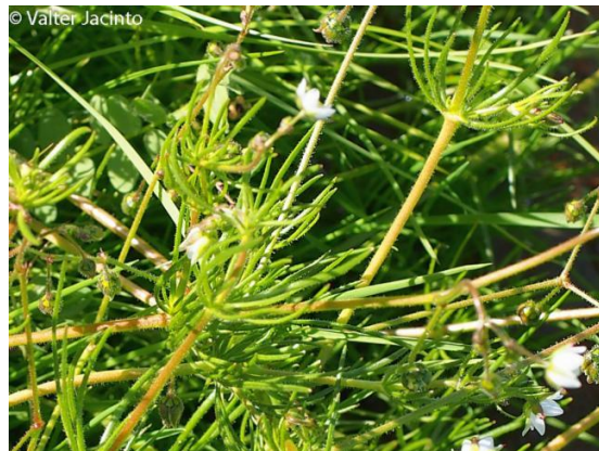
Slika 3. Poljska koljenika, Spargula arvensis L. https://images.nbnatlas.org/image/proxyImageThumbnailLarge?imageId=a7108325-06e3-4aa7-8fc3-f56a77031fdb