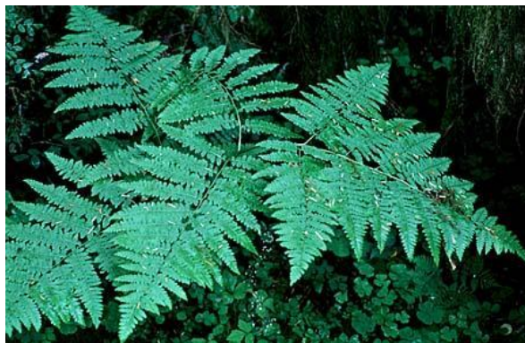
Slika 10. Paprat, Pteridium aquilinum (L.) Kuhn

Različak ( Centaurea cyanus L.) je izvrstan indikator pH tla zbog toga što je boja njegovih cvjetova u kiseloj sredini ružičasta, dok je u alkalnoj plava.