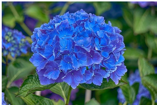
Slika 16. Hortenzija plava, Hydrangea macrophylla (Thunb.) Ser.

pH tla može utjecati i na boju cvijeta te se često navodi kako je za rod Hydrangea plava optimalna pH reakcija između 6,5 i 7,5, dok većina autora taj pH smatra optimalnim za uzgoj Hydrangeae bijele i ružičaste (Herak Ćustić i sur., 2005.).