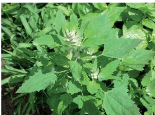
Slika 12. Bijela loboda, Chenopodium album L. https://upload.wikimedia.org/wikipedia/commons/thumb/0/01/ChenopodiumAlbum001.JPG/1024px-ChenopodiumAlbum001.JPG

Na plodnim i humusnim tlima mogu se naći različite korovske vrste: čičak, cikorija, loboda (Slika 12.), crna pomoćnica, mišjakinja, obična i mala kopriva (Slika 13.), rusomača i dr.