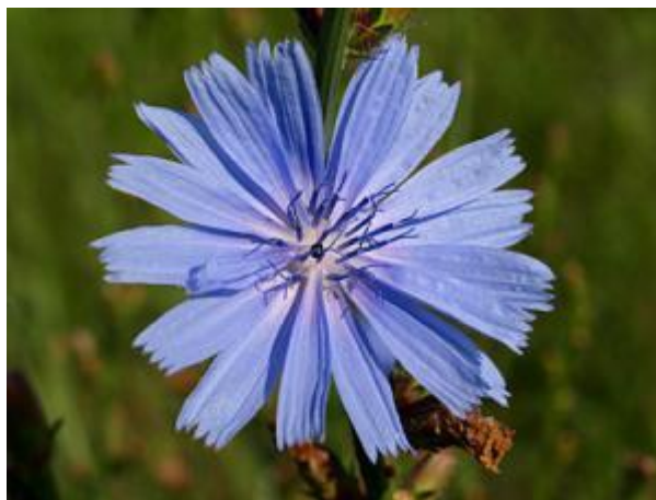
Slika 8. Cikorija, Cichorium intybus L.

( http://www.geograph.org.uk/photo/4027779 )