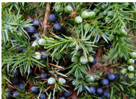
Slika 18. Borovica, Juniperus communis L.

Prema Brickellu (2003.) borovica ( Juniperus communis L.) (Slika 18.) zahtjeva pH iznad 7,2 dok Hartmann i sur. (1998.) smatraju da je optimalni za razvoj borovice između 4,5 i 6,5. Podaci o optimalnoj pH vrijednosti za uzgoj ruža ( Rosa sp ) (Slika 19. i 20.) u literaturi su različiti te se kreću od 4,5 do 7,0. (Herak Ćustić i sur., 2005.)