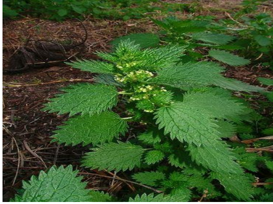
Slika 13. Mala kopriva, Urtica urens L.

http://www.homeo-herb.com/wp-content/uploads/2013/04/kopriva-mala.jpg