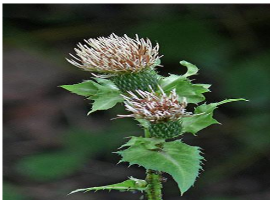
Slika 6. Zeljasti osjak, Cirsium oleraceum L.