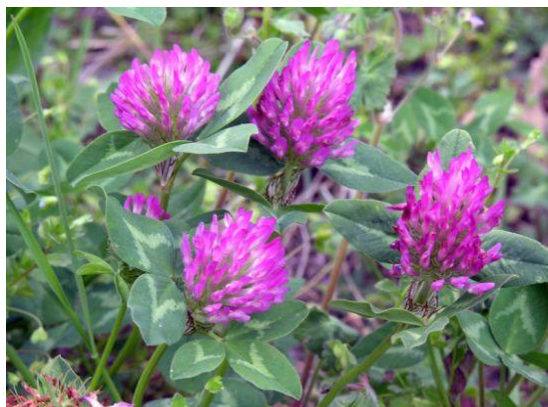
Slika 4. Crvena djetelina, Trifolium pratense L. http://luirig.altervista.org/cpm/albums/zepigi1/001-trifolium-pratense.jpg