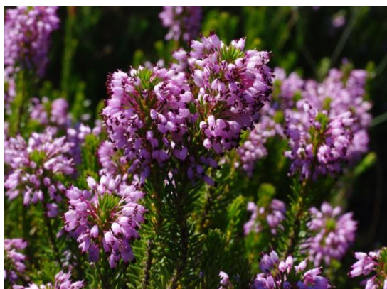
Slika 14. Erika, Erica multiflora L.

Pojam ukrasno bilje obuhvaća rezano cvijeće, trajnice, lončanice, travnjake, grmove i stabla. Prema Fincku (1982.) većina ukrasnog bilja zahtjeva optimalni pH između 5,5 i 6,0. Neke biljne vrste vole jako kisela tla (pH 4,0 - 4,5) kao npr. rod Erica (Slika 14.), Azalea (Slika 15.), Hydrangea (plava) (Slika 16.) i Rhododendron (Slika 17.) (Hartmann i sur., 1998., Brickell, 2003.)